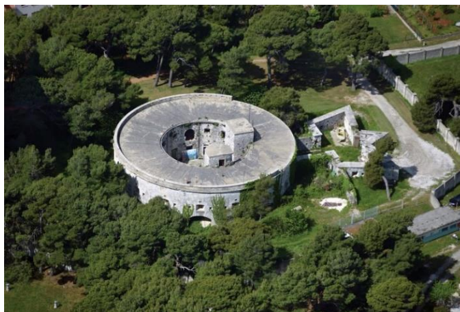
Slika 9. Utvrda Muzil

Utvrda Musil ili zvana još i „Maria Louise“ nalazi se na istoimenom otoku u gradskoj četvrti Pule, Stoja. Gradnja je započeta 1852. godine, a do 1855. godine dovršena je kružna utvrda promjera 35 metara. Ona predstavlja najveću pulsku utvrdu. 1859. dobila je izgled koji je prisutan danas te je dograđen otvoreni zid s tlocrtom u obliku potkove. Branila je pulsku ratnu luku s južnog dijela te je bila naoružana s topovima. Građena je tradicijskim stilovima gradnje s kamenom iz dobavljenim iz lokalnih kamenoloma. Godine 1878. nadalje je izgrađena topnička bitnica na novim nasipima utvrde. 1914. godine utvrda je opremljena sa šest topova u grlu topničke bitnice. Imala je podrum s vodospremom, prizemlje, kat i terasu. Nakon Drugog svjetskog rata korištena je kao skladište, a danas ju koristi Hrvatska vojska. Ova utvrda ima podrum, prizemlje, kat i platformu za smještaj topova. U vlasništvu je Grada Pule. 68