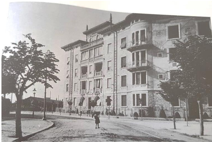
Slika 11. Pogled na vile Munz početkom 20. stoljeća

stanovanje najbliža hotelu Rivijera, sagrađena je 1901. godine, a sastoji se od podrumskih prostorija, prizemlja, tri kata, potkrovlja i svjetlarnika. 72