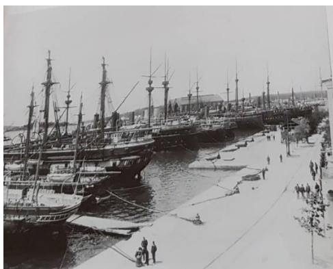
Slika 3. Pulsko brodogradilište u 19. st. (Izvor: Cvek., E. Pula u doba Austrije, str 10.)

Što se tiče komandnih položaja u Arsenalu i brodogradilištu, njih su držali vojnopomorski oficiri, a direkcijama su rukovodili inženjeri u službi Mornarice. Komandant arsenala bio je kontraadmiral. Ratna mornarica imala je u svom sastavu zaposlenih 148 inženjera raznih struka, od kojih je njih 113 radilo u Puli. U knjigama upisanih radnika bilo je zaposleno 2.405 ljudi. 74 njih bili su majstori, 1.511 bilo je civilnih radnika, 89 šegrta, 20 krojačica, 306 vojnih radnika, 113 pomoćnih mornara i 292 nosača tereta. Plaća zaposlenika iznosila je 860 tisuća guldena godišnje. 35