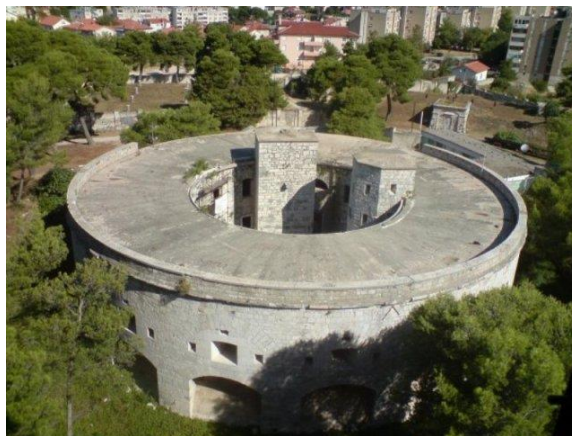
Slika 10. Utvrda Casoni Vecchi

Utvrda Casoni Vecchi nalazi se na današnjem Vidikovcu, ulici Monte Paradiso. Ona je prva utvrda koja je detaljnim urbanističkim planom „Vidikovac 1972.“ dobila namjenu kao omladinski dom, a zaštićena je kao arhitektonsko djelo iznimne vrijednosti. Započela je s izgradnjom 1852. godine i dovršena je 1854. godine. Promjera je 34 metara, kružnog je oblika i ima unutarnje dvorište. 1914. godine pretvorena je u skladište i vojarnu za smještaj posade. Danas je u funkciji omladinskog doma i koristi se za druženje mladih i glazbene manifestacije. 69