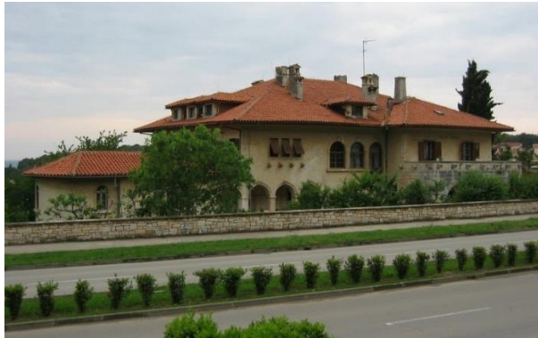
Slika 13. Vila Idola danas

Ova je vila jedinstveni tip ljetnikovca u Puli. Imala je visoko prizemlje, suteran, kat i potkrovlje, a u suteranu su bile prostorije za posluhu. Svaka je spavaća soba imala kupaonicu, a prostorije su zahvaljujući velikim prozorima vile dobro osvijetljene i prozračne. Vrt je bio bogato hortikulturno uređen. Nakon raspada Austro-Ugarske 1918. godine vilu je kupio jedan Marčanac. 76