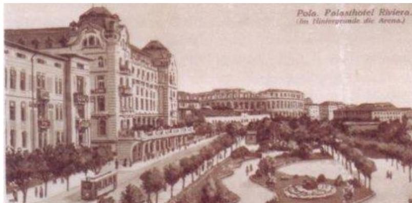
Slika 8. Hotel Rivijera u 19. st.

Danas je ovaj hotel kategoriziran samo jednom zvjezdicom i ima status svratišta. U njemu se nalazi 60 soba raspoređenih na pet katova. Trenutno ga vodi Arena Hospitality Group.