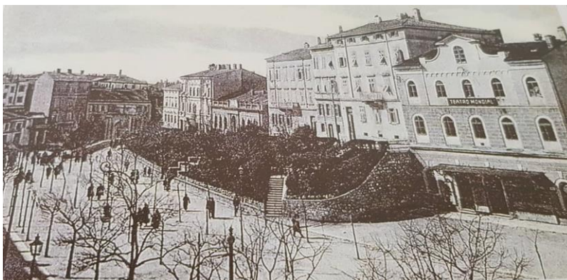
Slika 6. Park na Giardinima u 19. st. (Izvor: Cvek, E.,str. 61.)

Problem Pule bio je osiguranje stanova za sve ljude koji su naglo naselili grad. Plan stambene izgradnje izradila je Inženjerijska direkcija iz Pule, a vodio ga je časnik i plemić Viktor Domaševski. Prve stambene zgrade izgrađene su u Borgo San Policarpo, no one su bile predviđene samo za časnike i dočasnike Mornarice. No već nakon 1867. godine gradi se 60 novih zgrada u Puli, a u naredne tri godine preko petsto novih kuća. 45 1880. godine u gradu se nalazilo 1.244 zgrade i 17.777 stanovnika. Najslabije naseljeno bilo je područje šijane gdje se nalazilo svega nekoliko koliba i kućica.