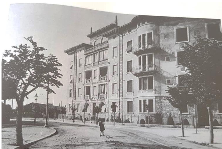
Slika 11. Pogled na vile Munz početkom 20. stoljeća

stanovanje najbliža hotelu Rivijera, sagrađena je 1901. godine, a sastoji se od podrumskih prostorija, prizemlja, tri kata, potkrovlja i svjetlarnika. 72