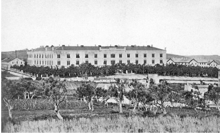
Slika 4. Mornarička bolnica u 19. stoljeću