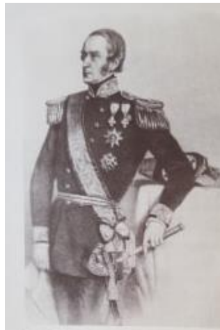
Slika 1. Danski admiral Hanz Birch Dahlerup

za izgradnju ratne luke i Arsenala i javio svoje dojmove caru. Problem je bio taj da koje god je mjesto posjetio, nalazio je premalo prostora za razvitak u širinu te oskudnost prirodnih izvora za opskrbu velikog naselja. Sva mjesta su mu izgledala kao da bi odgovarala za izgradnju manjih objekta, a ne impozantnog glavnog arsenala kojeg su htjeli izgraditi. Kada je uplovio u Pulu, sinula mu je ideja kako mogu nasuti čitavu sjeveroistočnu uvalu pulske luke i tako dobiti željeni prostor i izgraditi najljepši arsenal na svijetu. 12 U austrijskom Admiralitetu postojala je snažna oporba prema ideji Pule kao glavne ratne luke. Pula je djelovala beznačajno, nije imala trgovačka poduzeća, teren je bio neprikladan, infrastruktura nepostojeća, a životno okruženje odbojno zbog bolesti malarije. Bez obzira na sve te činjenice, car se zbog prijedloga Dahlerupa odlučio za Pulu. Ova odluka bila je posljedica političkih napetosti, ali i ponajviše carevim oduševljenjem Dahlerupom koji je bio odličan poznavatelj svih tadašnjih europskih mornarica. Puljski zaljev bio je prostran i dubok te dobro zaštićen stoga je car Franjo Josip I. smatrao da ima bolje značajke od Trsta i Kotora. 13