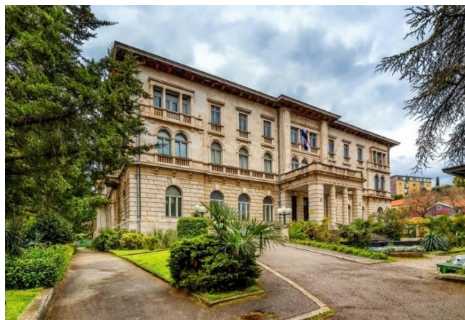
Slika 7. Nekadašnji Marine Casino, današnji Dom Hrvatskih Branitelja (Izvor:

1910. godine zgrada je srušena te je 1913. godine izgrađena nova, glamuroznija zgrada. Nakon Prvog svjetskog rata zgrada je bila sjedište talijanske uprave, a danas je poznata kao Dom hrvatskih branitelja te se njoj svake godine održava Sajam knjige u Istri.