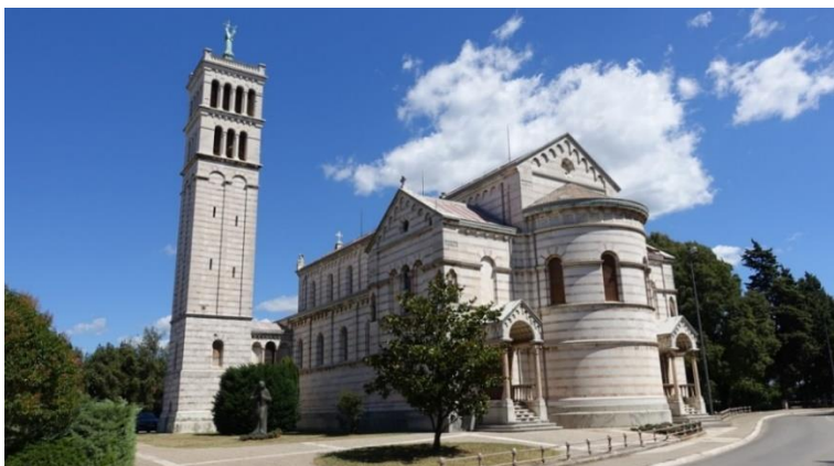
Slika 5. Mornarička crkva u Puli

Mornarička crkva u Puli izgrađena je pri kraju 19. stoljeća. Kamen temeljac položen je 1891. godine povodom godišnjice pobjede u bitci kod Visa. Voditelj radova bio je barun i mornarički časnik Maksimilijan von Sterneck Daublebsky. Projekt izgradnje crkve uključivao je i okoliš oko crkve te mornarički vidikovac iznad pulskog zaljeva. Ceremonija inauguracije obavljena je 1898. godina prije nego što je crkva uopće bila završena. Crkva je dugačka 30 metara te široka 19 metara, a zvonik je visok 30 metara. U razdoblju od 1948. do 1965. godine iz nje je odneseno mnogo vrijednih predmeta među kojima su bile i orgulje. Danas je župno središte i krase Pulu kao još jedna građevina iz doba austrijske vladavine. 39