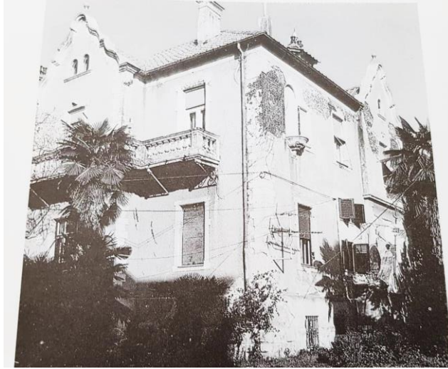
Slika 12. Vila Horthy u Budičinovoj ulici- August Wagner, 1905.

Vila Horthy urbanistički i povijesno je jedna od najzanimljivijih građevina, koja izgleda kao „vila dvorac“ sa svojom visokom kulom i valovitim zabatima na fasadi, šiljastim krovom i vijencem visećih arkada. Ona predstavlja spoj gotike, renesanse i alpskih stilskih elemenata. Okoliš vile bio je bogato uređen. Ovom vilom Pula je obogaćena s novim stilovima i pravcima arhitekture. 75