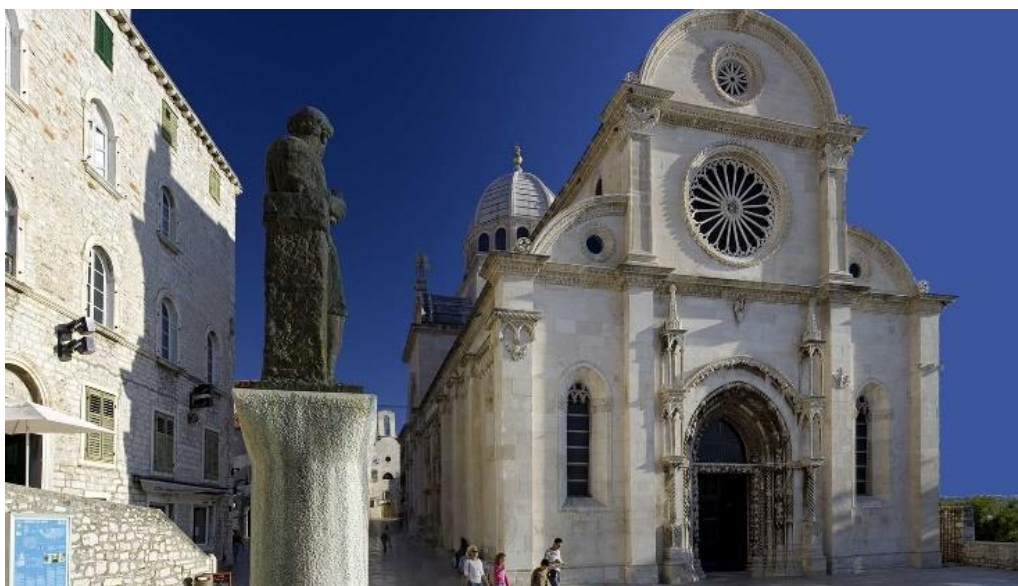
Slika 7. Katedrala sv. Jakova

katedrale završava trima apsidama. Šibenska se katedrala smatra najljepšim primjerom umjetničkog dosega svojega doba u Hrvatskoj. Izgradnja katedrale dovršena je 1536., a 1555. biskup Ivan Lucije Štafilčić ju je posvetio. Katedrala je prošla temeljitu obnovu u 19. stoljeću te je nakon toga ponovno posvećena 1860.