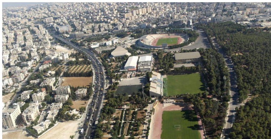
Slika 23. Prikaz glavnog grada Jordana – Amman