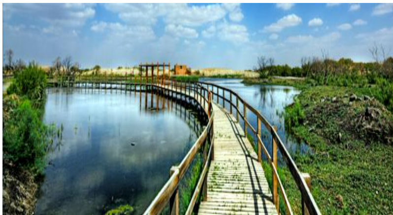
Slika 16. Most u rezervatu Al Azraq za promatranje ptica