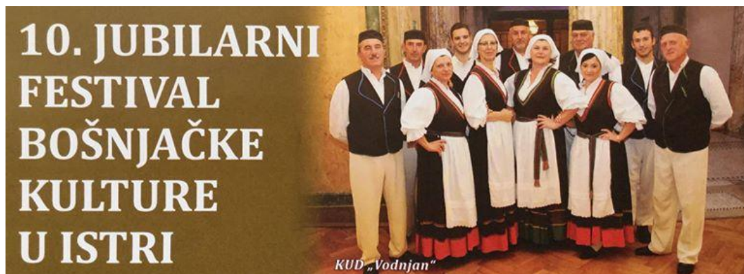
Slika 11. KUD Vodnjan