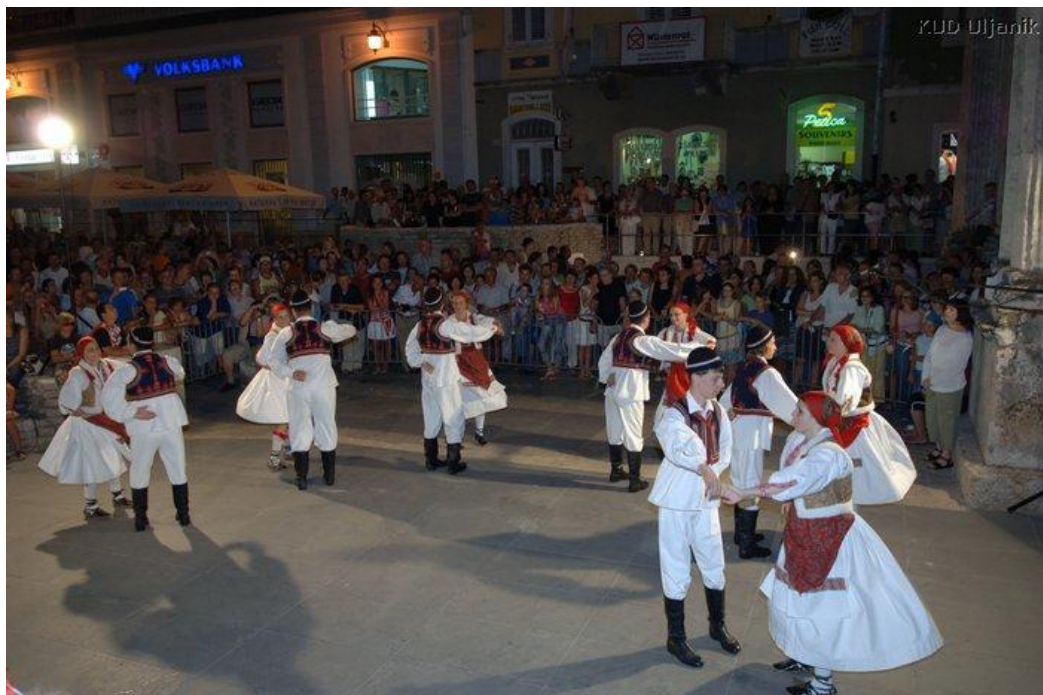
Slika 7. KUD Uljanik – Balun

(Božac, Božić, Prenc, Tkalčec, Vrtačić: Folklorni plesovi Istre u nastavi tjelesne i zdravstvene kulture, CD/DVD)