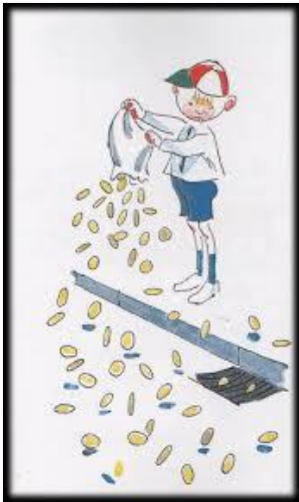
Slika 8: Pale je sam i radi što god želi 38