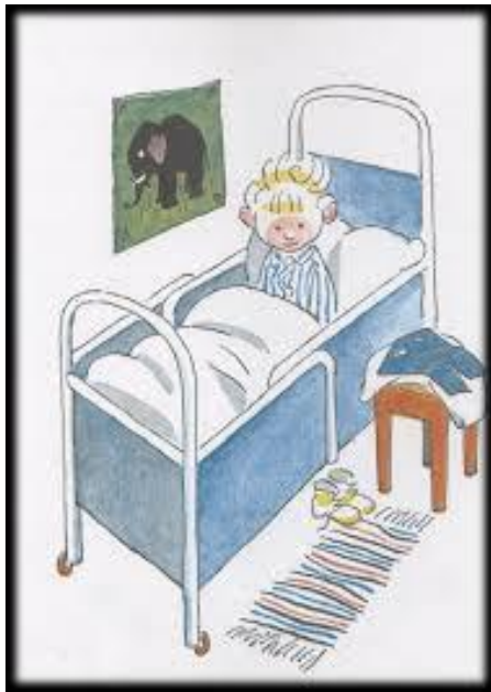
Slika 5: Dječak Pale se budi 35

Zaplet priče počinje kada Pale izađe na ulicu u potrazi za svojim roditeljima i shvati da nema nikoga. Prva reakcija je bila sreća jer je mogao uzeti i raditi što je htio, a nije bilo nikoga da mu prigovori. Pale je posjetio banku i tamo uzeo sav novac kako bi si kupio što god poželi. No problem je bio što nije imao kome dati taj novac pa ga je ljutito razbacao.