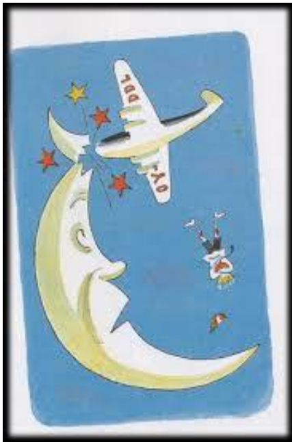
Slika 11: Dječak Pale avionom želi obići cijelu zemlju 41