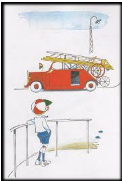
Slika 10: Pale vozi auto u potrazi za ljudima 40

Rasplet priče odvija se kada Pale vozi auto u potrazi za ljudima te avionom želi obići cijelu Zemlju. Na kraju priče se Pale budi, a uz njega je njegova mama.