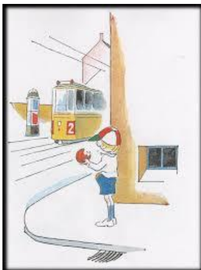
Slika 6: Pale izlazi na ulicu 36

Zaplet priče počinje kada Pale izađe na ulicu u potrazi za svojim roditeljima i shvati da nema nikoga. Prva reakcija je bila sreća jer je mogao uzeti i raditi što je htio, a nije bilo nikoga da mu prigovori. Pale je posjetio banku i tamo uzeo sav novac kako bi si kupio što god poželi. No problem je bio što nije imao kome dati taj novac pa ga je ljutito razbacao.