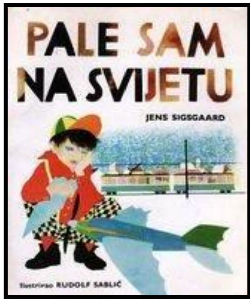
Slika 4: Naslovna stranica knjige Pale sam na svijetu 34

Događanje ove priče počinje realistično kada se dječak Pale budi i otkrije da je sam u kući. Za njega to nije strašno, a to je zapravo situacija u kojoj se današnja djeca vrlo često mogu naći.