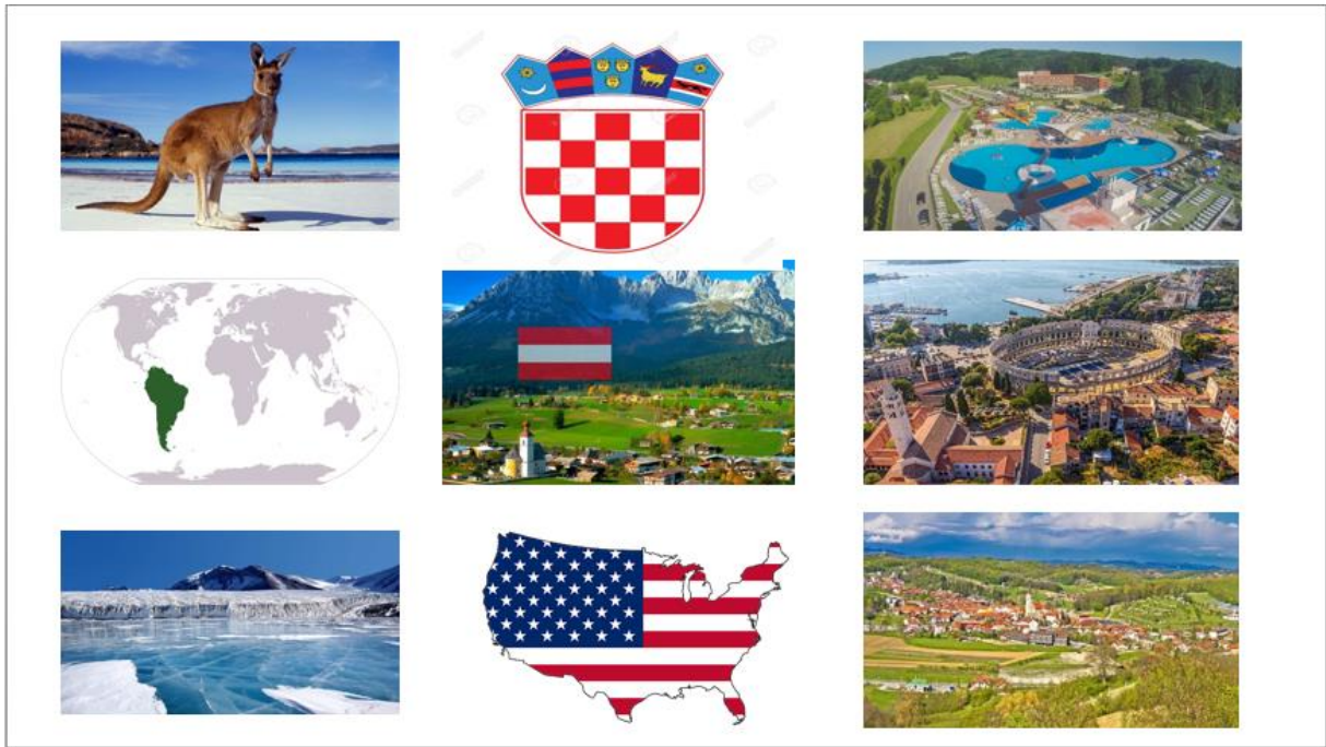
Slika 2. Prikaz slajda s prezentacije