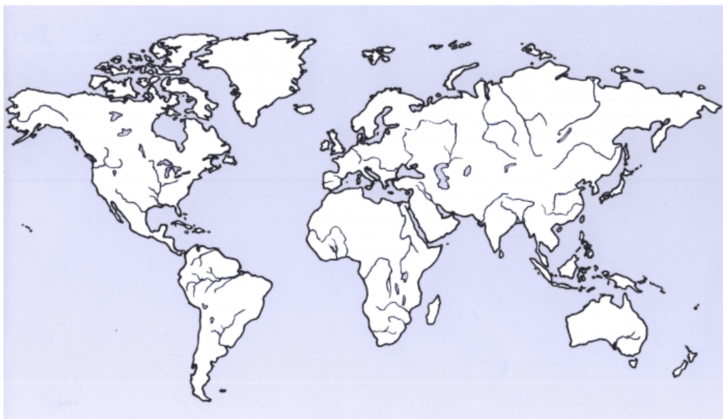
Slika 3. Slijepa karta za domaću zadaću