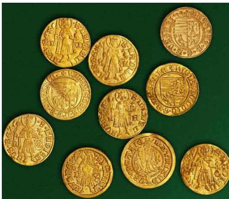
Ugarski zlatni floreni (XV. st.)

Uveden tijekom XIV. stoljeća. Izvori ga donose i pod imenom dukat . Ime floren (florin, odnosno forinta) dolazi od lat. flos kojim se označavalo cvijeće, a nalazilo se na grbu Firence. U petnaestostoljetnoj je Slavoniji jedan floren vrijedio 70 banskih dukata, a ugarski zlatni floren 90 banskih dukata. 60 Ugarsko-hrvatski su kraljevi kao nositelji prava korištenja rudnih bogatstava i nositelji prava kovanja novca ustrajno čuvali čistoću i propisanu težinu svojih novaca pa je i ugarski zlatni floren stoljećima bio na cijeni u bankarskim i poslovima mijenjanja novca diljem Europe. Upravo je zato i postojao veliki odliv tog novca što je rezultiralo kontinuiranim nastojanjem vladara da kovanjem novih zlatnika podmiri tržište novca u vlastitim krunovinama.