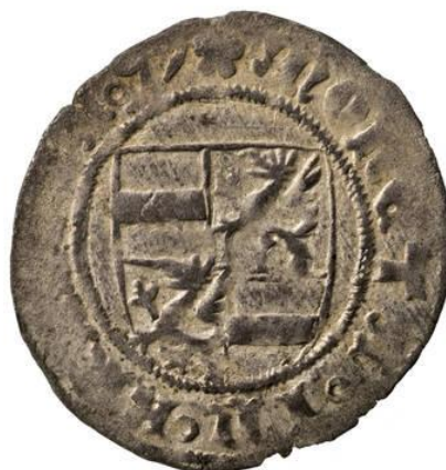
Krajcar bana Jana Vitovca (1459.) 59

Od njemačkog izraza kreuzer (križ). Novčić je nazvan prema dvostrukom križu koji se nalazi na naličju. Sitan novac, mjeden i različite vrijednosti. U XIII. i XIV. stoljeću su se kovnice nalazile u Meranu (Južni Tirol) te u Veroni. Kod nas se krajcar najviše koristio od 1527. godine te isto tako kada je Ferdinand II. bio okrunjen kao hrvatski i slavonski kralj. 58