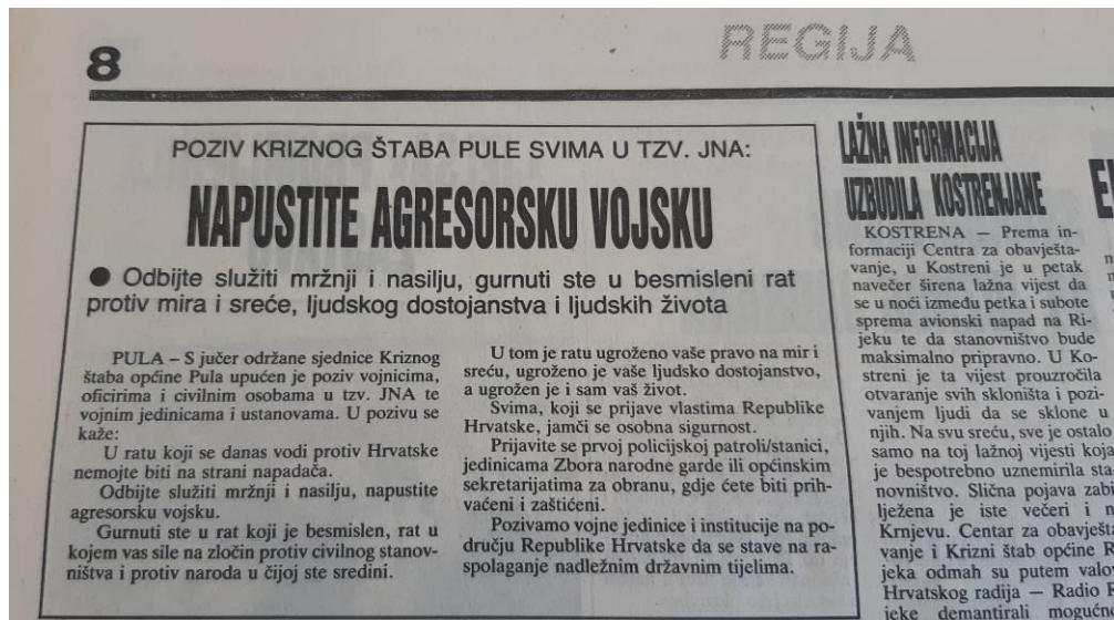
Slika 5. Krizni štab Pule preostalim armijskim djelatnicima o besmislenosti i tragediji ratovanja te poticanje da napuste JNA 228

Dana 17. rujna Jugoslavenska ratna mornarica (JRM) blokirala je pulsku luku. 229 Plovila nisu smjela uplovljavati i isplovljavati. 230 Dana 19. rujna nije propušteno pet njemačkih i dvoje austrijskih brodova za krstarenje s 25 članova posade. Imali su samo usmene dozvole. 231 Blokada je naštetila poslovanju tvornice cementa Giulio Revelante. 232 No ona je još prije negativno poslovala čemu su doprinijeli ratno stanje, nesigurnost i oprez stranih suradnika. 233