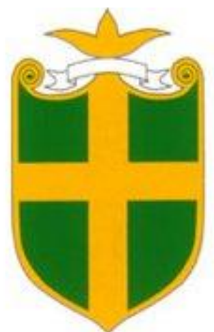
Slika 5. Svečani grb Pule (RH) 129