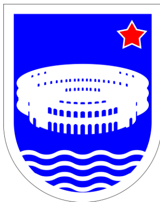
Slika 2. Grb Pule (SRH) 126

"Grad Pula ima grb i zastavu. Grb Grada je povijesni grb Grada Pule. Grb Grada Pule je štit zelene boje u kojem je latinski križ zlatne (žute) boje. Krakovi križa dodiruju rub štita. Za svečanu službenu uporabu ističe se grb na renesansnom štitu posebno oblikovan (uglovi, sredina gornjeg ruba i dno su zašiljeni), obrubljen i odozgo ukrašen bočnim uvojcima i središnjim stiliziranim cvijetom ljljana povezan sa križem bijelom lentom na postamentu. Zastava Grada Pule je pravokutnik zelene boje u kojem je latinski križ zlatne (žute) boje. Grb i zastava koriste se na način kojim se ističe tradicija i dostojanstvo Grada Pule." 125