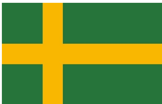
Slika 6. Zastava Pule (RH) 130

Građani su jasno i čvrsto odbacili nametanje agresivnog hrvatstva, a zalaganje za mir i ravnopravnost bila je dijeljena odlika. Jugoslavija je za mnoge bila faktor koji je zaslužan za pripojenje Istre Hrvatskoj i unutar kojeg je poluotok u novije vrijeme bio jedna od najrazvijenijih regija. Regionalizam je bio snažna pojava suprotstavljena desnim strankama koje su se zalagale za hrvatski nacionalni identitet i teritorijalnu cjelovitost. Tvrdile su da se ugrožava "opća volja" pri čemu je trebalo održati "narodno jedinstvo". 131 Godinu dana poslije SKH-SDP je izgubio ugled, autoritet i podršku te se IDS nametnuo kao najsnažnija istarska stranka. 132