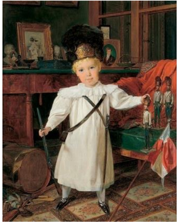
Prilog 3. Franjo Josip, tri godine

Od šeste godine života Franjo Josip je bio pod budnim okom pomno izabраниh tutora. Do trinaeste godine života imao je trideset i dva sata poduke tjedno, a od trinaeste je imao pedeset sati tjedno. Sofija i Metternich 5 su odredili grofa Heinricha Bombellesa kao glavnu osobu u obrazovanju Franje Josipa, još su pridonijeli i grof Johann Coronini, s kojim je Franjo Josip imao blizak odnos zbog Coroninijeve časničke službe, zatim zapovjednik Franz von Hauslab koji je provodio njegovu vojnu obuku. Osim osnovnih