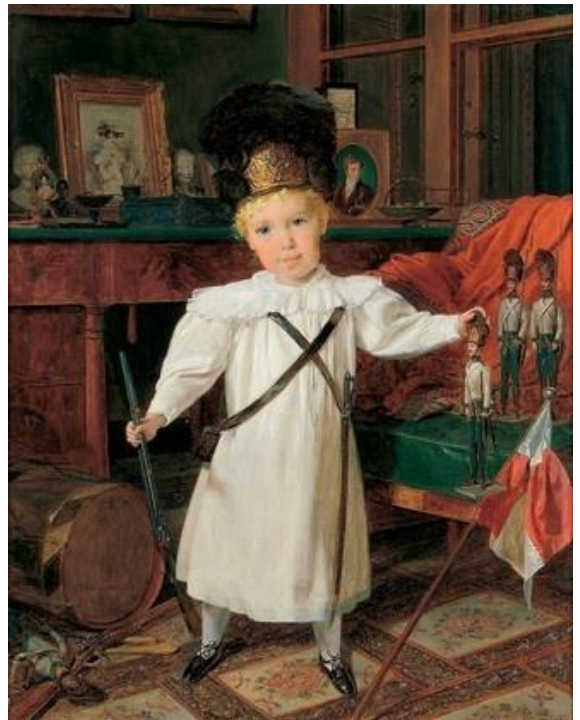
Prilog 3. Franjo Josip, tri godine

predmeta kao što su mačevanje, glazba, ples i crtanje, Franjo Josip je učio i njemački, francuski, ali i češki, mađarski, poljski i talijanski. Na trinaesti rođendan Franjo Josip je mogao prisustvovati prvom lovu sa svojim ocem, što će postati njihova strast i zajednička aktivnost. Tada je dobio i još predmeta, astronomiju, pravo i filozofiju, koju mu je predavao konzervativni svećenik Joseph Othmar von Rauscher. Sam Metternich je preuzeo podučavanje upravljanja ljudima i vođenja državnih poslova. 6