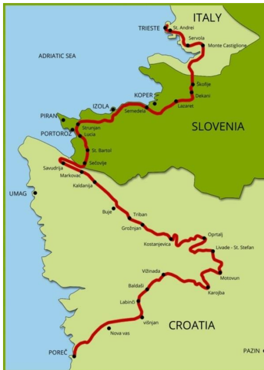
Slika 4. Karta Parenzane