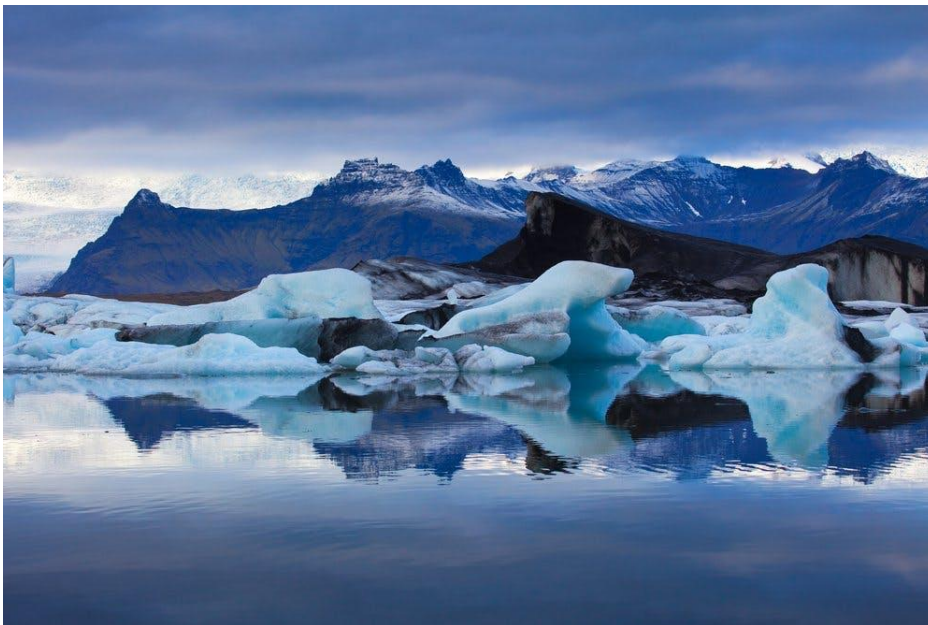
Slika 2. Vatnajökull glečer