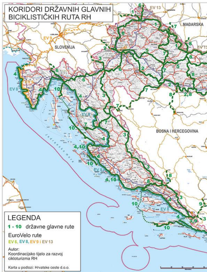
Slika 3. Prikaz koridora državnih glavnih biciklističkih ruta RH