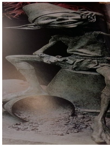
Slika 4. Patuljak Brownie

Brownie je patuljak iz Britanije. On pomaže ljudima pri obavljanju kućanskih poslova, ali obično samo noću. Plaća ga se uvijek na isti način i to tako da mu se ostavlja zdjelica najboljeg mlijeka ili vrhnja te komadić svježe ispečenog kruha ili kolača. Znaju se jako uvrijediti ako im se navedno izravno uruči. Odjeveni su u poprilično istrošenu odjeću, ali ako im se pokuša pokloniti nova uvrijede se ili zauvijek odlaze jer smatraju da su na taj način isplaćeni za ono što su radili (Allen 2005: 20).