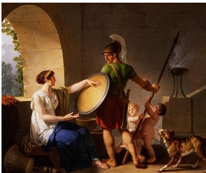
Slika 1. Spartanska žena daje štit svome sinu.

Tomu u prilog ide i činjenica da otac nije imao pravo odlučivati hoće li se dijete othranjivati, nego ga je morao dovesti na mjesto koje su Spartanci nazivali „narodno svratište“. Tamo su se skupljali najstariji članovi njegova plemena koji su pregledavali dijete. Ako je dijete bilo zdravo i dobro građeno, naredili su ocu da ga othrani dodijelivši mu jednu od devet tisuća zemljišnih čestica. Međutim, ako dijete nije bilo zdravo, već slabo i kržljivo, naredili su da se baci u provaliju s planine Tajget smatrajući da takvo dijete neće koristiti sebi ni državi (Zaninović, 1985).