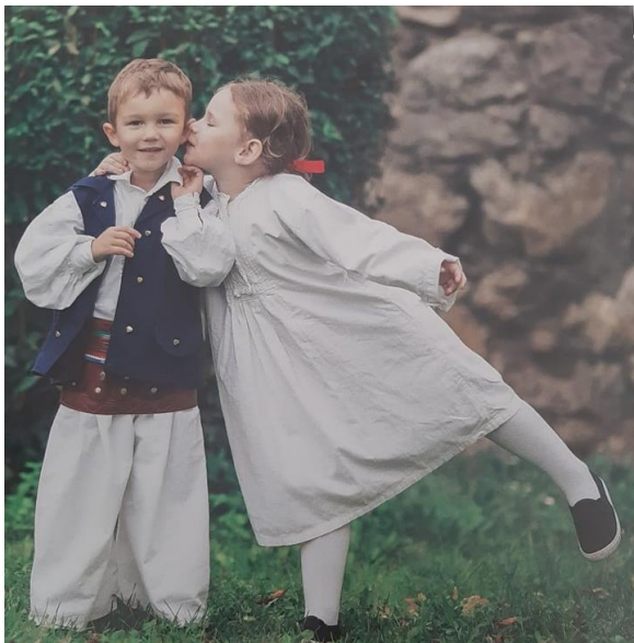
Slika 6. Dječja narodna nošnja

Za razliku od muške i ženske tradicijske odjeće, dječja je odjeća bila jednostavna i skromna (Slika 6.). Majke su šivaćim strojem ili na ruke svojoj djeci najčešće šivale stomanje 15 . Njih su nosile djevojčice do šeste ili sedme godine. Stomanja se oko vrata i prsa ukrašavala uskom čipkom koja je bila širine oko 2 cm. Rukavi su bili tričetvrt, ravnog kroja bez nabora i obrubljeni čipkom na krajevima. Dječaci su do treće godine također nosili stomanje, a kasnije su odijevali platnene gaće i košuljicu. Njihova je odjeća bila jednaka beloj robi koju su nosili odrasli muškarci. Djevojčice su u razdoblju od sedam do deset godina na stomanju počele stavljati zaslone koji je imao cvjetne uzorke. Zaslone su šivale majke i to od materijala koji je ostao od šivanja njihovih zaslona. Oni su u struku bili lagano nabrani te su imali usku pasicu s vrpcama koje su se vezale na leđima. Kasnije, u razdoblju od deset ili jedanaest godina, dječaci i djevojčice počinju nositi svakidašnju nošnju kakvu inače nose djevojke i mladići. Na prvoj svetoj pričesti djeca prvi put dobivaju svečanije tradicijsko ruho. Krajem 20. stoljeća dječja nošnja, kao i odrasla, izlazi iz uporabe te ju ponekad oblače još dječaci prilikom primanja sakramenta prve svete pričesti, dok ju djevojčice ne oblače čak ni tada (Luketić Delija, 2018).