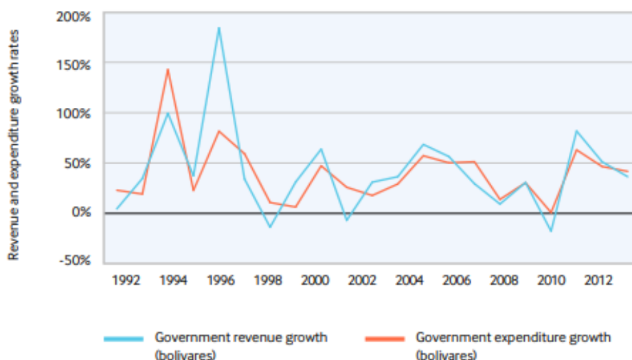
Graf 1: Volatilnost troška u Venezueli prati volatilnost prihoda