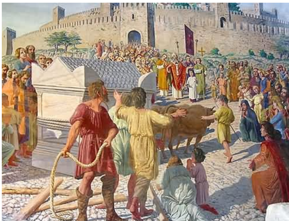
Slika. 8. Kameni sarkofag Sv. Eufemije u Rovinju