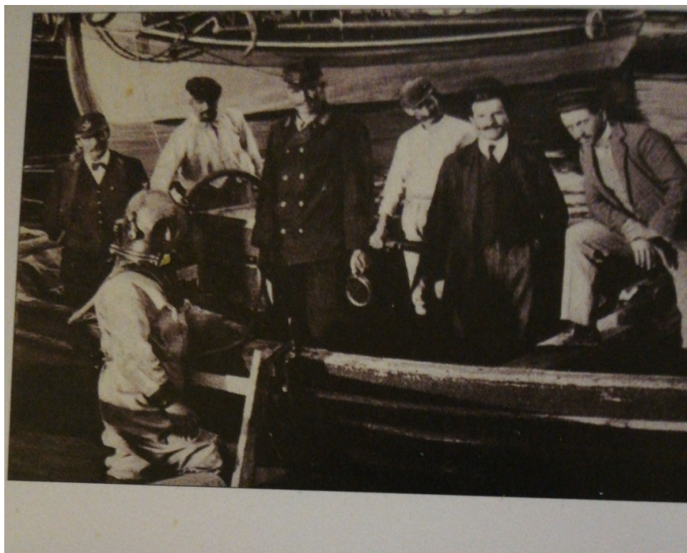
Slika 7. Brod „Laudon” i austrougarski admiraltet