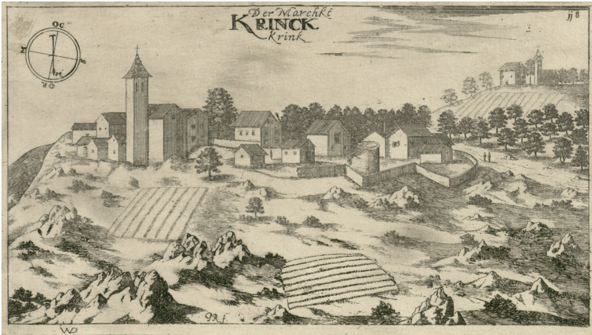
Slika. 4. Valvasorov crtež Kringe