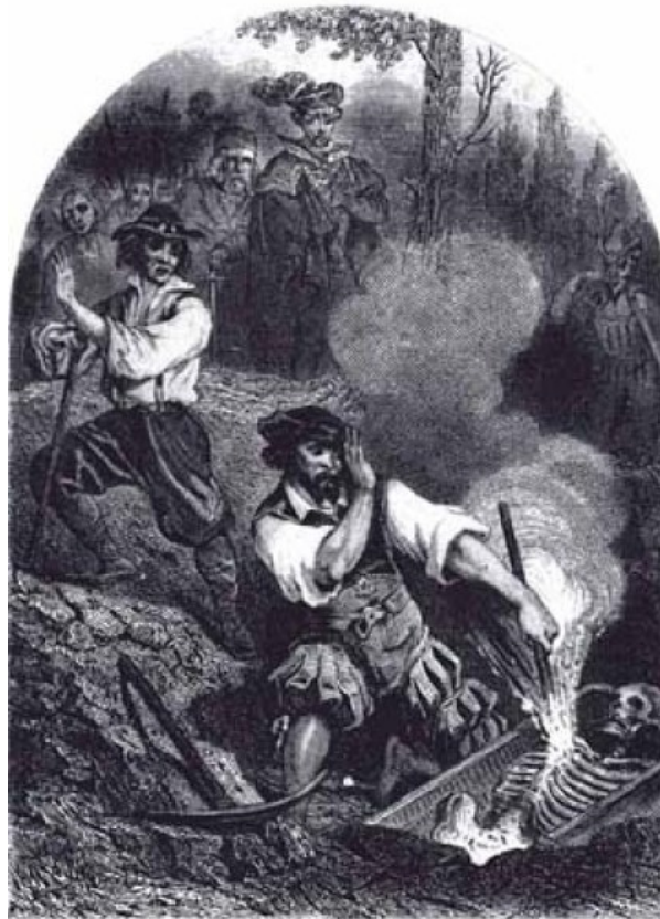
Le Vampire, lithographie de R. de Moraine, tirée des Tribunaux secrets.