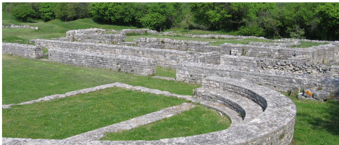
Slika.3. Ostaci zidina Nezakcija