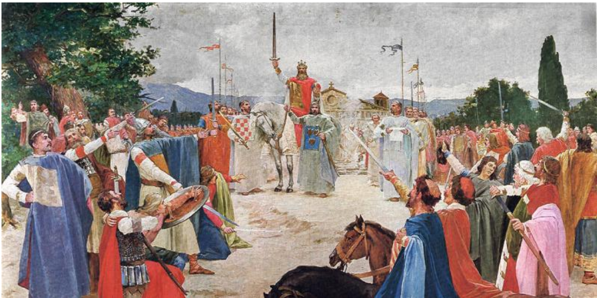
Slika. 10. Ilustracija Kralja Tomislava i njegovog žezla, krune i mača

Izvor: https://croexpress.eu/zanimljivosti/4310/legenda-o-kruni-kralja-tomislava/ , 17. listopada 2019.