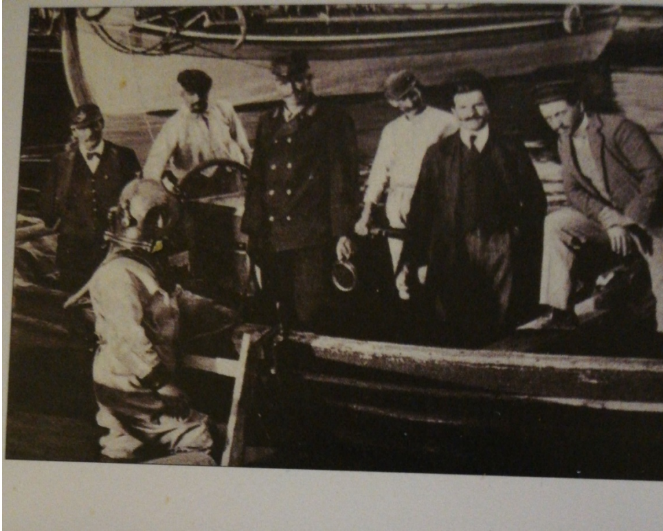
Slika 7. Brod „Laudon” i austrougarski admiraltet