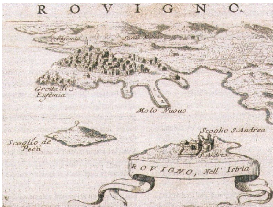
Slika. 6. Ilustracija grada Rovinja