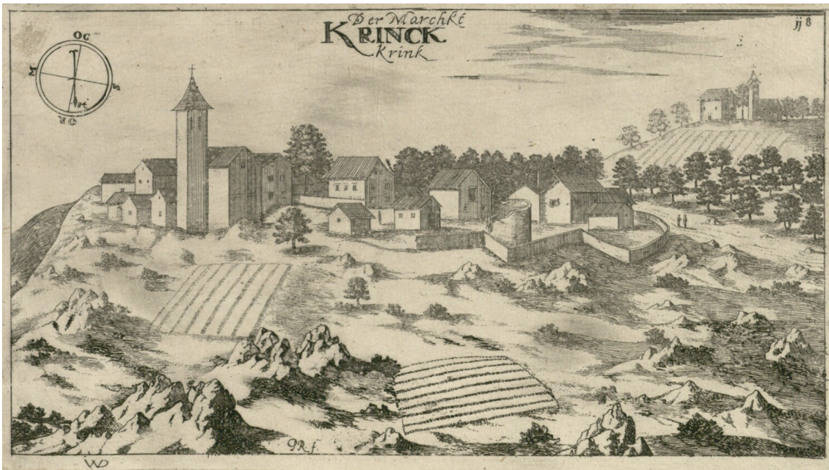
Slika. 4. Valvasorov crtež Kringe