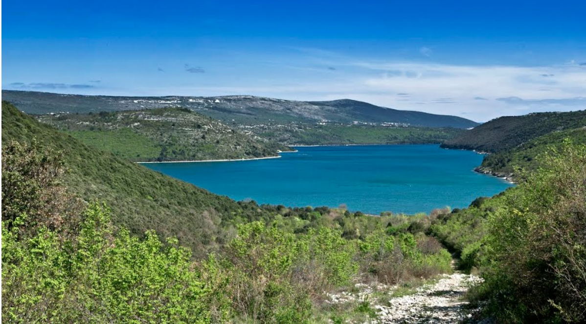
Slika. 11. Raški zaljev