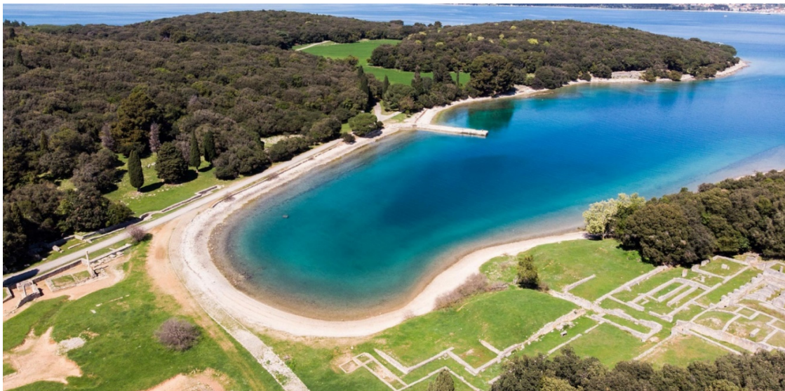
Slika. 12. Uvala Verige na Brijunima