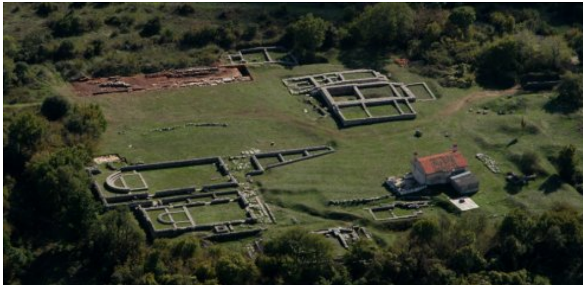
Slika. 2. Arheološko nalazište na brežuljku Glavica kraj Valture, istočno od Pule