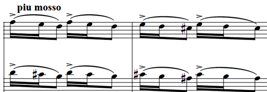
Primjer br. 25 (takt 43 - 44)

Sljedeći motiv (Primjer br. 25) je sličan prethodnom, no ovaj put su u lijevoj i desnoj ruci uzastopne sekunde koje zajednički čine nizove paralelnih decima.