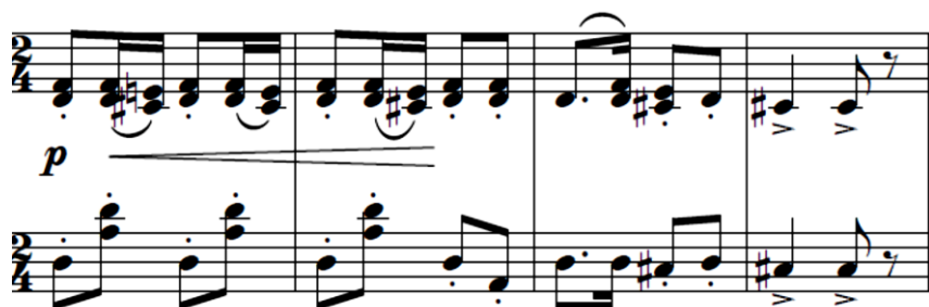
Primjer br. 24 (takt 31 - 34)

Sljedeći motiv (Primjer br. 25) je sličan prethodnom, no ovaj put su u lijevoj i desnoj ruci uzastopne sekunde koje zajednički čine nizove paralelnih decima.