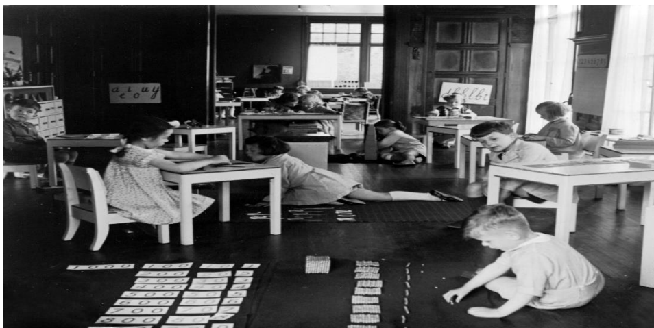
Slika 5. Počeci Montessori učionica

https://45conversations.com/history-of-montessori-method/