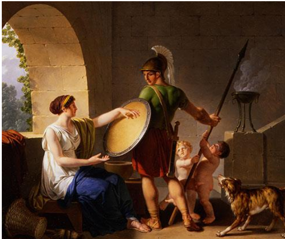
Slika 4. Spartanska žena daje štit svome sinu

Spartanke su bile stroge majke, te su trebale prenositi spartanske zasade. U ratno doba, majka je svome sinu dala štit i rekla bi mu da se iz rata mora vratiti noseći štit ili da leži mrtav na njemu. Majke su se radovala kada bi im sin poginuo u ratu.