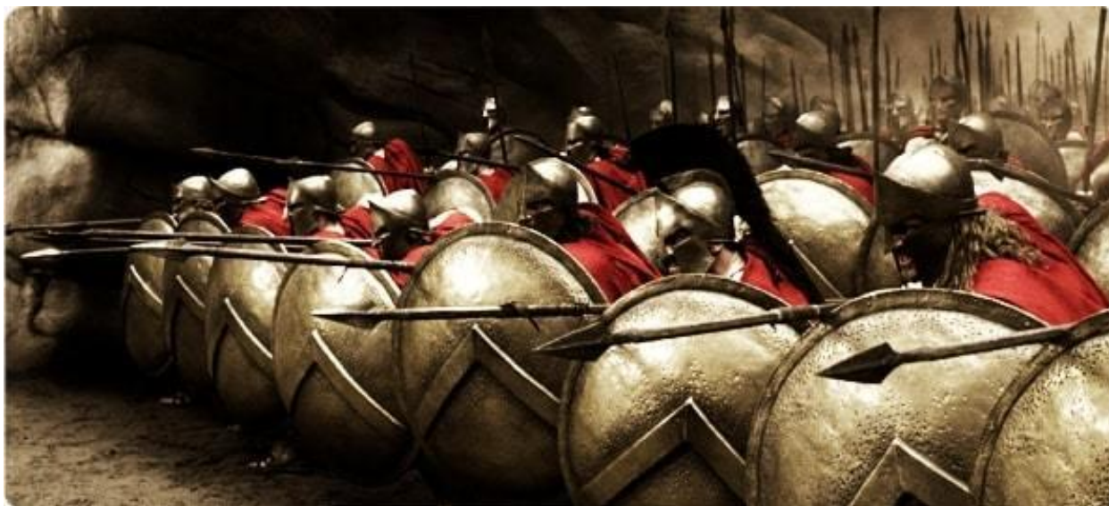
Slika 2. Spartanski vojnici u pripremi za borbu