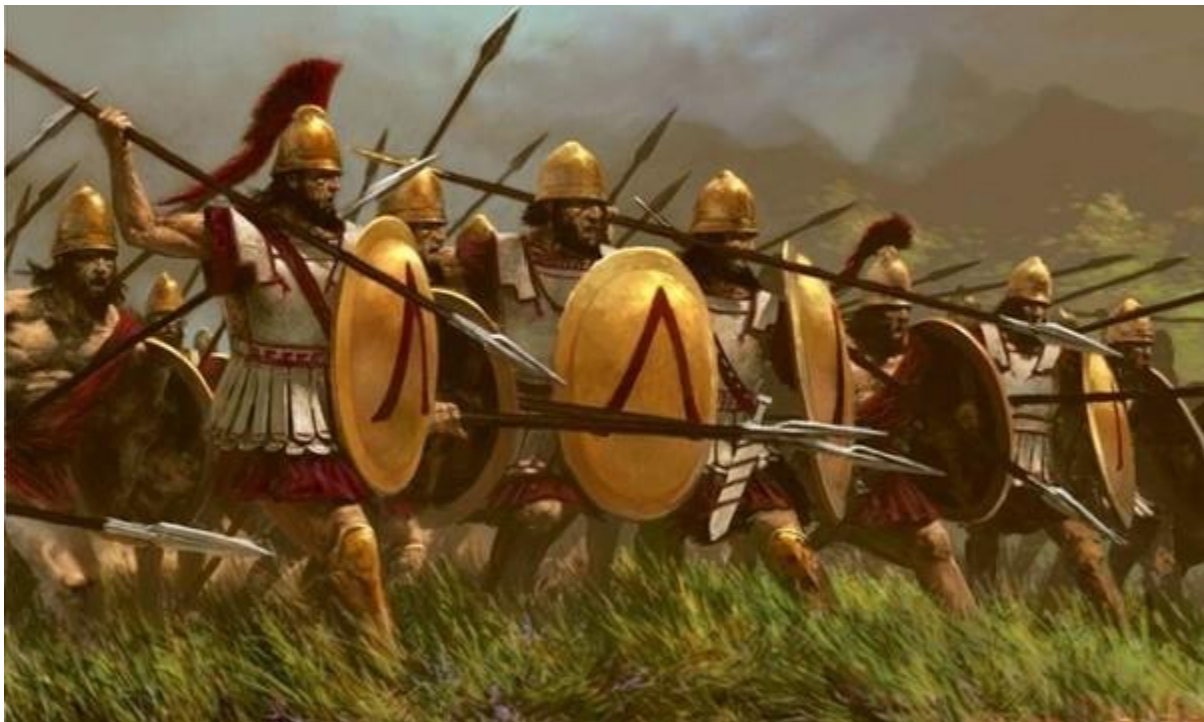
Slika 1. Prikaz spartanskih vojnika

Odrastanje u Sparti je nadzirala država , osim obrazovanja nadzirala je i spartanski odgoj djece, što nije bio slučaj u drugim polisima. Spartanci su imali misao da stvore čvrste i disciplinirane vojnike te su im trebale snažne i zdrave žene koje će roditi još spartanskih vojnika.