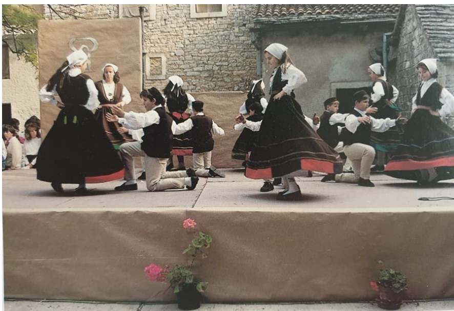
Slika 6. Balun, UKUD „Neven“, Pula

Glazbena pratnja baluna najčešće se izvodi na sopelama ili mihi, nešto rjeđe na šurlama ili cindri, a danas često nailazimo na dijatonsku ili usnu harmoniku. 36