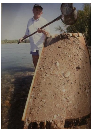
Slika 10. Tehnika ispiranja zlata

Amalgamacija je obuhvaćala završni postupak obrade zlata. Naime, u ovom se postupku koristila živa, kako bi se zlatne čestice međusobno povezale. U manju posudu bi se stavila živa s vodom te bi se dodala zlatna zrnca, nakon čega bi se zdjela pomicala tako dugo, dok se sva zrnca ne bi sjedinila. Potom bi se živa filtrirala pomoću lanene krpe, koja bi se omotala okolo amalgama i zategnula špagom. Na samom kraju bi se oblikovana kuglica zagrijala na visokoj temperaturi što bi otopilo živu te bi ostala samo kuglica od zlata što je ujedno bio i gotov proizvod.