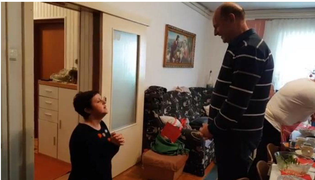
Slika 12. Međimursko „bajanje“ po kućama

Svrha je njihova jasna: donošenjem poljoprivrednih proizvoda i predmeta u kuću željelo se da toga ne ponestane sljedeće godine, tj. da priroda podari što je izloženo: bacanjem graha željelo se što više peradi, da bi se u bajanju i koljanima to direktno izrazilo govorom. Sve je to razumljivo kad se podsjetimo koliko je seljak ovisan o zemlji na kojoj živi.