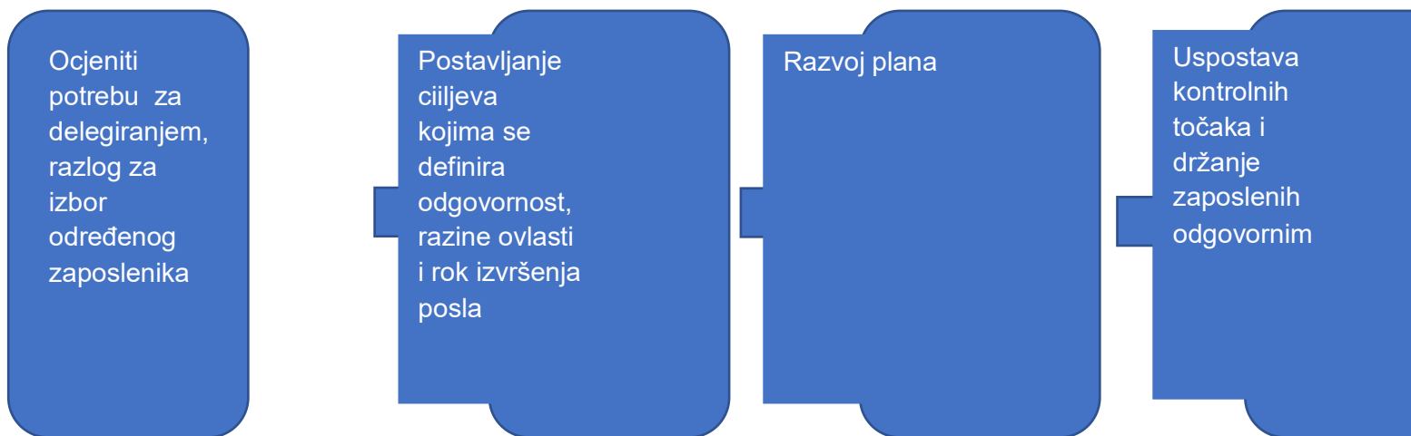
Slika 1. Koraci u procesu delegiranja