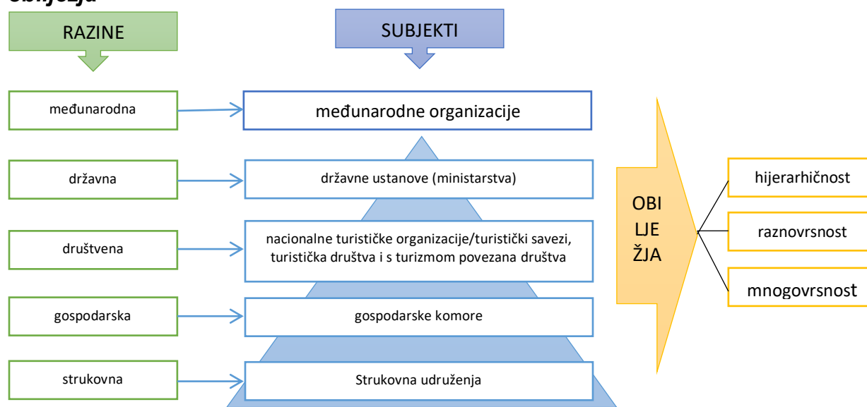
Slika 1. Razine organizacije turizma i subjekti uključeni u turizam te njihova obilježja