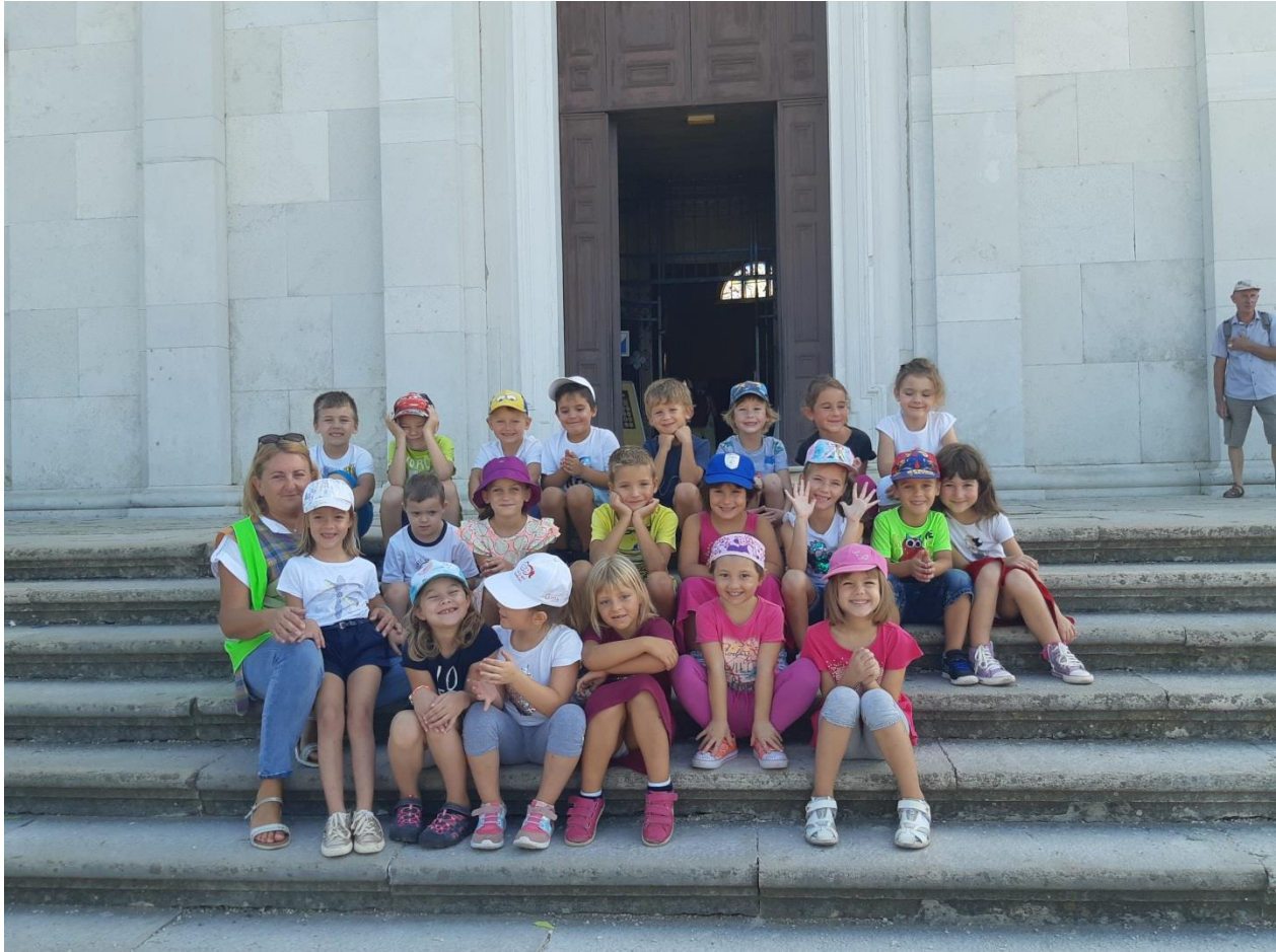
SLIKA 1: Odgojna skupina Rožice ispred ulaza u crkvu svete Eufemije.

napomenuti da je posjet crkvi bio unaprijed dogovoren i organiziran te je djeci bila dodijeljena stručna osoba koja ih je vodila kroz različite dijelove crkve i na prikladan im način pripovijedala o legendi o svetoj Eufemiji.