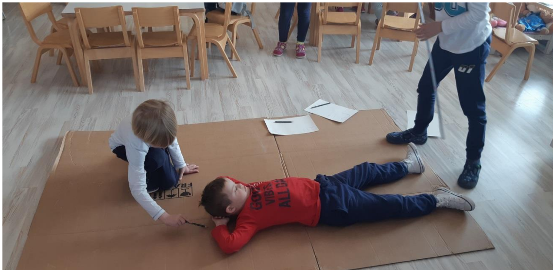
SLIKA 4: Uspoređivanje dimenzija sarkofaga i izračunavanje stane li, i koliko, djece u sarkofag.