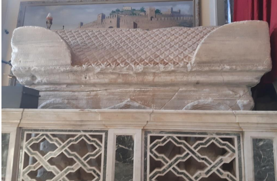
SLIKA 2: Sarkofag u kojem se nalazi tijelo svete Eufemije.

svetice. Sarkofag je fascinirao djecu te su željela saznati više informacija o veličini, načinu izrade, materijalu, ukrasima i slično.