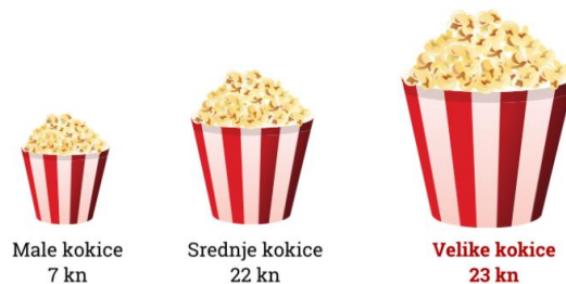
Slika 3: Efekt ružnog pačeta

Ideja ove strategije je da budu ponuđene tri verzije sličnog ili istog proizvoda. Npr. Idete u kino i možete izabrati između dvije veličine kokica. Male kokice koštaju 7 kn, a velike 23. Svi bi odabrali male jer su velike dosta skuplje, ali ako se u ponudi pojave srednje kokice za 22 kn? Većina će odabrati velike jer su samo kunu skuplje od srednjih. To znači da smo upravo pali u zamku ružnog pačeta.