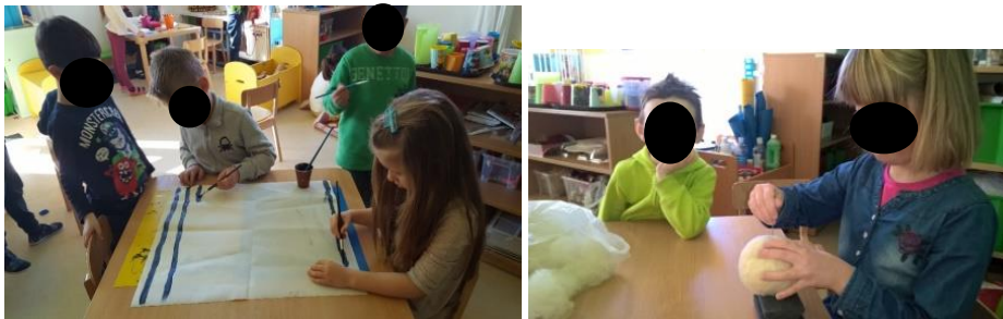
Prilog 3. Bojanje tkanina, kaširanje i filcanje kao jedan od koraka pri izradi lutaka