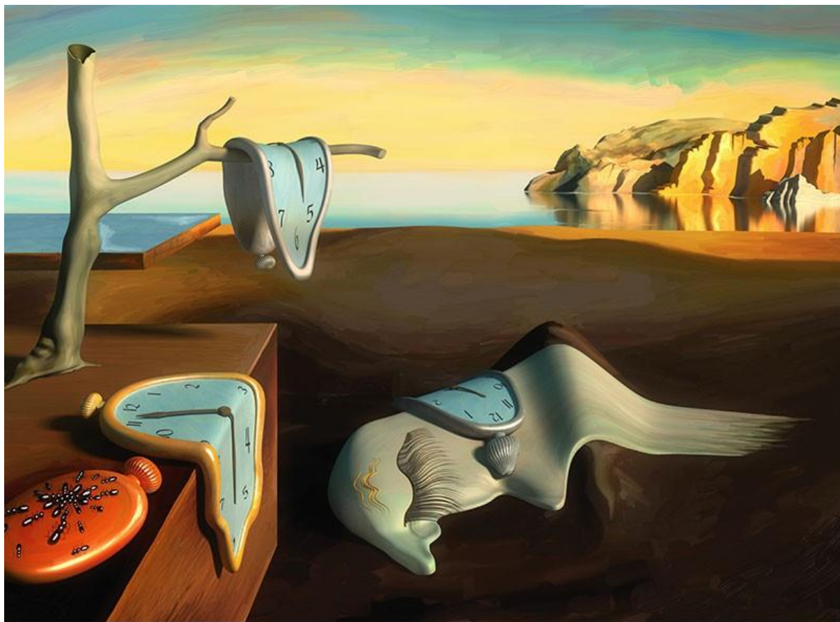
Slika 16. Postojanost pamćenje. Ulje na platnu, 1931.