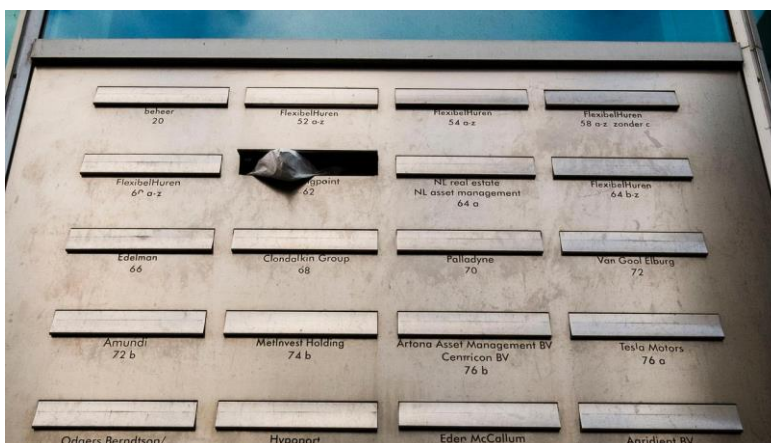
Slika 1. Kompanije s poštanskim sandučićem (engl. Letterbox companies )