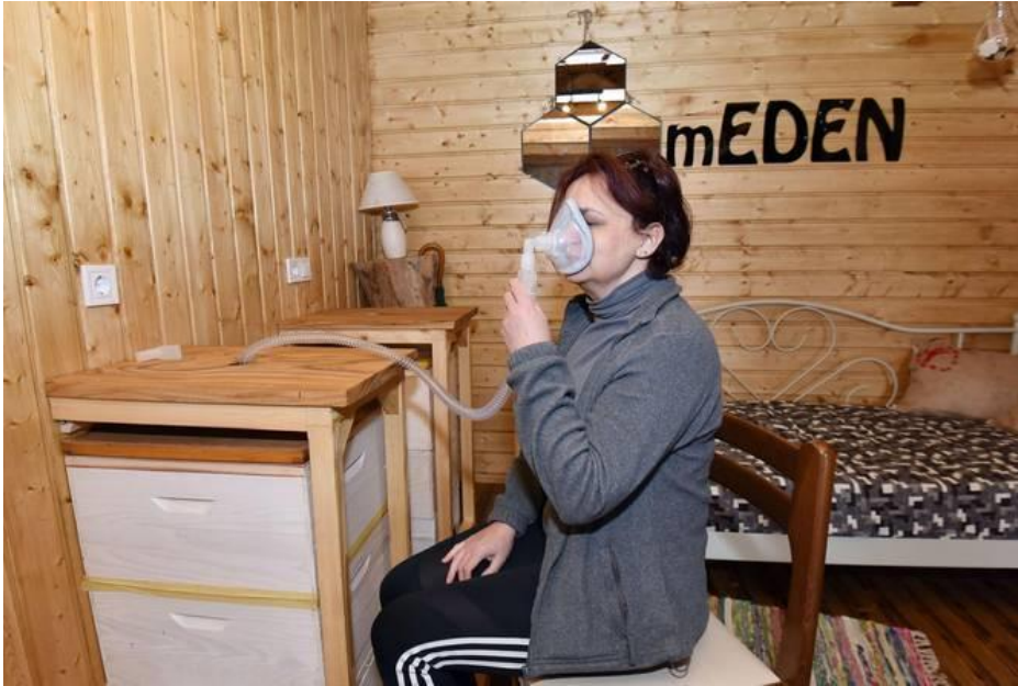
Slika 3. Liječenje pomoću apiterapije (inhalacija)