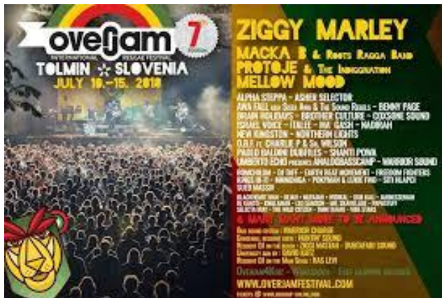
Fotografija 3. Supkulturni festival reggae glazbe u Tolminu