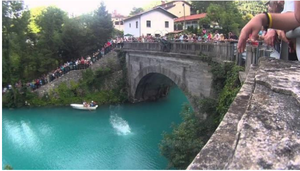
Fotografija 2. Tradicionalni festival Noč na jezeru koji se nalazi u Mostu na Soči