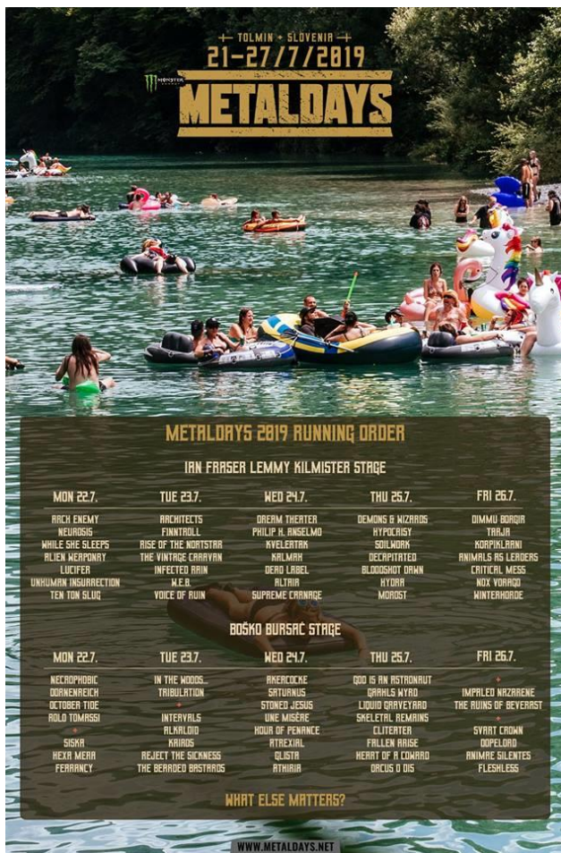
Fotografija 1. Slika prikazuje program festivala Metal Days u Tolminu za 2019. godinu