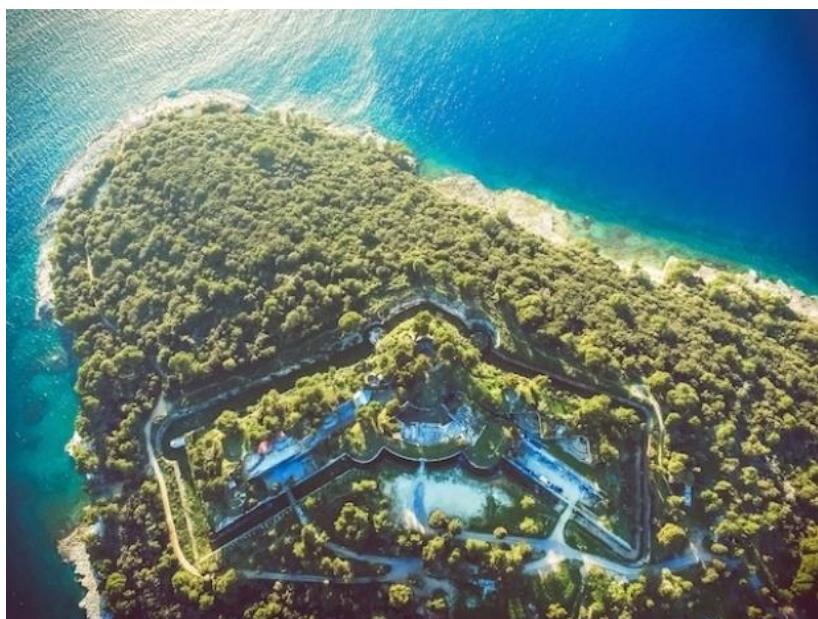
Fotografija 4. Tvrđava Punta Christo u Štinjanu

Tvrđava Punta Christo izgubila je svoju funkciju nakon Drugoga svjetskog rata, no dolaskom ambicioznih mladih ljudi iz udruge Punta Christo i Seasplash, tvrđava je godinama čišćena i uređena. Nakon što je tvrđava Punta Christo dobila novu funkciju, danas se u njoj najčešće održavaju popularno glazbeni festivali, koncerti, izložbe, programi za djecu i mlade, predstave, radionice i brojni performansi. Tvrđava Punta Christo postaje poznata i široj javnosti upravo zbog pojave Seasplash festivala, gdje su se održavala prva dva izdanja 2003. i 2004. godine. Također, Outlook festival bio je prekretnica za posjetitelje izvan naših granica. Posjetitelji Outlook festivala dolazili su iz Velike Britanije, Skandinavije, Australije, Novog Zelanda i SAD-a. Za Outlook festival možemo reći da je najveći europski festival Bass glazbe. Klupski prostor u kojemu se održavaju razni festivali u razdoblju od kraja svibnja do kraja rujna naziva se Seasplash Summer Club ( https://www.fortpuntachristo.net/hr/o-tvrđavi , 15.06.2020.).