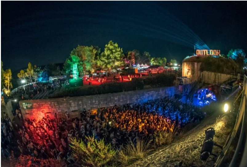
Fotografija 5. Outlook festival 2018. godine

nalaze tri dvorišta iz kojih je moguće ući u podzemne prostorije ove fascinantne građevine.