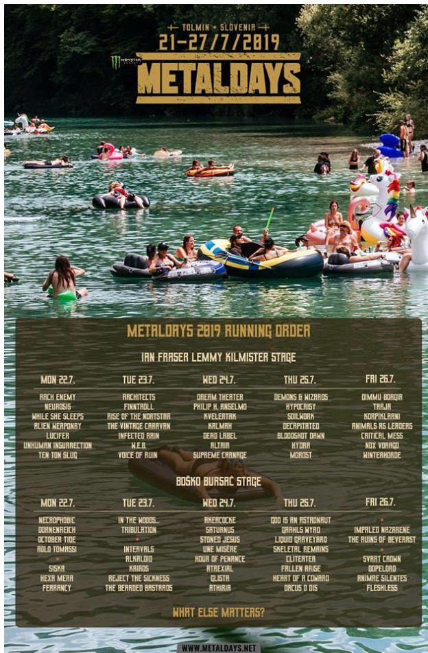
Fotografija 1. Slika prikazuje program festivala Metal Days u Tolminu za 2019. godinu