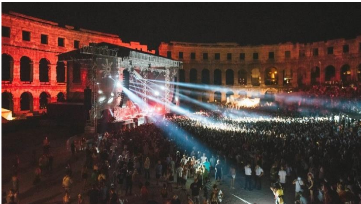
Fotografija 6. Otvorenje Outlook festivala u pulskoj Areni 2019. godine

kulturna baština kao što je Amfiteatar, zatim napuštena tvrđava u blizini plaže i mora te sunčano vrijeme. Sadašnji organizator Noah Ball odlučio je 2008. godine ideju provesti u djelo te je predložio održavanje festivala na lokaciji Štinjan (Fort Punta Christo) organizatorima Scratchleyu i Barnettu. S obzirom na da je publika koja je dolazila na festivale postala sve brojnija, organizatori su odlučili provesti još jedan festival koji se održava nekoliko dana prije samog Outlooka, a to je festival Dimensions. Ovaj festival, odnosno glazba na Dimensionsu, više je komercijalizirana, za razliku od Outlook festivala na kojemu nastupaju različiti žanrovi soundsistem glazbe kao što su: dub, hip hop, grime, dubstep, drum & bass i jungle. Početak koncerata održan je 2013. godine odnosno od 4. do 9. rujna u pulskoj Areni. Ono što je privuklo posjetitelje, upravo je otvorenje festivala u kulturno – povijesnom okružju rimskog amfiteatra. Za vrijeme trajanja festivala posjetitelji provode vrijeme na dnevnoj pozornici, na plaži, zabavama na brodovima te sudjelovanju u nizu radionica, dok se tijekom večeri imaju prilike pridružiti noćnim zabavama na nekim od glazbenih pozornica ( https://ukf.com/words/the-history-of-outlook-festival/21705 , 20.06..2020.).