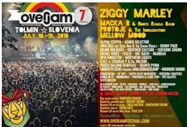
Fotografija 3. Supkulturni festival reggae glazbe u Tolminu Izvor: https://www.reggaeville.com/dates/festival-details/ , (06.06.2020.)