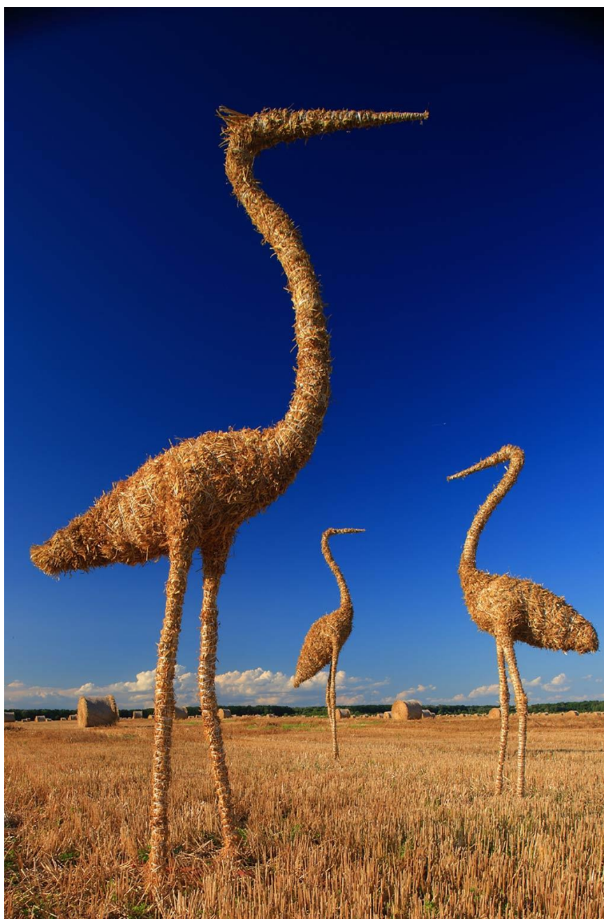
Slika 17. Skulpture izrađene od slame