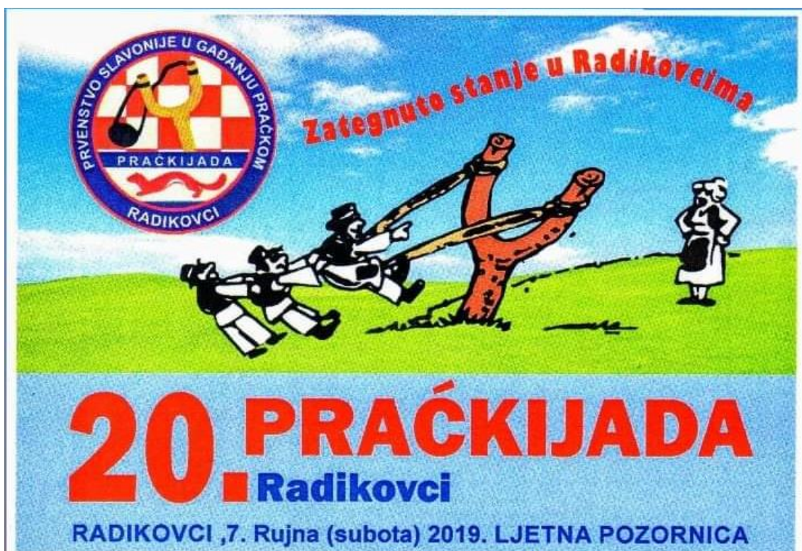
Slika 15. Promotivni plakat za „Praćkijadu“