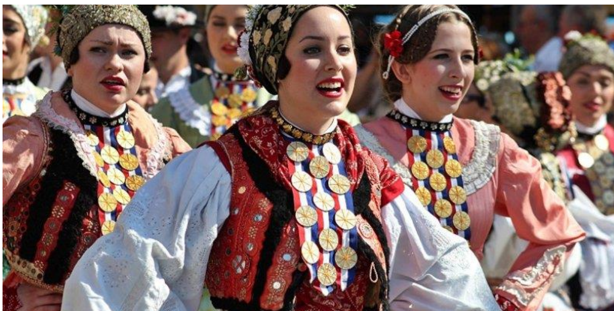
Slika 18. Smotra folklor „Đakovački vezovi“