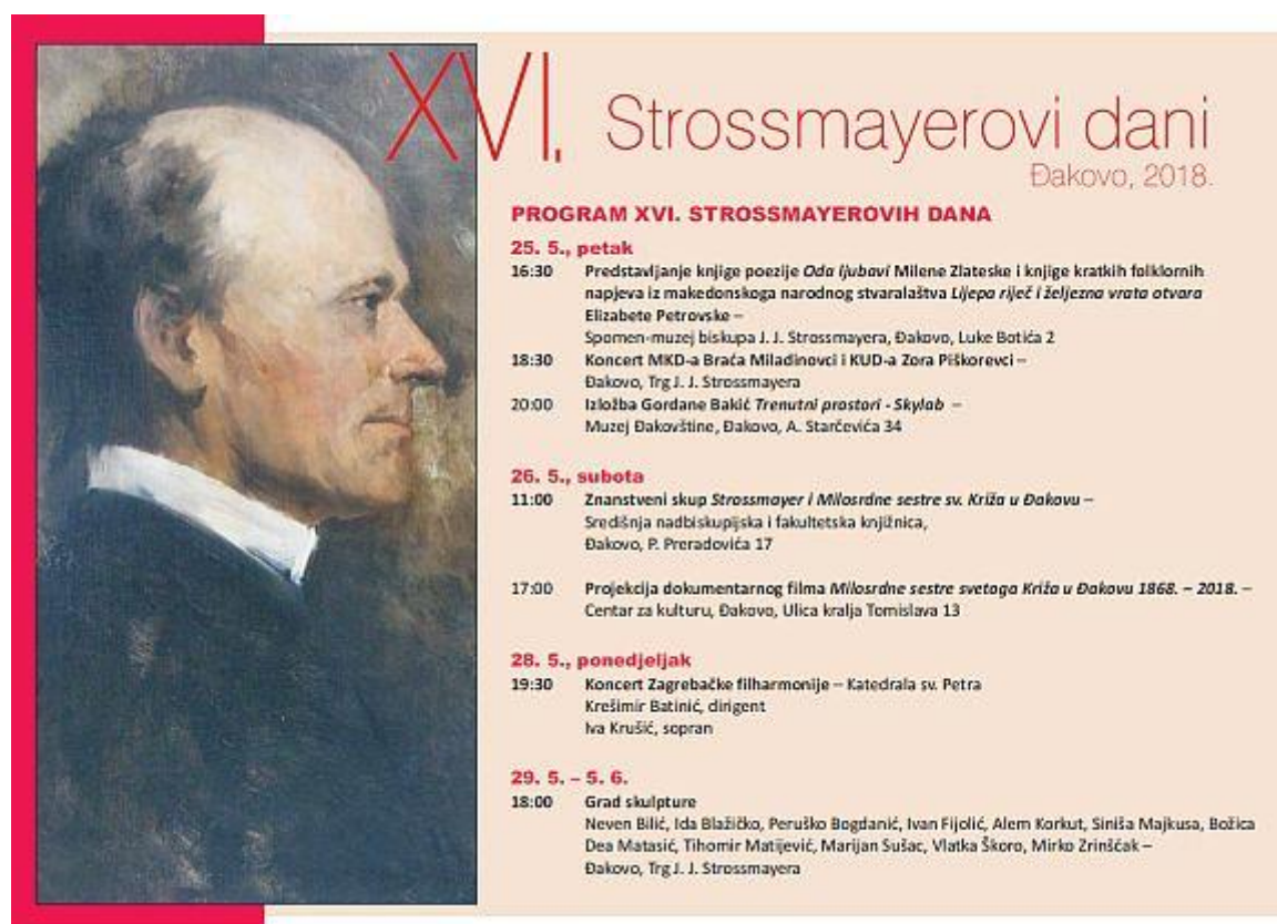
Slika 11. Program XVI. Strossmayerovih dana