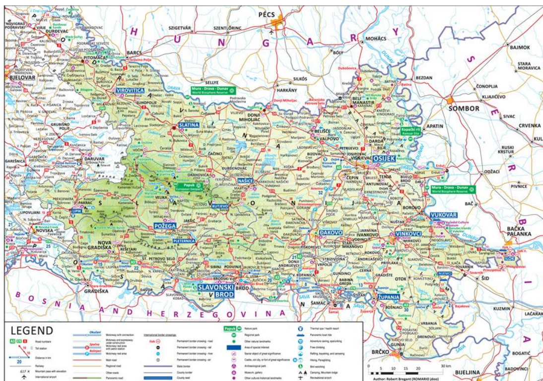
Slika 6. Turistička karta Slavonije