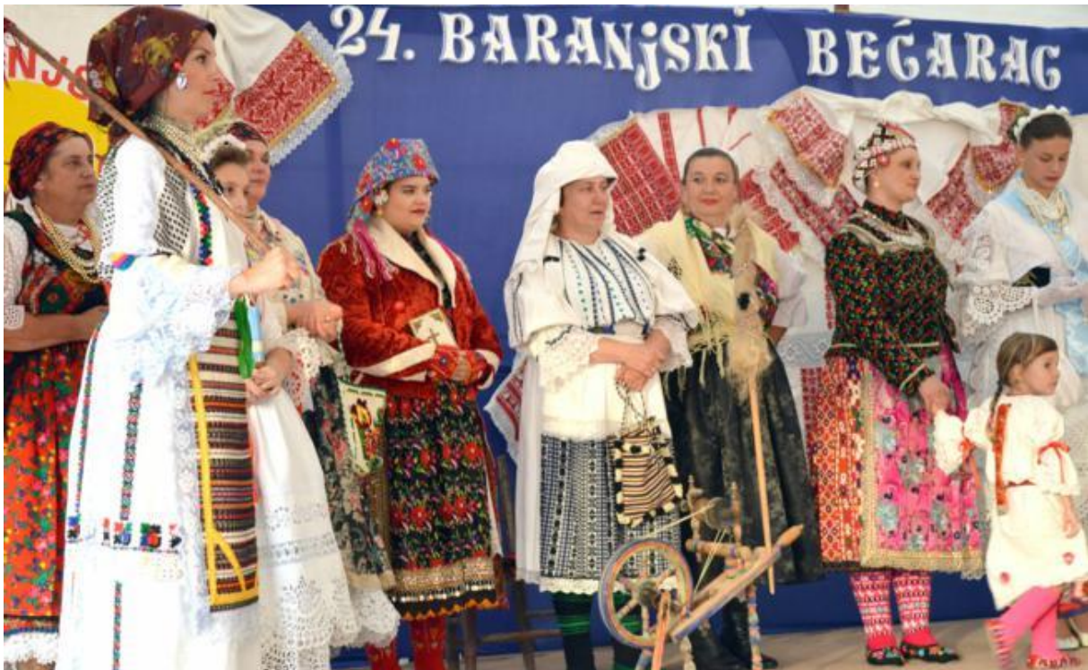
Slika 20. Manifestacija „Baranjski bećarac“