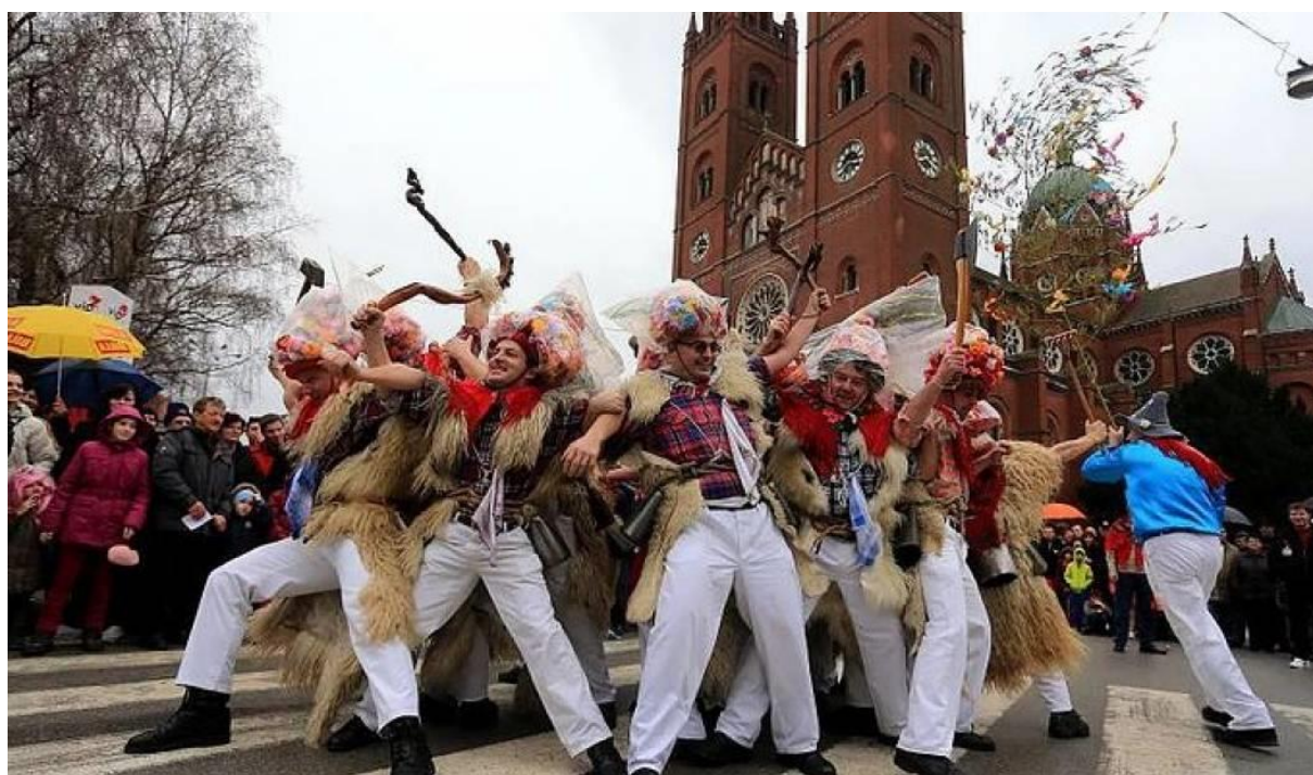
Slika 13. Đakovački bušari

Izvor: https://www.livecamcroatia.com/hr/event-site/25-dakovacki-busari , Pristupljeno:29.05.2020.