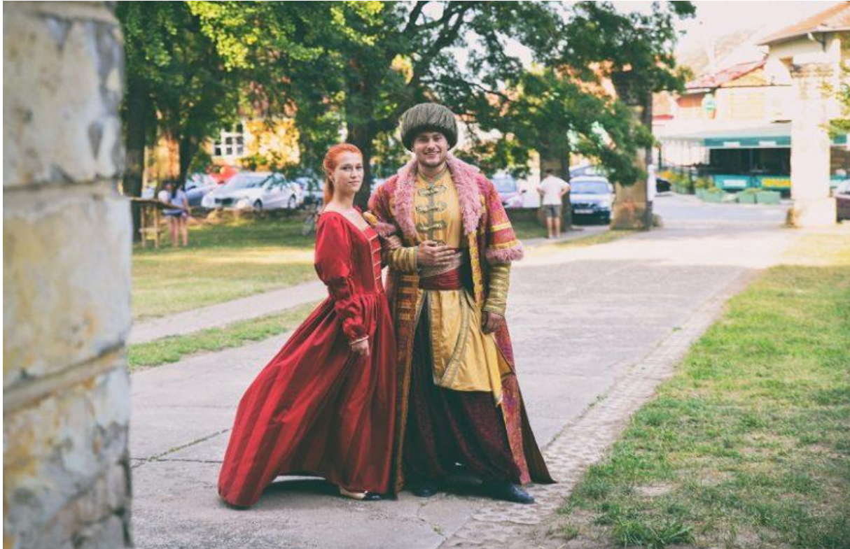
Slika 16. Festival Tarda – uprizorenje likova iz povijesti