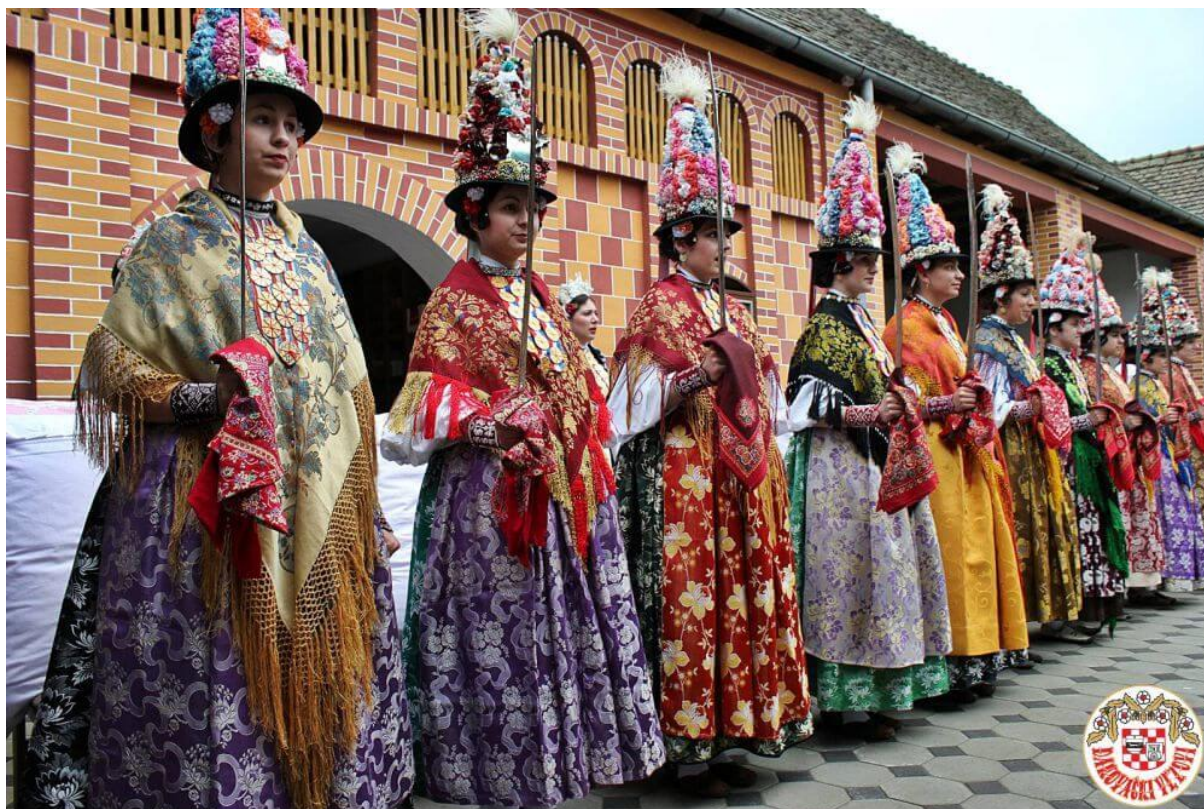
Slika 10. Ljelje iz Gorjana