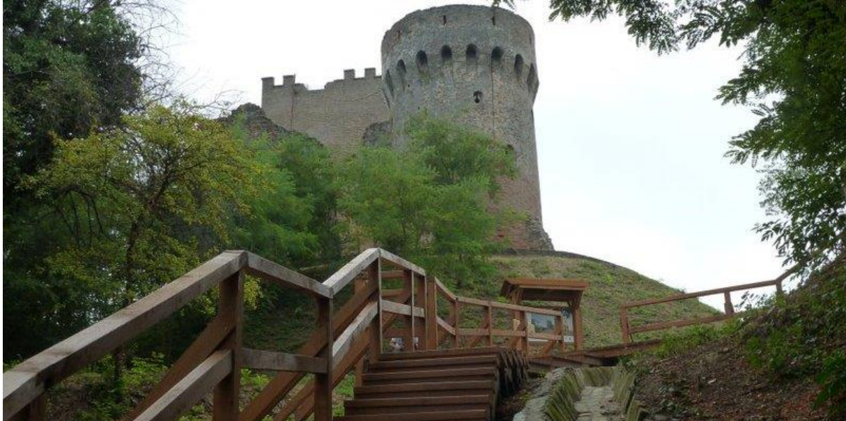
Slika 14. Srednjovjekovna kula u Erdutu