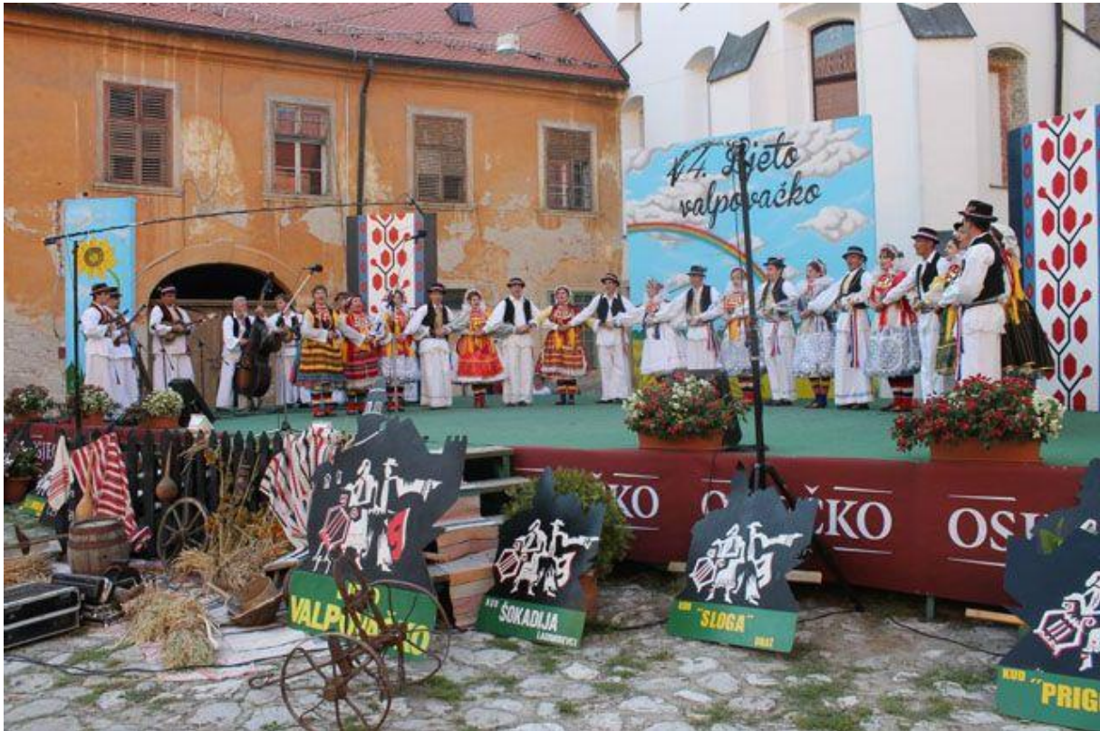
Slika 19. Nastup folklorne skupine na manifestaciji „Ljeto valpovačko“