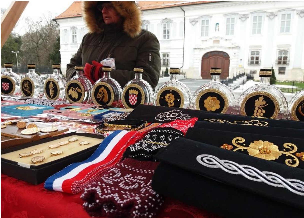
Slika 12. Uskrсни gastro fest - izlagači