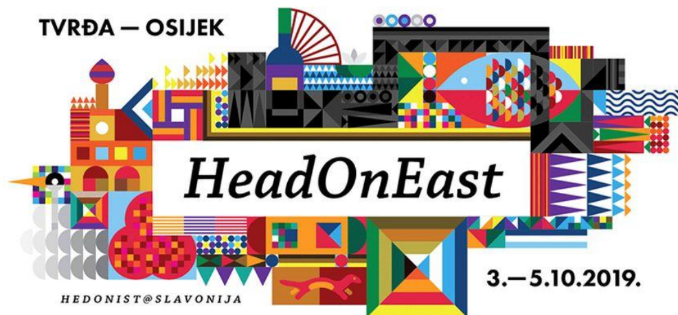
Slika 4. „HeadOnEast“ logo