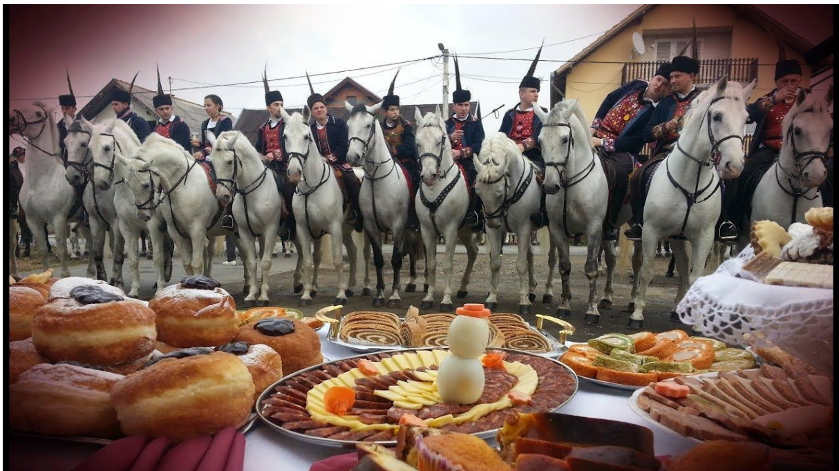
Slika 3. Pokladno jahanje u Ruščici – lokalna manifestacija

Izvor: https://www.youtube.com/watch?v=fsRWJePVDsQ , Pristupljeno: 6.05.2020.