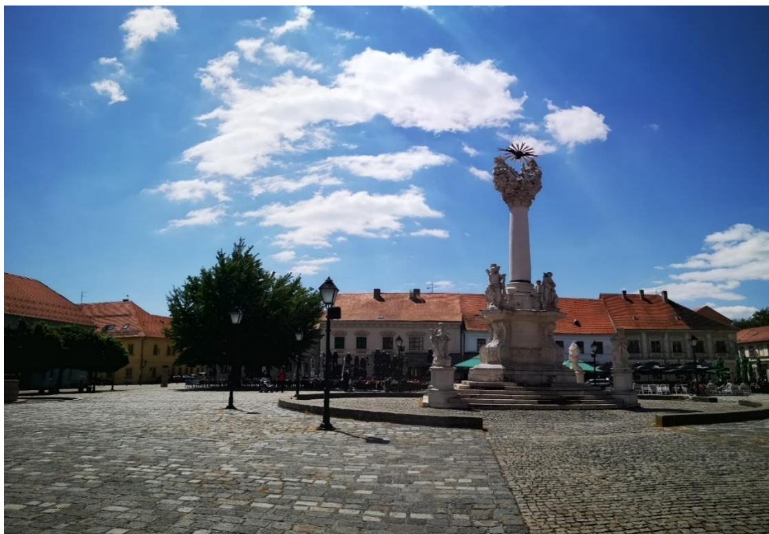
Slika 8. Trg Svetog Trojstva