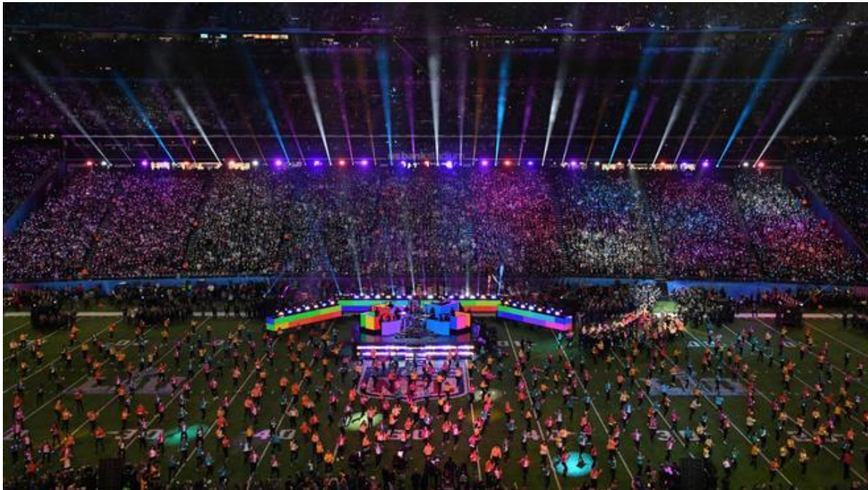
Slika 1. Super Bowl Halftime Show

Izvor: https://www.nbcsports.com/washington/redskins/2019-super-bowl-halftime-show-everything-you-need-know-about-maroon-5s-performance , Pristupljeno: 15.04.2020.