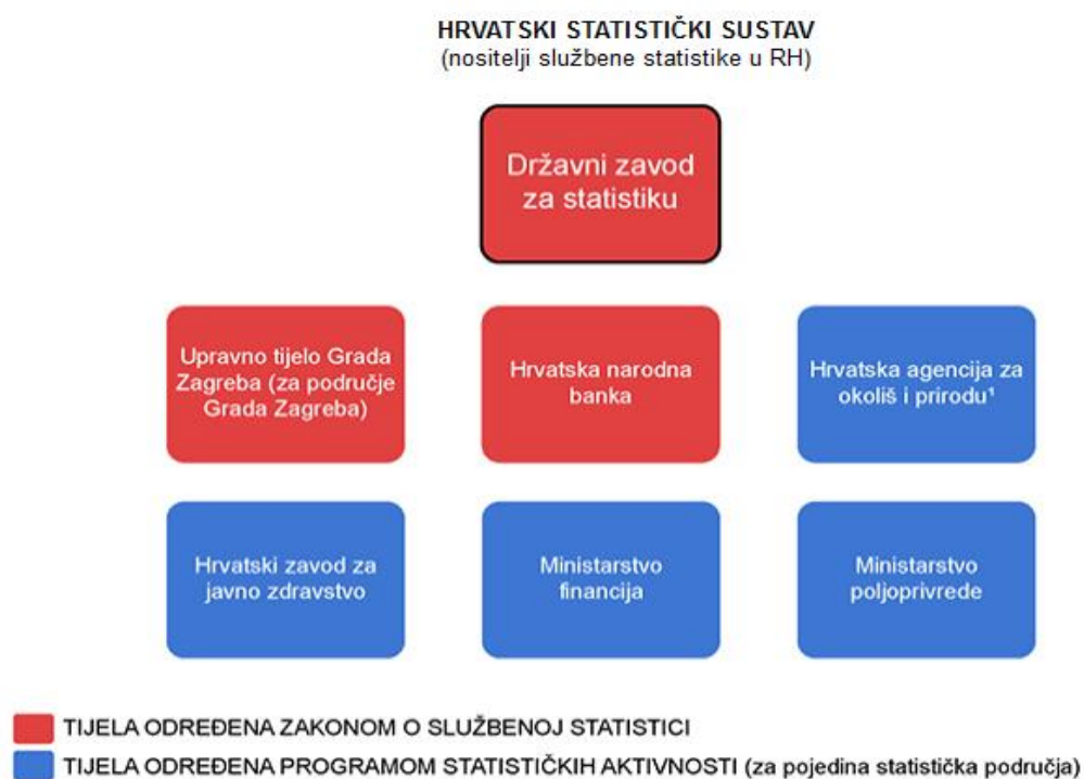
Slika 2. Hrvatski statistički sustav