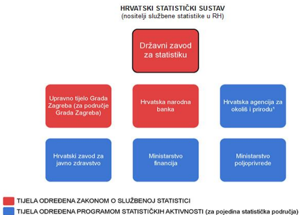
Slika 2. Hrvatski statistički sustav