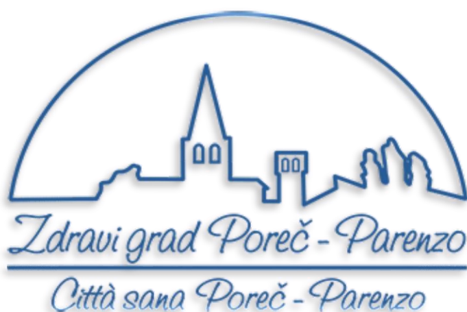
Slika 2. Logo "Zdravog grada Poreč"