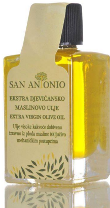
Slika 16 Bočica zapremnine 0.01L