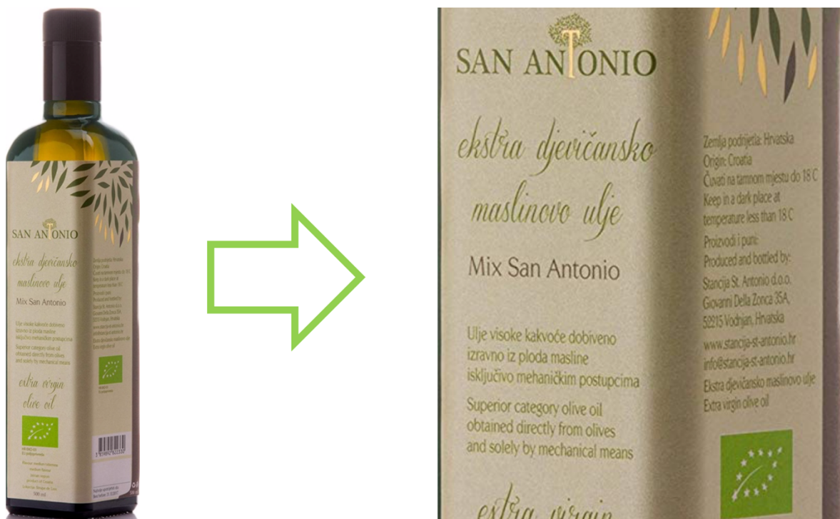
Slika 15 Staklena ambalaža višesortnog ulja