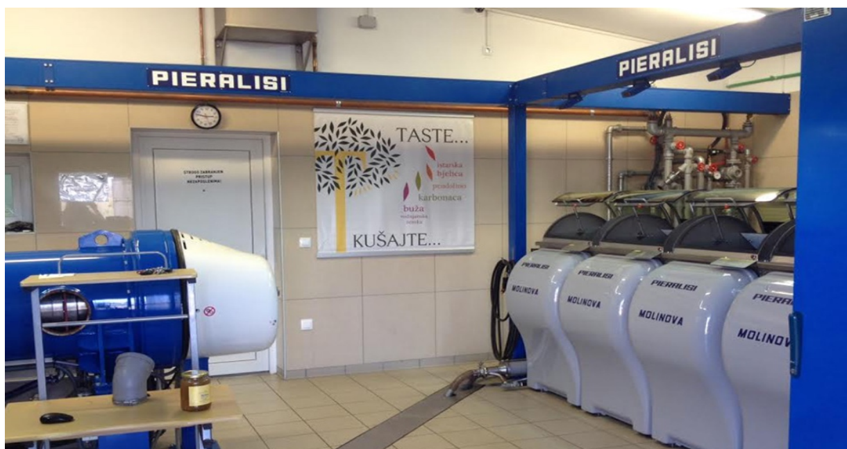
Slika 4 Uljara San Antonio