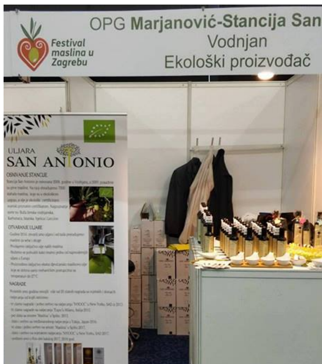
Slika 13 Degustacija na festivalu maslina u Zagrebu