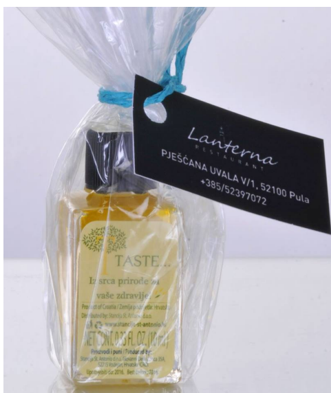
Slika 20 Poklon paketić za jedan restoran