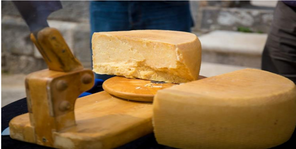
Slika 5. Sir