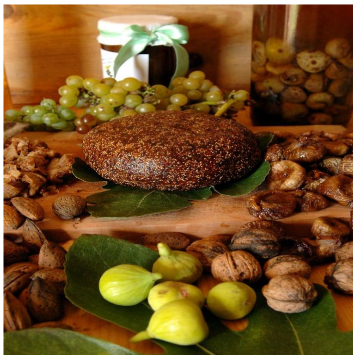
Slika 4. Fešta smokve i smokvenjaka