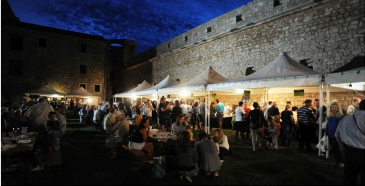
Slika 6. Festival sira u kaštelu Morosini - Grimani