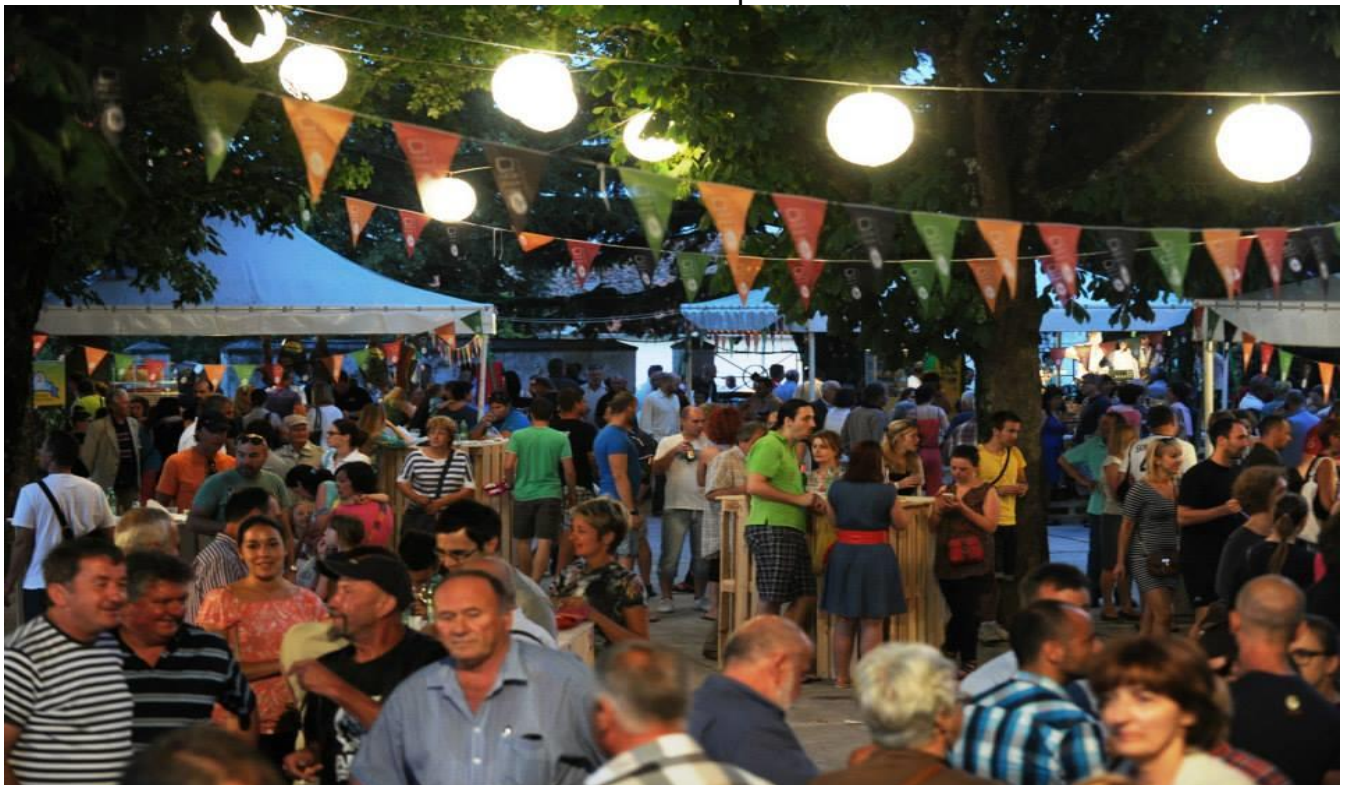
Slika 9. Istarski festival pašte