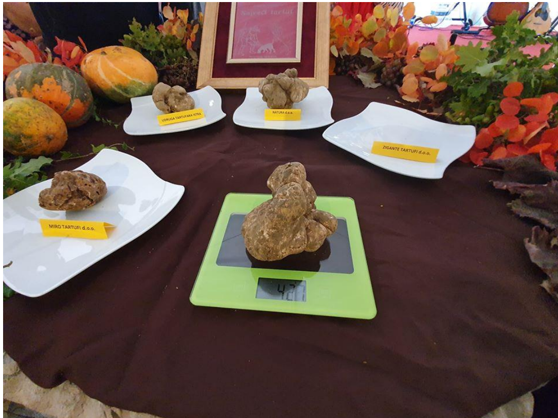
Slika 2. Nagrađeni tartuf

crvenom bojom kao da se sljubljuje s jesenskim bojama Istre. Uz teran, ravopravna je zvijezda festivala i tartuf, podzemno istarsko blago bez kojeg bi današnja gurmanska kuhinja bila nezamisliva (Ipress, 2019.a).