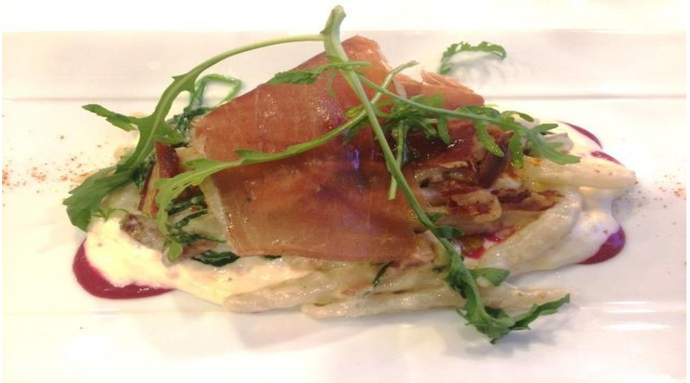
Slika 10. Žminjski pijat