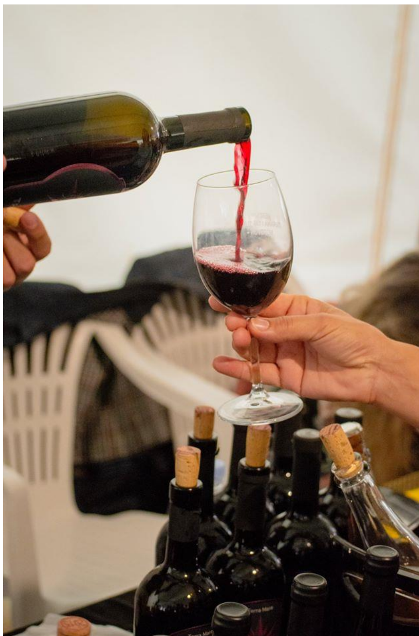
Slika 1. Teran