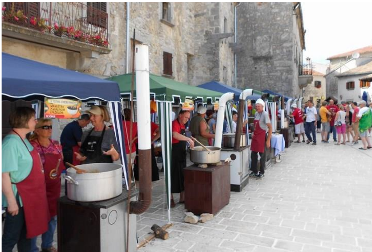
Slika 7. Meštri od maneštri