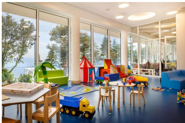
Slika 5. Igraonica za djecu manjeg uzrasta 2