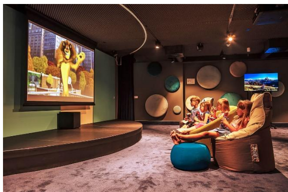
Slika 7. Dječji kino unutar hotela