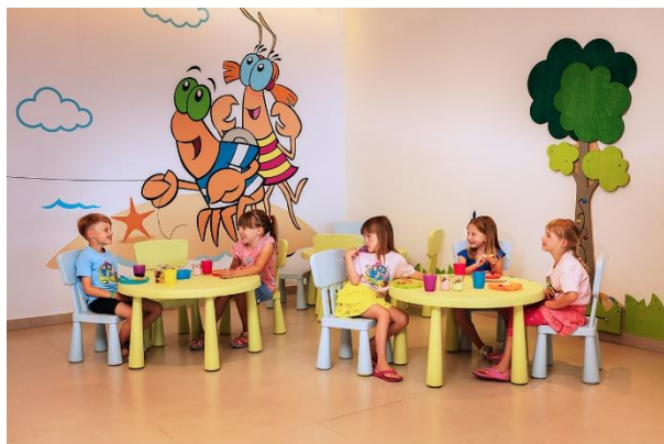
Slika 8. Dječja blagovaonica