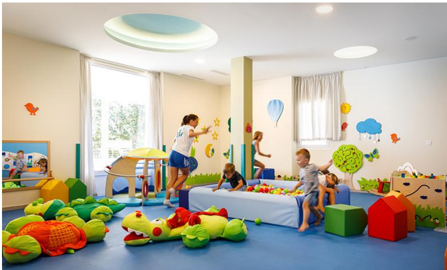
Slika 4. Igraonica za djecu manjeg uzrasta