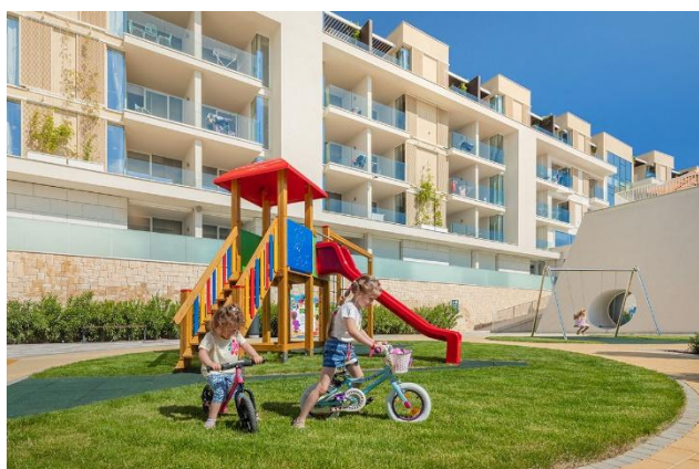
Slika 6. Dio igrališta ispred hotela