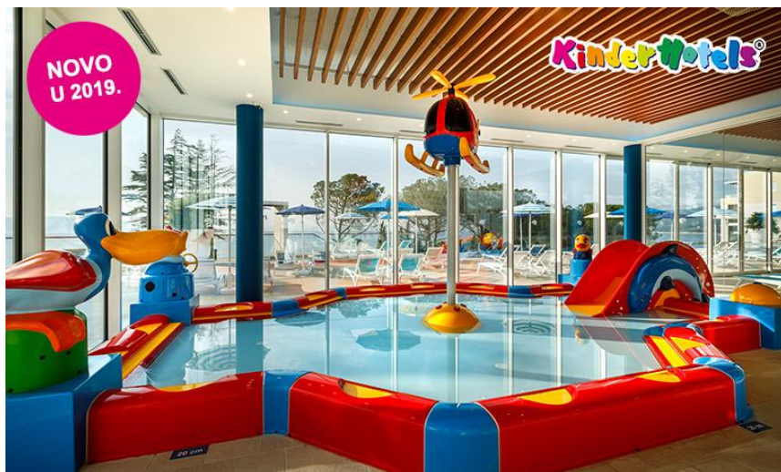
Slika 12. Unutarnji kompleks s bazenom za bebe