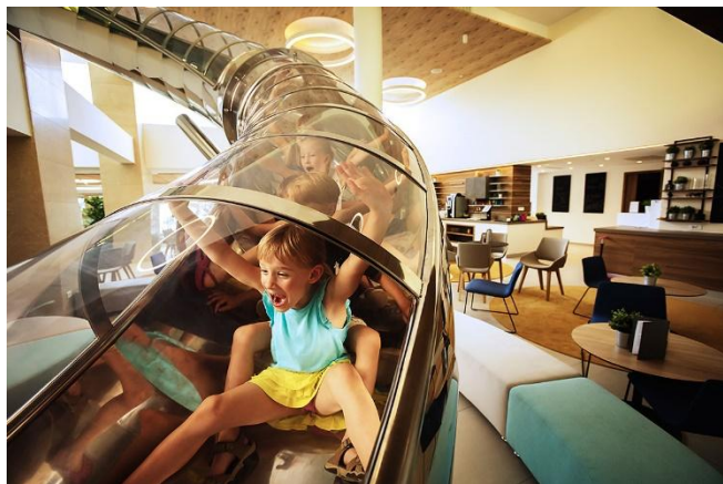
Slika 9. Tobogan za djecu unutar bara