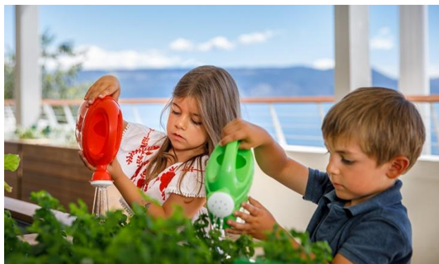
Slika 10. Dječji vrt