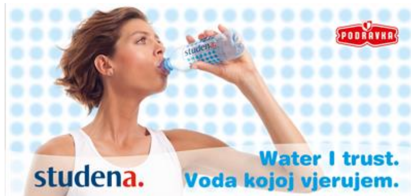
Slika 4. Blanka Vlašić u kampanji Studene