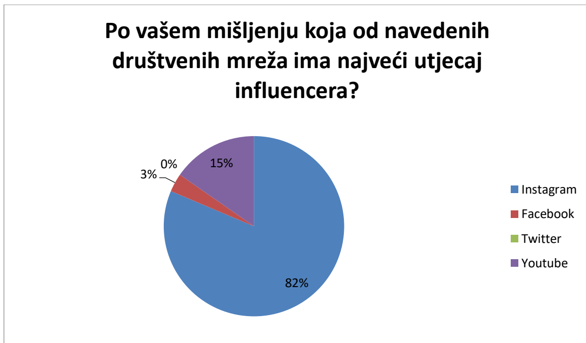
Grafikon 4. Društvena mreža s najvećim utjecajem influencera

Posljednja dva pitanja još se dotiču društvenih mreža i iz rezultata vidimo da Instagram "pobjeđuje" pri utjecaju influencera na mrežama, a 100% ispitanika smatra da su Instagramom zavladaile preporuke influencera.