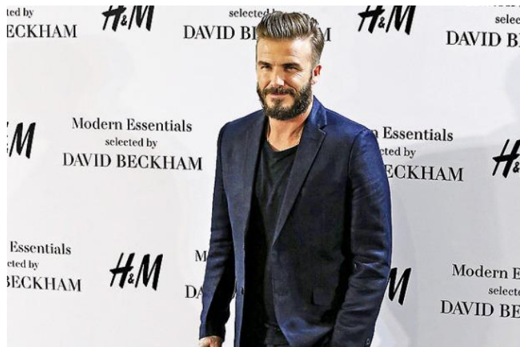
Slika 1. Modern Essentials selected by David Beckham