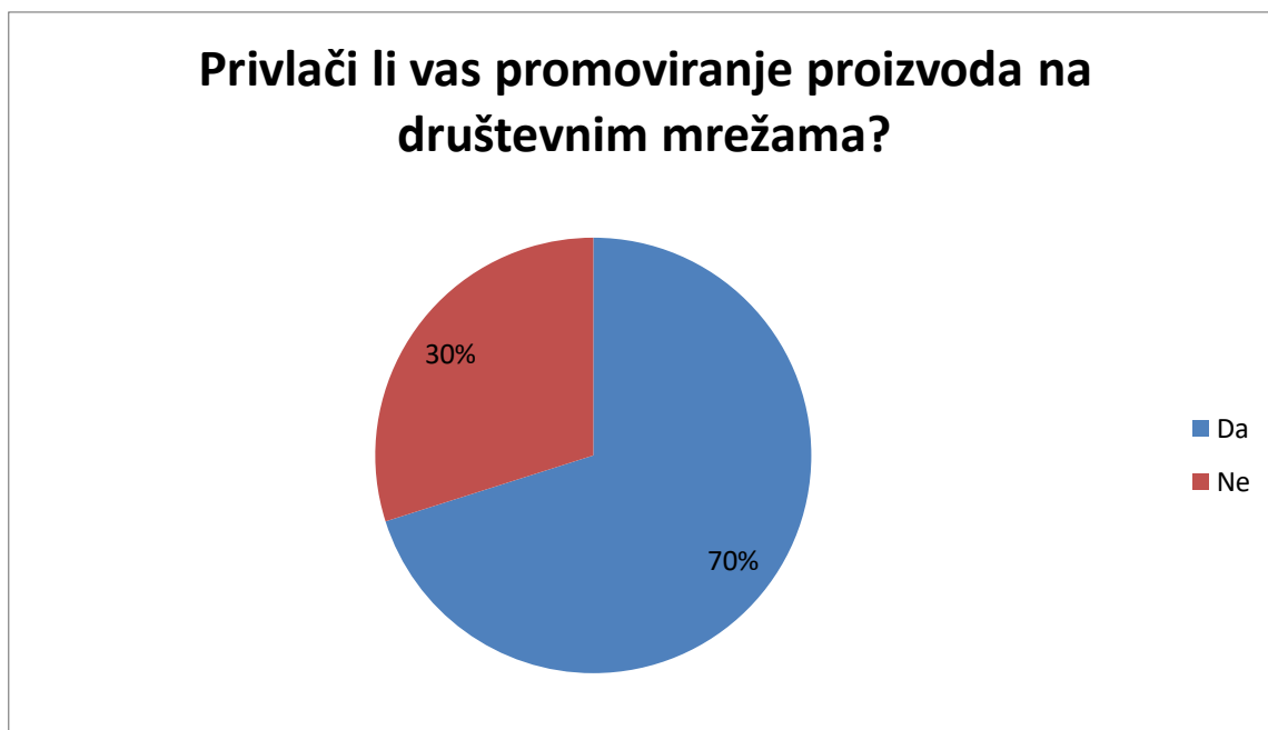
Grafikon 3. Promoviranje proizvoda na društvenim mrežama