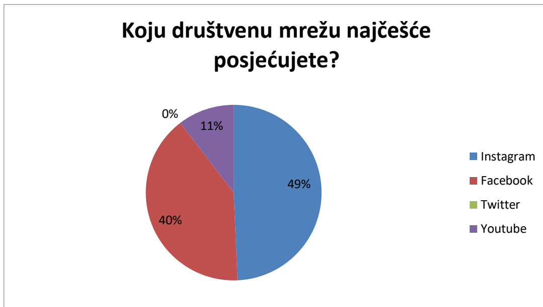
Grafikon 1. Posjećenost društvenih mreža