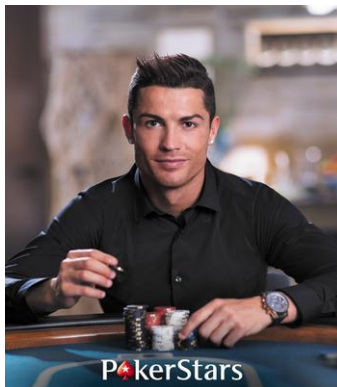
Slika 2. Cristiano Ronaldo join PokerStars