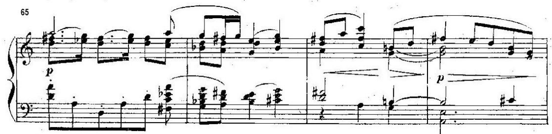
Primjer 12, Menuet (t. 65-68)