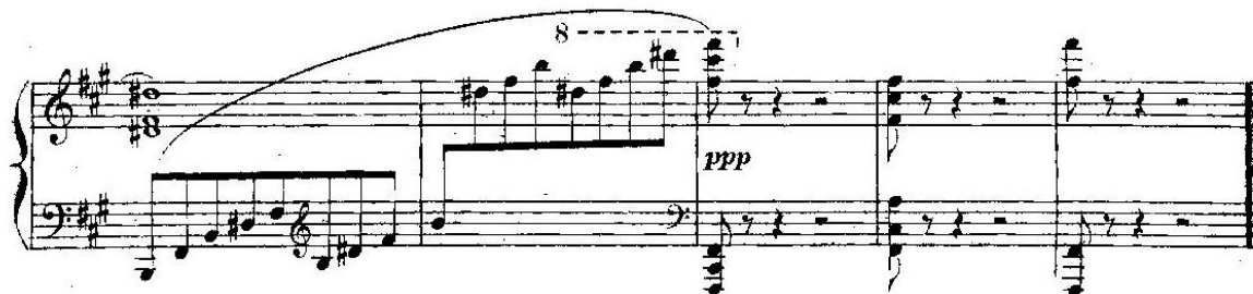
Primjer 19, Passepied (t. 152-156)

Često prisutnom modalnošću koja se proteže kroz suitu Bergamasque završava i ovaj stavak plagalnom kadencom dorskog tipa u kojoj je kvintakord IV. stupnja durski, a I. st. molski. U ovom slučaju radi se o akordima h-dis-fis i f-cis-fis (bez terce a) in fis. Izostanak terce u akordu još pojačava prizvuk modalnosti.