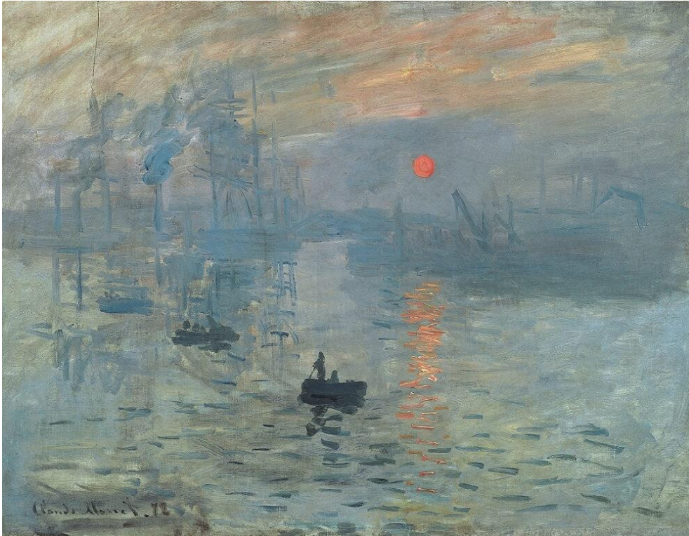
Slika 1, Claude Monet: Impresija , 1872., ulje na platnu, 48 x 63 cm, Musee Marmottan, Pariz 1

Na području poezije, simbolisti su, u koje spadaju Rimbaud, Mallarmé, Kahn, Maeterlinck te Paul Verlaine kao njihov predstavnik, također napravili iskorak iz tadašnjih nastojanja. Naime, oni su se suprotstavili pjesničkoj školi realista-parnasovaca koji su se zalagali za jasnoću izraza (Andreis, 1976). Simbolisti su, za razliku od parnasovaca, „nazirali teško pristupačne, maglovite, prikrivene uzročne veze te su nastojali podići koprenu s podsvjesnog i zahvatiti u duboka unutarnja zbivanja, kojima duh reagira na svaki utjecaj izvana; oni su iz svega materijalnog, uobličenog, izvlačili ideje, kao što su svakoj ideji davali oblik. “ (ibid., str. 118). Riječ je morala biti „lijepa“ odnosno posjedovati posebnu ljepotu, te je ta ljepota ovisila o muzikalnosti same riječi, ali i o njezinom odnosu prema stihu koji je postajao sve slobodniji. Upravo su radi njihove pobune protiv konvencionalnog izraza nazvani simbolistima. Samo imenovanje objekta je prema Mallarméu značilo potisnuti tri četvrtine zadovoljstva u pjesmi.