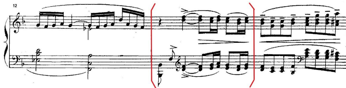
Primjer 20, Prelude (t. 11)

Naime, u prva tri stavka primjećuju se izmjenične terce kojima se Debussy „igra“ kroz različite karaktere pojedinog stavka. Tako u Preludiju u 11. taktu susrećemo postepeno uzlazno i silazno kretanje terci, kao što je to slučaj u Menuetu (5. takt) s tim da su ovdje druge ritamske vrijednosti (šesnaestinke i tridesetdruginke). Zatim u Clair de lune također susrećemo postepeno izmjenjivanje terci u prva tri takta.