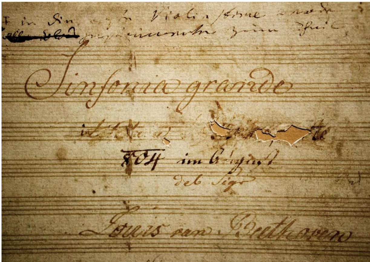
Slika 3. Rukopis Ludwiga van Beethovena