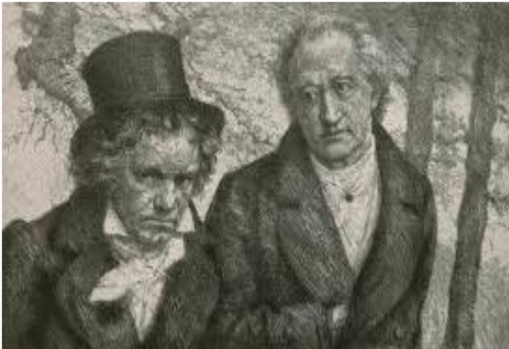
Slika 2. Ludwing van Beethoven i književnik Johann Wolfgang von Goethe

Na Beethovena je znatno utjecalo prijateljstvo s književnikom Goetheom čija je mnoga književna ostvarenja i uglazbio. Naime, Beethoven je od mladosti obožavao tog književnika te je s njim rado provodio vrijeme. Beethoven je poznao francuski, talijanski i latinski jezik te je volio čitati djela grčkih mislilaca poput Platona, Homera, Sofokla, Aristotela, Euripida. Čitao je i Voltaireova i Rousseauova djela. U posljednjim mjesecima svog života razgovara sa Schindlerom o Ariostu, Euripidu i Shakespearu te mu tumači svoja vlastita ostvarenja. 14