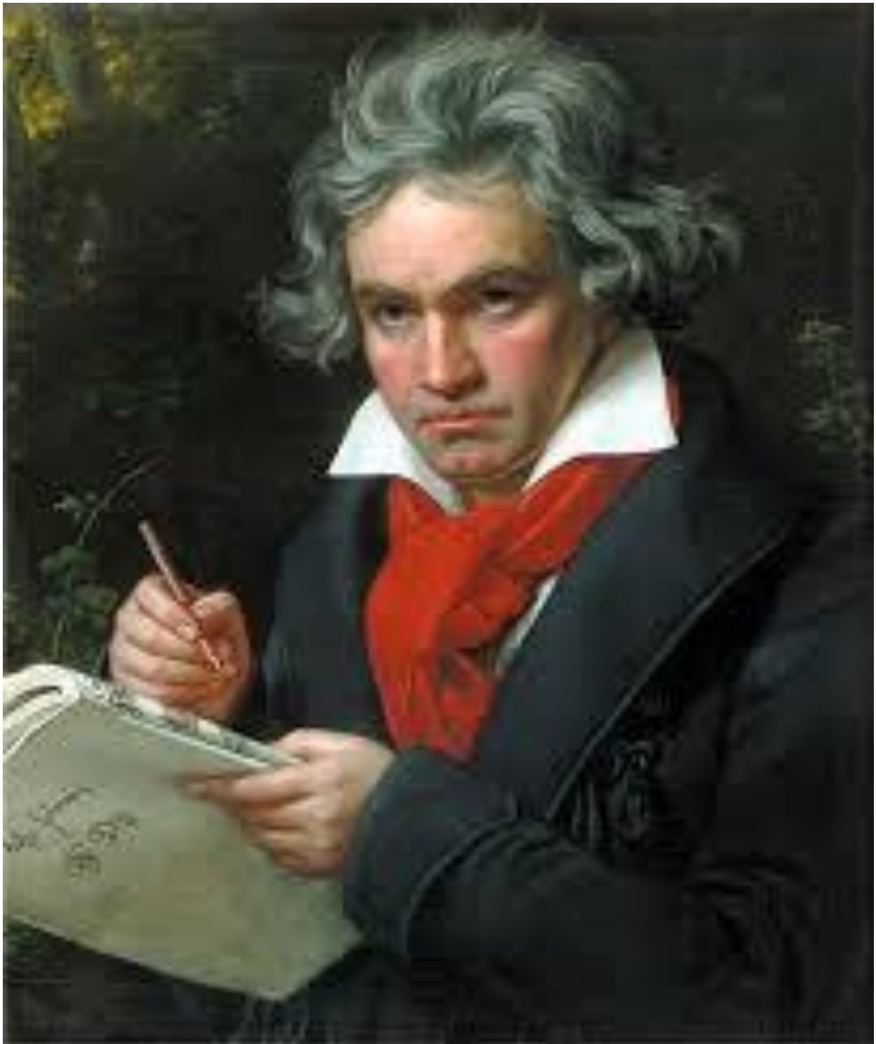
Slika 1. Ludwig van Beethoven