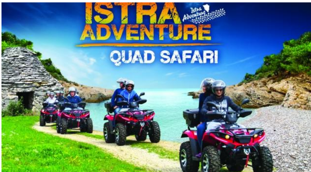
Slika 3. Quad safari