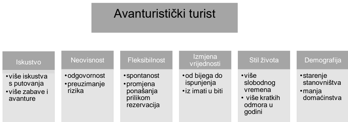
Slika 1. Karakteristike avanturističkih turista