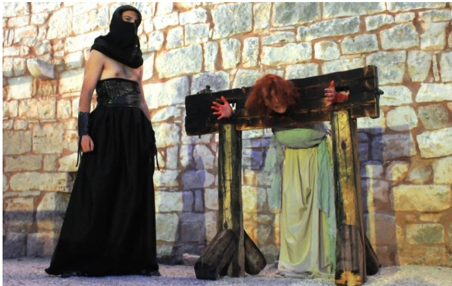
Slika 2. Vještica Mare u izvedbi Istre Inspirit (Istria Experience, https://www.istriaexperience.com/hr , preuzeto 05.07.2019.)

Osim kazališne priredbe doživljaj uključuje piće dobrodošlice, razgled kaštela Grimani – Morosini, prezentaciju starih zanata, degustaciju autohtonih proizvoda, glazbeni sastav Nešpula i pučku večeru i piće (Istra Inspirit, https://www.istrainspirit.hr/ , preuzeto 05.07.2019.). Na temelju legende o vještici Mare postoji i njezina kuća u Svetvinčentu. Ona posjetiteljima nudi virtualno putovanje i upoznavanje s legendom. Vještičinu priču priča upravo njezin duh koji posjetitelje vraća u prošlost. Stavlja posjetitelje u glavnu ulogu u bitci za obranu kaštela, kojeg će braniti virtualnim streličarstvom. Pomoću VR naočala posjetitelji će moći i sudjelovati u potrazi za izgubljenom opremom nepoznatog konjanika te će biti u mogućnosti vratiti se u prošlost.