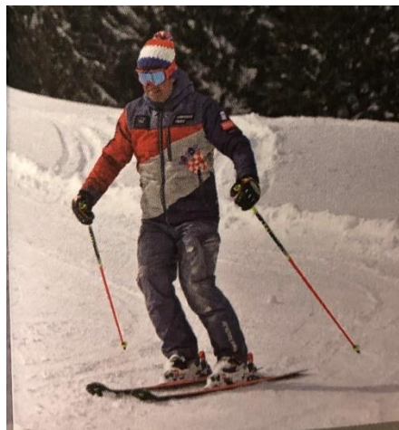
Četvrta faza plužno paralelnog zavoja- završavanje zavoja s paralelno postavljenim skijama