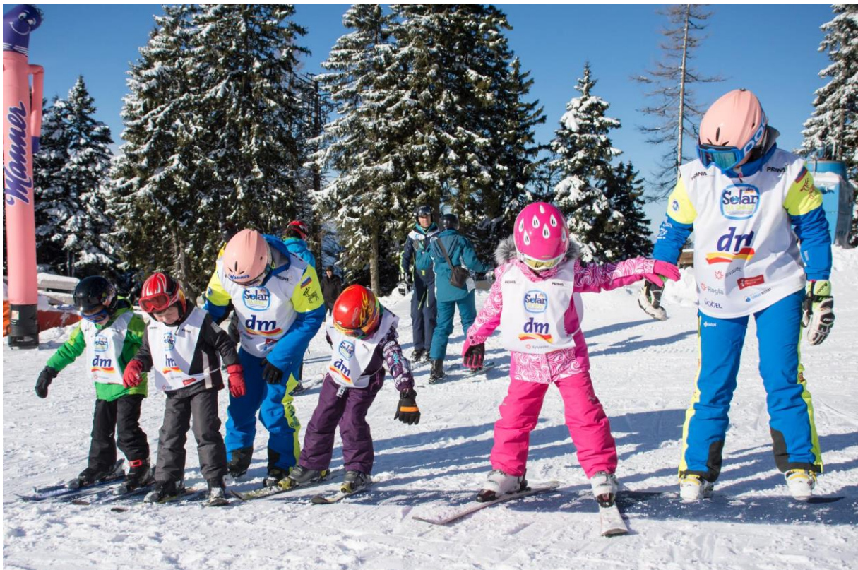
Slika 8. Bočno stepenasto penjanje

Postoje dva načina penjanja: bočno stepenasto penjanje i penjanje V-raskorakom. Pri bočnom stepenastom penjanju, kao što je prikazano na slici 7., skijaš skije treba postaviti okomito na padnu liniju. Skijaš koristi gornje rubnike skija i bočnim koracima postupno svladava uspon tako da se prvo težina tijela prenese na donju skiju, a gornjom se skijom zakorači bočno prema gore te se zatim težina prenese na gornju skiju, a donja skija se priključi gornjoj (HZUTS, 2007).