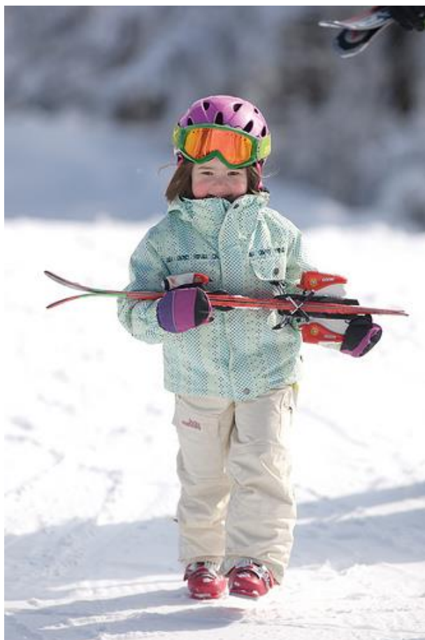
Slika 3. Nošenje skija u predručenju