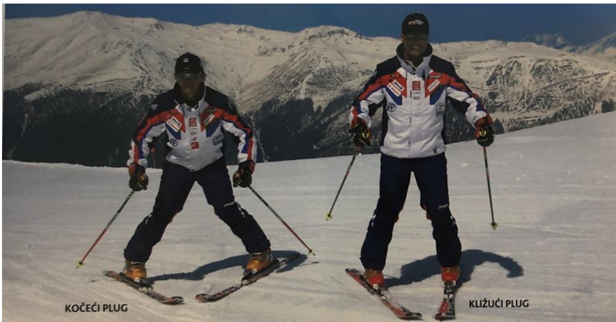
Slika 14. Kočeci i kližući plug

razmaku repova skija, razlikujemo kližući i kočeci plug. Kao što mu samo ime govori, u kližućem plugu skijaš klizi te su repovi skija manje udaljeni nego što je to kod kočecćeg pluga. Kližućim plugom skijaš kontrolira brzinu kretanja te se pomoću njega spušta niz blage padine, a kočeci plug koristi u trenutku kada se odluči zaustaviti (HZUTS, 2007).