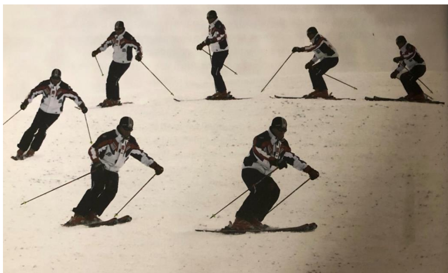
Slika 25. Napredni paralelni zavoj

Napredni paralelni zavoj od brijega je onaj način skijanja koji najčešće vidimo kada promatramo skijaše na stazama. Kod djece ovaj element trebamo uvesti spontano te djeca, često postizanjem veće brzine, skije nesvjesno postavljaju u paralelni položaj (HZUTS, 2017).