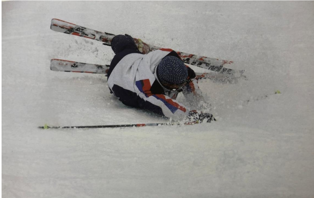
Slika 10. Padanje

Izvor: HZUTS (2009.) Alpsko skijanje. Zagreb: Znanje