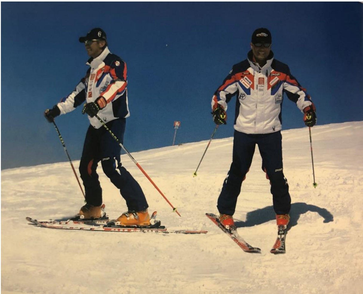
Slika 13. Plužni stav

Skije su u plužnom stavu postavljene u obliku slova A te se dijete oslanja na unutarnje rubnike skija. Ostali elementi plužnog stava podudaraju se s onim što je skijaš usvojio kod osnovnog stava: „Težina je ravnomjerno raspoređena na obje skije; središte opterećenja skije je na sredini stopala; noge su povijene u koljenima i gležnjevima, a trup u kukovima i leđima, koljena su primaknuta jedno drugome; ramena su pomaknuta prema naprijed na osnovi blago zaobljenih leđa; ruke su pomaknute prema naprijed i odmaknute u stranu; skijaški štapovi su usmjereni koso prema nazad i dolje s krplicama usmjerenim od tijela“ (HZUTS. 2007:16).