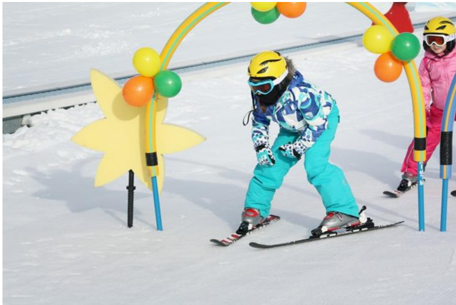
Slika 18. Izvođenje plužnih zavoja s rukama oslonjenim na koljena