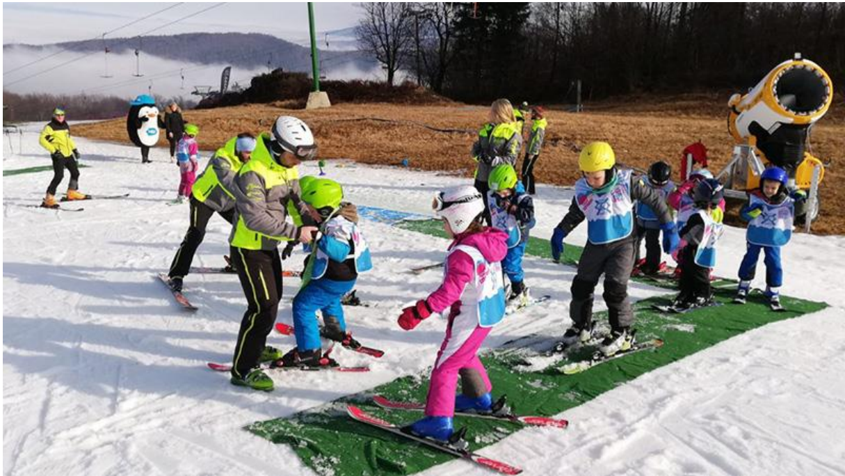
Slika 9. Uporaba tepiha kao pomoć pri penjanju

Kako bi se djeci olakšalo penjanje, savjetuje se postavljanje podloge kao što je tepih, na sam snijeg. Na taj se način smanjuje klizanje i mogućnost pada.