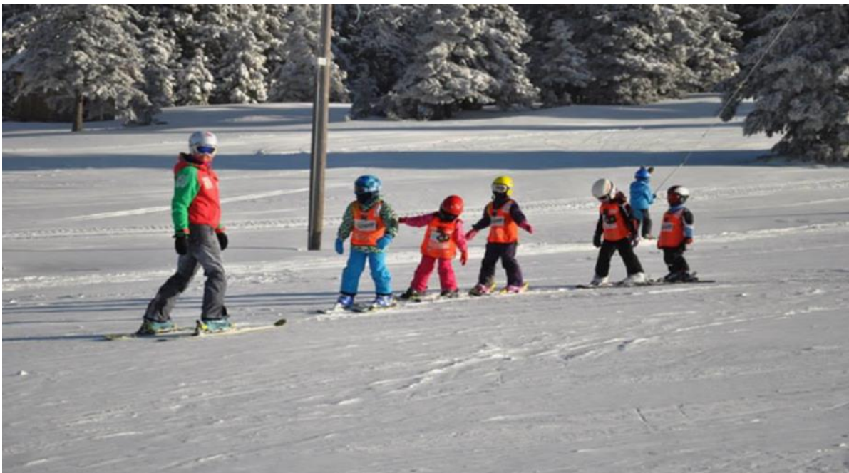
Slika 26. Skijanje učitelja unatrag uz nadzor nad djecom

Individualni pristup unutar grupe može se postići na dva načina. Prvi način je dinamičniji za samog učitelja i preporuča se ukoliko se radi na nižim temperaturama zraka. Na ovaj način učitelj kroz skijanje konstantno rotira učenike kako bi na prvom mjestu imao novo dijete. Na taj način učitelj ima uvid u greške svakog djeteta te nakon zaustavljanja može svakom djetetu dati vježbu kojom će mu olakšati i pomoći mu u ispravljanju greške (Pišot, Videmšek, 2004).