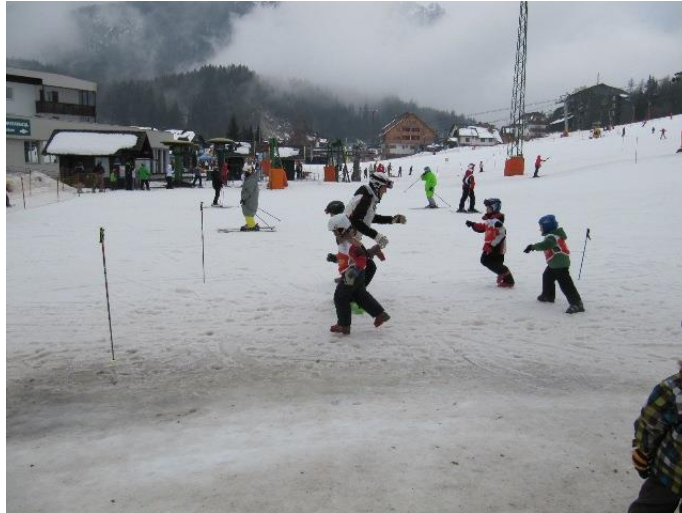
Slika 4. Grupno pretrčavanje od točke A do točke B

Najčešće metodičke vježbe koje se koristi za zagrijavanje djece su: igra lovice u skijaškim cipelama, grupno pretrčavanje od točke A do točke B, hodanje s jednom skijom u krug u smjeru i suprotno od smjera kazaljke na satu, igra „dan - noć“, igra „vrući krumpir“, tračanje oko čunjeva i sl.