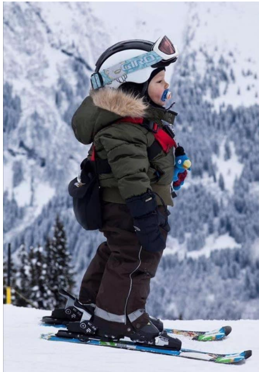
Slika 27. Prvi koraci na skijama dvogodišnjeg djeteta

Program rada djece u razdoblju od 2. do 3. godine najčešće se naziva vrtić na snijegu. U tom periodu djeca samostalno hodaju, vesele se provedenom vremenu s vršnjacima, sve su samostalnija, vrlo su radoznala i rado istražuju, odnosno usvajaju nove vještine. Budući da djeca u ovoj dobi pažnju zadržavaju kratko i usmjeravaju je na događaje i pojave koje su im zanimljive i potiču istraživanje, od učitelja se očekuje da bude zabavan, kreativan i maštovit. Koncentracija dvogodišnjaka i trogodišnjaka je vrlo kratka, no ukoliko su djeca zainteresirana, ona vrlo brzo usvajaju prve korake na snijegu (Starc, Čudina-Obranović, Pleša, Profaca i Letica, 2004).