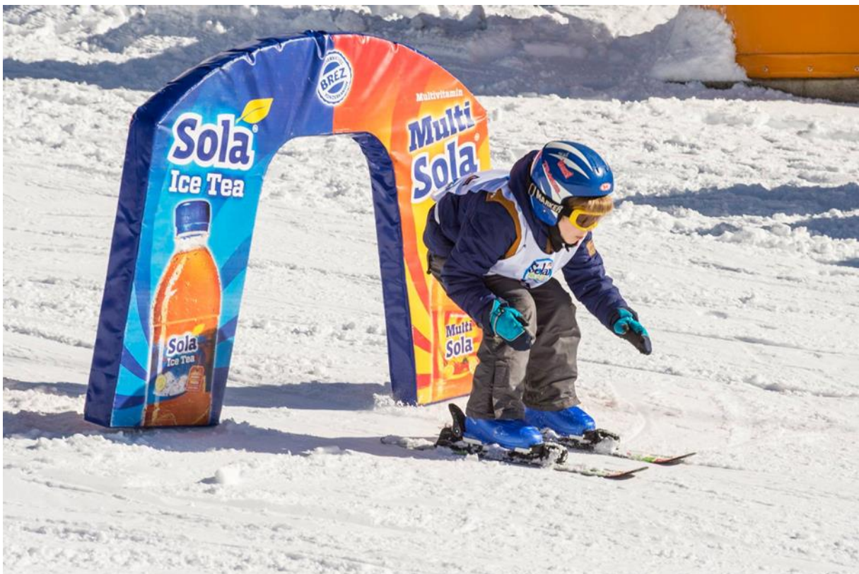
Slika 12. Spust ravno i prolaženje kroz vrata