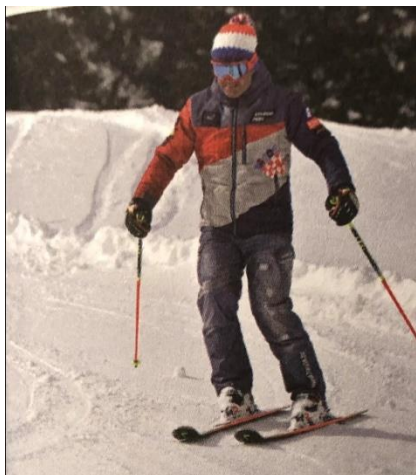
Treća faza plužno paralelnog zavoja- skije su u paralelnom položaju