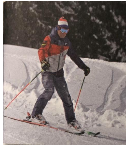
Druga faza plužno paralelnog zavoja- skije su i dalje u plužnom položaju te je dominantno naglašeno opterećenje na vanjskoj skiji