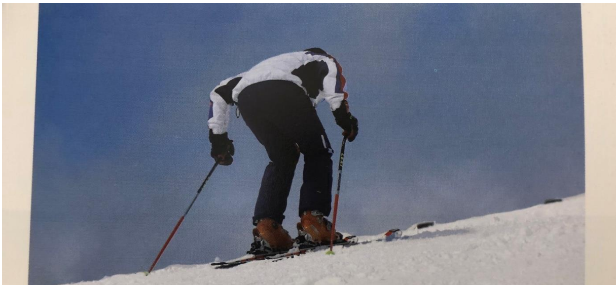
Slika 24. Završetak izvedbe zavoja k brijegu - obje varijante