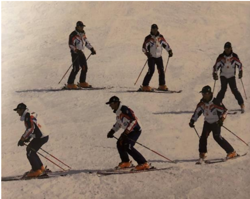
Slika 17. Plužni zavoj

uspostavlja ravnomjerno opterećenje na objema skijama. Novi zavoj započinje (postupnim) kružnim gibanjem nogu kojim usmjerava plužno postavljene skije u smjeru novog zavoja (HZUTS, 2007).