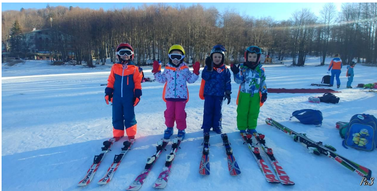
Slika 1. Djeca opremljena za prve skijaške korake

Na slici 1. prikazana je skijaška oprema za djecu. Osim skijaške jakne, skijaških hlača, rukavica, čarapa i podkape, osnovnu skijašku opremu čine: skijaške cipele, skije s vezovima, štapovi, kaciga i skijaške naočale.