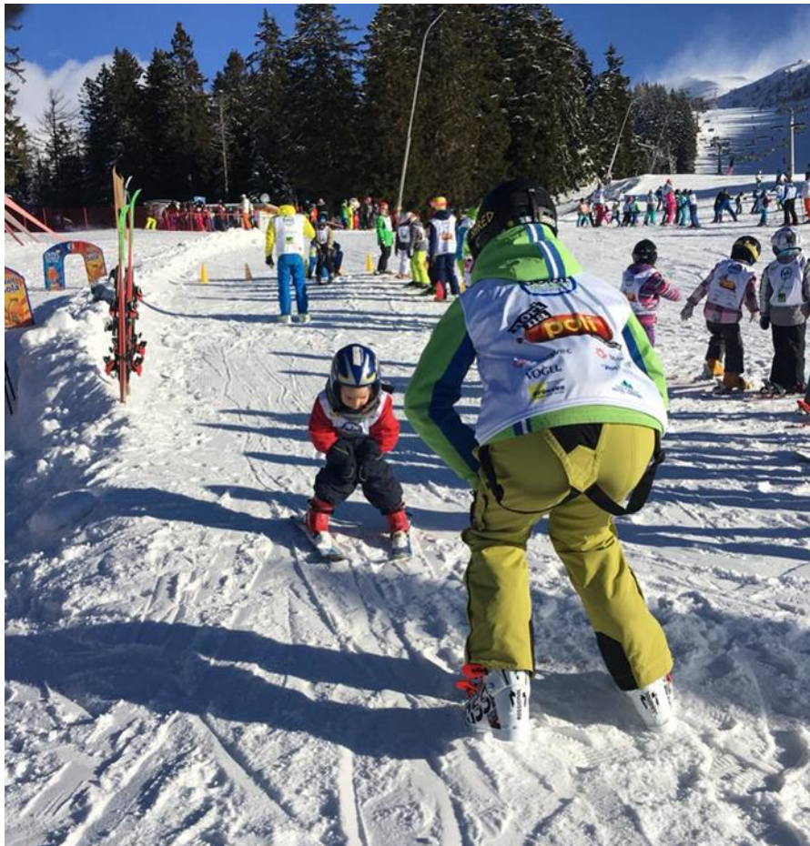
Slika 11. Spust ravno

Spust ravno započinje se izvoditi tako da su skije postavljene okomito na padnu liniju. Djeca spust ravno najčešće započinju iz pluznog stava, koji će biti opisan u sljedećem poglavlju. Za početak je potrebno pokazati djeci postavljanje tijela u osnovni skijaški položaj tako da blago čučnu te postavite ruke na koljena. Skije su im postavljene u oblik slova A koji ujedno služi kao kočnica, te im sprječava kretanje (HZUTS, 2007).