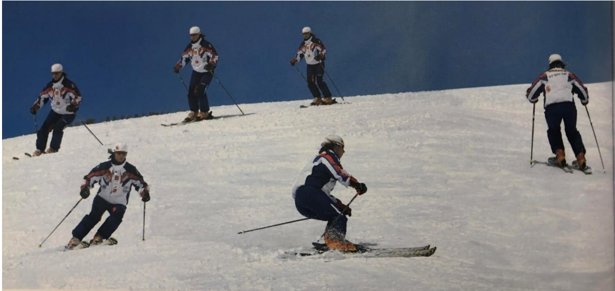
Slika 23. Izvedba zavoja k brijegu - druga varijanta izvedbe (vođenje skija uz bočna gibanja)