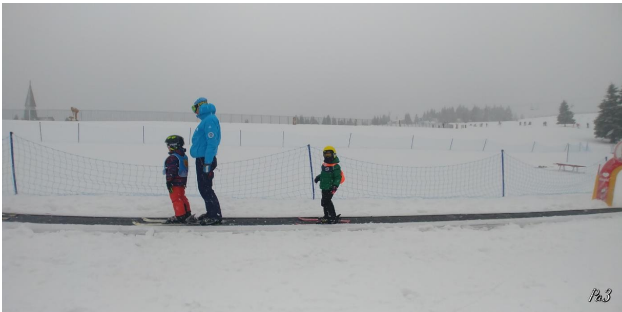
Slika 15. Uporaba pokretne trake

Čim djeca usvoje zaustavljanje na skijama, vrijeme je da počnu koristiti skijaške žičare. Uporaba skijaških žičara uvelike olakšava skijanje jer dijete ne troši energiju na penjanje, no svaki učitelj treba imati na umu da je korištenje žičara veliki korak za dijete. Danas su gotovo sva skijališta infrastrukturom prilagođena najmlađima te je prva vrsta žičare s kojom se susreću pokretna traka. Učitelj treba odvesti djecu na dno trake te im na ravnom terenu objasniti kako stati na traku, zadržati ravnotežni položaj tijekom vožnje, naglasiti da održavaju razmak te kako i što učiniti pri silaženju (HZUTS, 2009).