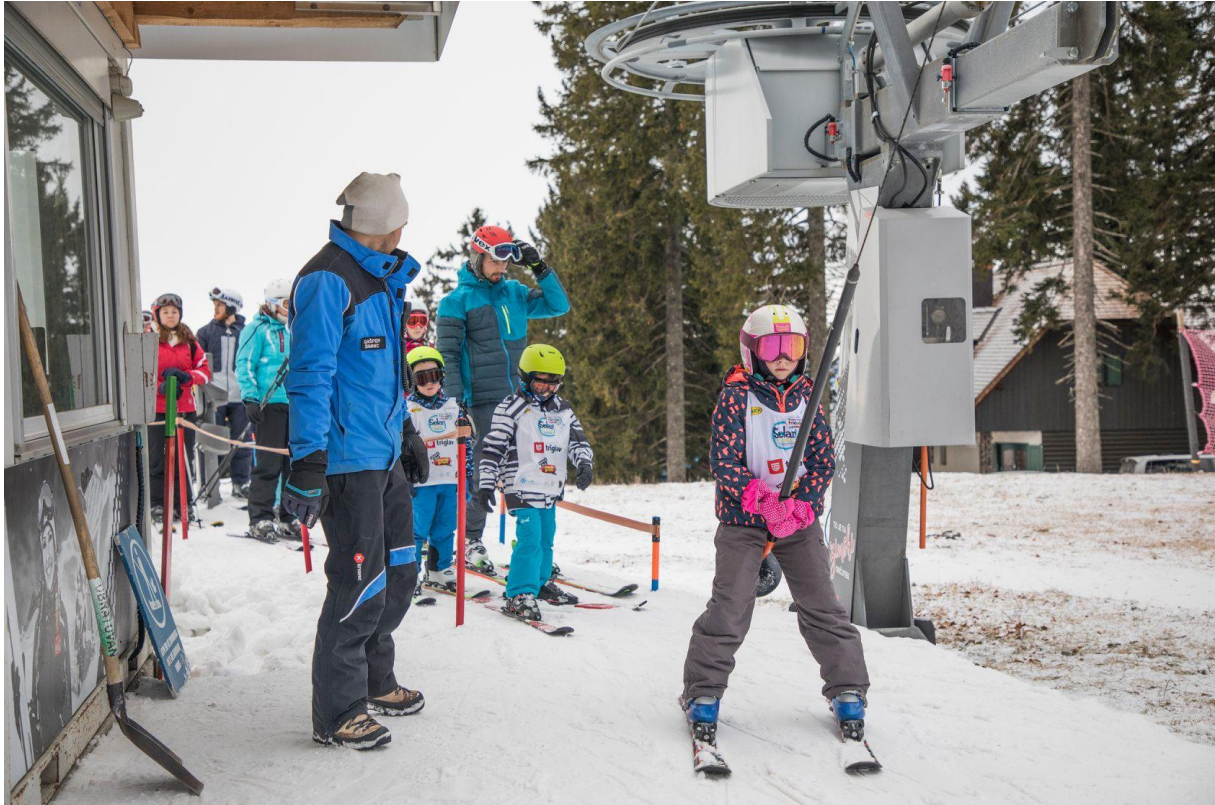
Slika 16. Vožnja na vučnici

staviti ono dijete za kojeg procijeni da je do tog trenutka najbolje svladalo elemente skijaške tehnike. Također učitelj treba upozoriti djecu da, ukoliko padnu prilikom vožnje na vučnici, odbace tzv. tanjurić te da se čim prije pokušaju maknuti iz koridora kojim vozi vučnica. Zatim trebaju pričekati učitelja ili se na siguran način spustiti do polazišne točke vučnice. Ukoliko dijete ne može samostalno koristiti vučnicu, možemo mu pomoći tako da ga između nogu dovedemo na vrh. Tako će dijete dobiti osjećaj za samostalnu vožnju (HZUTS, 2007).