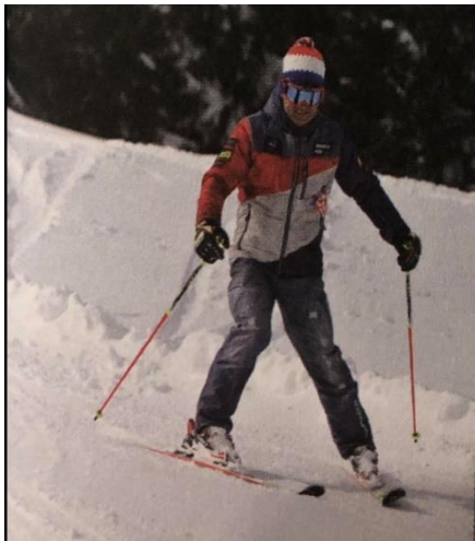
Prva faza plužno paralelnog zavoja- skije su u plužnom položaju