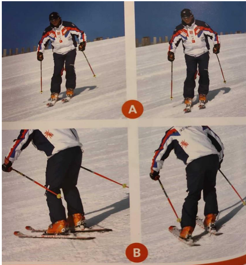
Slika 20. Izvedba spusta koso: A) prednja strana tijela, B) stražnja strana tijela

Za djecu ovo može biti vrlo interesantan element u kojem oni međusobno gledaju i procjenjuju tko je ostavio jasniji trag. Na taj način, kroz igru, nesvjesno usvajaju ovaj element škole skijanja.