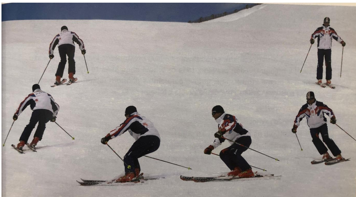
Slika 22. Izvedba zavoja k brijegu - prva varijanta izvedbe (vođenje skija i kružna gibanja nogu)

Načini izvođenja zavoja k brijegu prikazani su na slikama 22, 23 i 24.