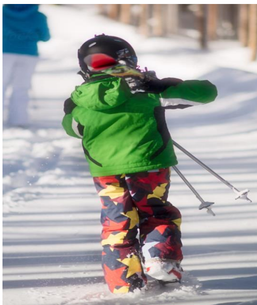
Slika 2. Nošenje skija na otvorenom