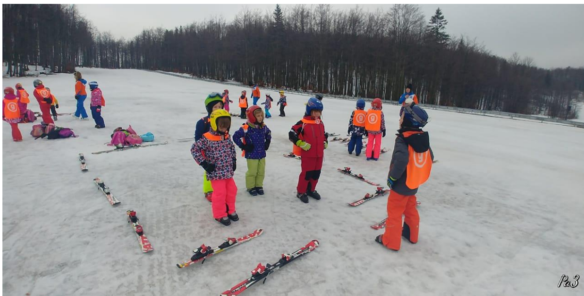
Slika 5. Opće pripremne vježbe - „zagrijavanje“

Nakon što su djeca dobro zagrijana, potrebno im je pokazati kako se uspostavlja ravnoteža na jednoj skiji. Važno je da se ova vježba izvodi na ravnom ili na dijelu staze s blagim padom.