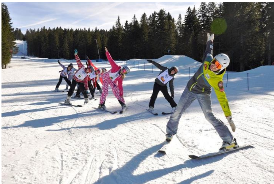
Slika 19. Plužni zavoj – „avion“