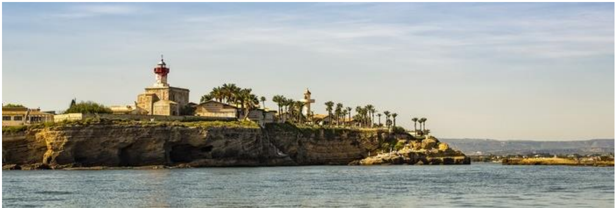
Slika 7. Otok Ortygia