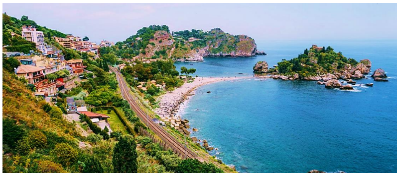
Slika 8. Taormina