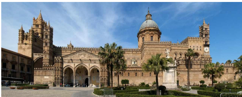
Slika 5. Katedrala u Palermu