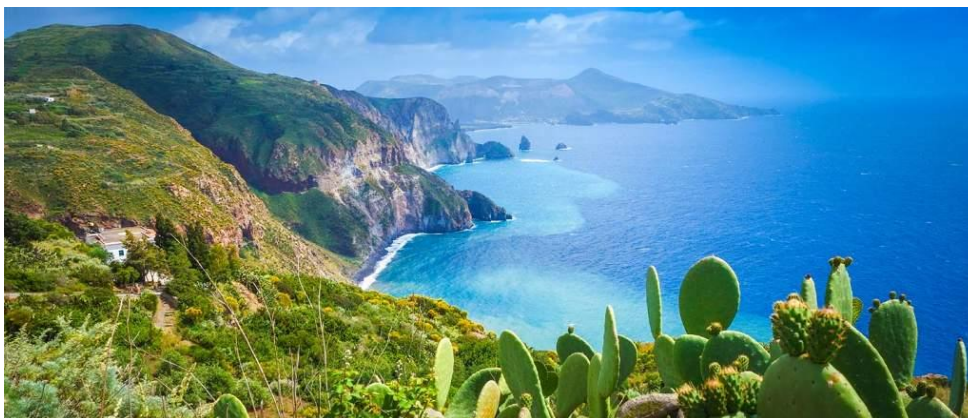
Slika 2. Liparski otoci