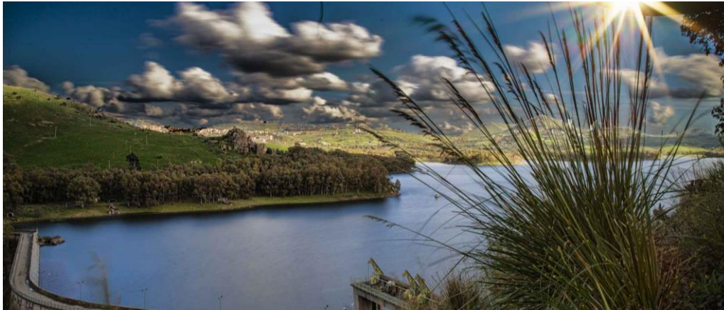
Slika 4. Jezero Pozillo