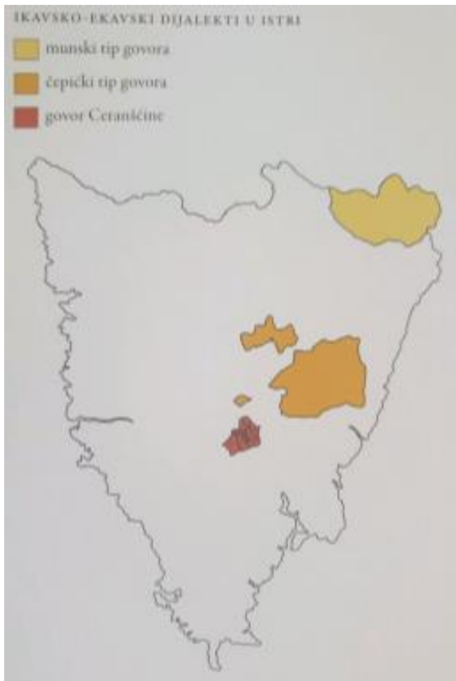
Slika 3. Ikavsko-ekavski dijalekti u Istri