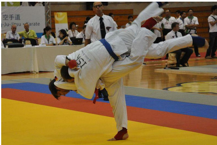
Slika br. 7. Fighting system

Borbe su podijeljene na tri dijela, ili tri segmenta: Prvi dio se sastoji od toga da natjecatelji vode borbu iz daljine i smiju udarati rukama i nogama. U trenutku kada se borci ulove za Gi (kimono), borba ulazi u drugi dio kada udarci više nisu dopušteni. U tim trenucima borci započinju s bacačkim tehnikama (tehnikama koje možemo gledati na judaškim natjecanjima). Bodovi se dodjeljuju prema tome koliko je 'čista' i učinkovita tehnika. Kada se borba preseli u parter (ne – waza), ulazi u svoj treći dio. U tom segmentu bodovi daju za tehnike imobilizacije, kontrolirana gušenja ili poluge na zglobovima tijela koja tjeraju protivnika na predaju. Pobjednik je natjecatelj koji je skupio više bodova u borbi i izveo bolju tehniku u sva tri dijela, ili postizanjem ippona u sva tri dijela. U tom slučaju borba će biti završena prije isteka vremena. Ova vrsta natjecanja zahtijeva sjajnu kondicijsku pripremu i dobro poznavanje različitih tehnika ju jitsua.