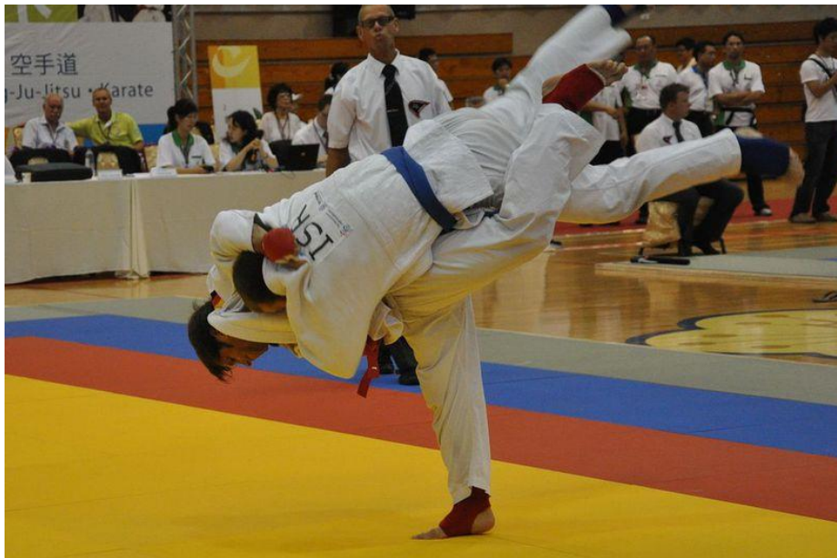
Slika br. 7. Fighting system

Borbe su podijeljene na tri dijela, ili tri segmenta: Prvi dio se sastoji od toga da natjecatelji vode borbu iz daljine i smiju udarati rukama i nogama. U trenutku kada se borci ulove za Gi (kimono), borba ulazi u drugi dio kada udarci više nisu dopušteni. U tim trenucima borci započinju s bacačkim tehnikama (tehnikama koje možemo gledati na judaškim natjecanjima). Bodovi se dodjeljuju prema tome koliko je 'čista' i učinkovita tehnika. Kada se borba preseli u parter (ne – waza), ulazi u svoj treći dio. U tom segmentu bodovi daju za tehnike imobilizacije, kontrolirana gušenja ili poluge na zglobovima tijela koja tjeraju protivnika na predaju. Pobjednik je natjecatelj koji je skupio više bodova u borbi i izveo bolju tehniku u sva tri dijela, ili postizanjem ippona u sva tri dijela. U tom slučaju borba će biti završena prije isteka vremena. Ova vrsta natjecanja zahtijeva sjajnu kondicijsku pripremu i dobro poznavanje različitih tehnika ju jitsua.