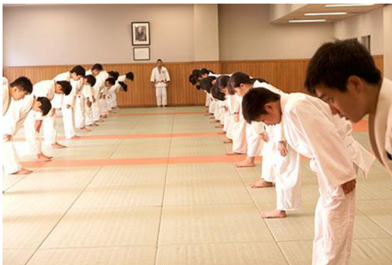
Slika br. 5. Naklon u stojećem stavu – ritsurei

Na tatamiju vladaju posebna pravila ponašanja, koja su tradicijom usvojena. Prema njima judaš u vrsti ili redu zauzima položaj koji mu po rangu pojasa pripada; pri dolasku na tatami na početku i kraju treninga, pri izlazu s tatamija i svakom obraćanju treneru ili suvježbaču judaš izvodi ritsurei ili zarei. Ritsurei je naklon u stojećem stavu, a zarei je naklon u klečećem stavu. Postoji i formalni, pun poštovanja, stojeći naklon kada se tijelo nagine za 45 stupnjeva (hairei). Judaš bez pogovora sluša trenera i starije, više rangirane judaše i stoji im na raspolaganju, pomaže mlađima od sebe i niže rangiranim judašima. Na treningu radi samo ono što mu naređuje trener i što je sadržaj rada. Za vrijeme učenja i vježbanja juda marljiv je, ozbiljan, pažljiv i šutljiv, ne komentira naloge trenera ili odluke sudaca, pokazuje emocije suzdržano i ne vrijeđa druge, svaku kaznu i kritiku prihvaća najozbiljnije, svaku borbu i randori provodi u okviru pravila borbe poštujući fair-play, za vlastitu povredu ne okrivljuje nikoga i prima je stoički, povrijeđenom suvježbaču pruža pomoć do dolaska trenera i održava higijenu tijela, judogija te tatamija.