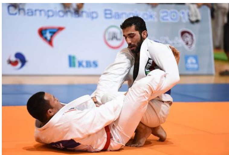
Slika br. 8. Ne – waza ili brazilski ju jitsu

Ne - waza ili brazilski ju jitsu je izrazito taktički sport. Treba napomenuti kako je brazilski ju jitsu ili ne - waza danas najpopularnija borilačka vještina prevedena u sport. Zanimljiva činjenica je da je na posljednjem Europskom prvenstvu bilo prijavljeno više od 3500 natjecatelja ( https://hjjs.hr/ju-jitsu/o-sportu/ ).