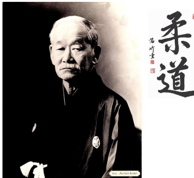
Slika br. 1 Jigoro Kano

Iz tradicionalne japanske vještine ju jitsu ili ju jutsu, nastao je judo. O porijeklu ju jitsu (nježna umjetnost, vještina) postoje dvije različite teorije. Prema prvoj teoriji, koja se temelji na dokumentu „Kokushoi“ 5 , ju jitsu je u Japan iz Kine, gdje je nosila ime jiu jitsu, prenio Kinez Chen Yuan–Ping između 1644. i 1648. godine. Druga teorija se temelji na dokumentu „Nihon shoki“, prema kojem se može pretpostaviti kako su ju jitsu i sumo, japansko hrvanje, potekli iz borbene vještine bez oružja „Chikara kurabe“ (odmjeravanje snage) koja se vježbala još 230. godine pr. Kr. i u kojoj su se održavala natjecanja (Sertić, 2004). Ju jitsu se može definirati kao vještina napada i obrane bez ili, samo ponekad, s oružjem u borbi s protivnikom bez ili s oružjem.