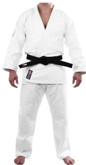
Slika br. 4. Judogi - odjeća za vježbanje juda

Judogi je odjeća za vježbanje juda; kimono za vježbanje juda i natjecanje čini komplet: hlače, kaput, pojas. Za natjecanje i trening uobičajeno se koriste kimona od pamuka ili sličnih čvrstih materijala bijele ili plave boje, koja ne smiju biti oštećena. Na natjecanjima, prvoprozvani natjecatelj treba imati bijeli, a drugoprozvani natjecatelj plavi kimono. Materijal ne smije biti toliko čvrst i debeo da bi protivniku onemogućio hvat. Za natjecanje i trening mora biti čist, suh i bez neugodna mirisa te svojoj veličinom odgovarati visini i težini judaša. Rukavi kimona moraju prelaziti polovicu dužine podlaktice natjecatelja kada su ruke ispružene vodoravno ispred tijela, a nogavice donji dio polovice potkoljenice.