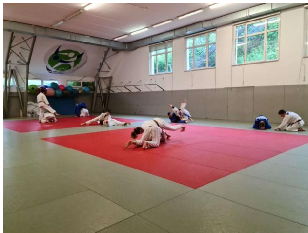
Slika br. 2 Dojo (dvorana za vježbanje juda)

Judo je dvoranski sport. Dojo ili dvorana za vježbanje juda prekrivena je strunjačama (tatami). Uvjeti koji osiguravaju kvalitetan trenažni rad su prozračnost, dobro osvijetljenje, prostranost, dobra opremljenost tehničkim napravama za trening koje nisu opasne za vježbače na strunjači te besprijekorna čistoća. Obuća u kojoj se dolazi do dvorane (japanke, papuče) ostavlja se uredno ispred ulaza u dvoranu ili unutar dvorane u liniji uza zid izvan tatamija. Običaj je da se dvorana ukrasi nacionalnom zastavom, portretima zaslužnih judo velikana te obveznim portretom Jigoro Kana. U dvorani nije dopuštena vika, jurnjava i buka i svi se vježbači s poštovanjem odnose prema treneru od početka do kraja treninga. Svi judaši za cijelo vrijeme boravka u dvorani ponašaju se u skladu s etičkim načelima juda. Međusobno pozdravljanje pri ulazu u dvoranu prije zajedničkih vježbi s trenerom odvija se prema uobičajenim standardima. Viši su pojasevi pri postrojavanju na početku i kraju treninga na početku vrste ili u prvoj liniji, a niži na kraju vrste ili u drugoj liniji. Niži pojasevi se prema višim pojasevima uvijek odnose s poštovanjem.