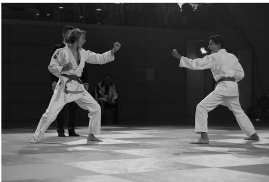
Slika br. 6. Duo system

Precizni udarci nogama i rukama, dinamična bacanja te vrhunska tehnika osnovne su značajke ovog sustava.