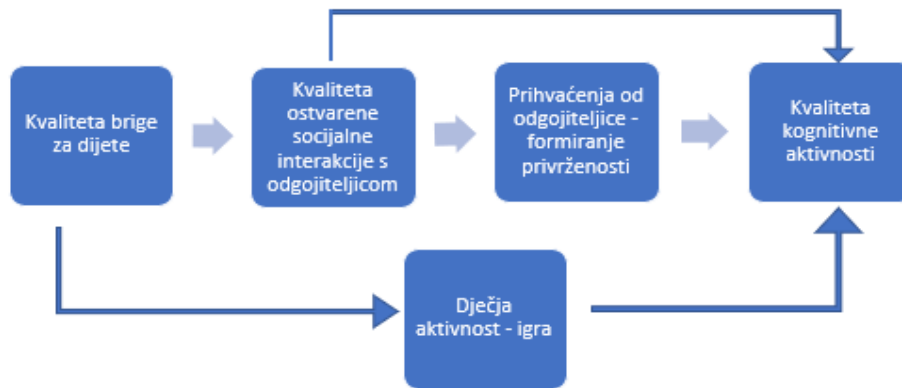
Slika 3. Model kognitivne stimulacije (Klarin, 2017:40)

Howes i Smith (1995) predlažu model u svrhu objašnjenja odnosa između kvalitete brige za dijete i kognitivne aktivnosti.