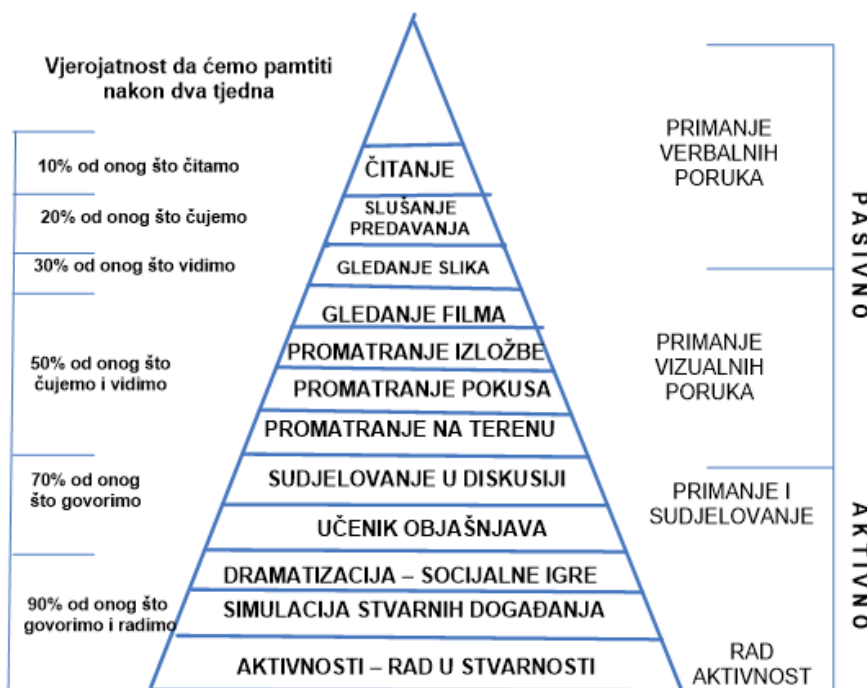
Slika 4. Daleov stožac iskustava (Milan Matijević., Izvor medijaja i didaktičkih strategija u svijetu Deleova stošca iskustva)

Važno je pitanje subjekta u nastavi prema kojemu se određuje primjena i tip nastavne strategije i metode. Njih treba primijeniti na kognitivno, afektivno i psihomotorno područje koje je važno za razvoj cjelokupne ljudske jedinice i ostvarenje njenog punog potencijala, Tradicionalna nastava usmjerena je uglavnom samo na kognitivno područje dok se ostala dva zanemaruju. Daleov stožac iskustva je polazište za izbor nastavnih metoda, didaktičkih strategija i nastavnih medija.