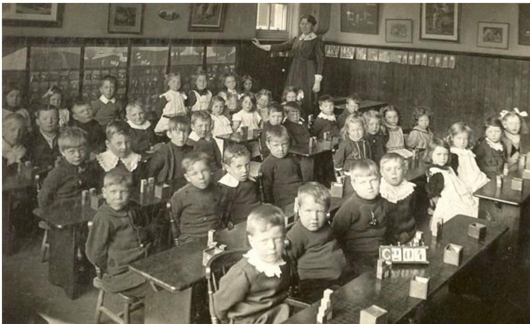
Slika 1. Učionica iz prošlosti

Inovativni načini rada postavljaju učenika u prvi plan jer su učitelji svjesni da razred nije homogena skupina. Svaki razred čine učenici koji se razlikuju po tempu učenja, načinu učenja, predznanju i slično.