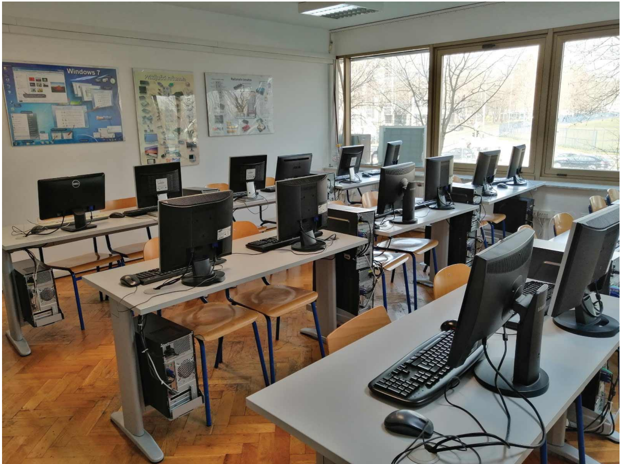
Slika 2. Učionica sadašnjosti