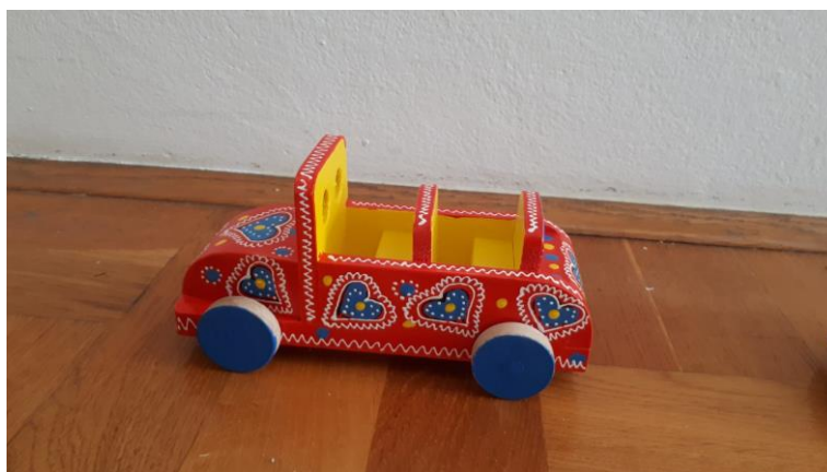
Slika 13. Drveni auto

Životinje su jedan od omiljenih drvenih predmeta među djecom. Prva drvena životinja koja je nastala bio je konj. Od jednostavnog konja obojenog u dvije boje (crna i bijela), danas imamo igračke koje na sebi imaju dodatke kao što su griva i konjski rep od tkanine, kočije, sedla te manje i veće figurice konja. Njihova specifična boja je crna sa bijelim, no možemo ih naći i u bijeloj, plavoj ili crvenoj boji. Istoj skupini sa životinjama pripadaju i prijevozna sredstva. U počecima su to bila kola uz konje. Uz vrevu gradskog i suvremenog prijevoza, počinju se izrađivati i druga prijevozna sredstva kao što su vlakovi, avioni, traktori, kao i dodaci na prijevozna sredstva kao što su vagoni ili prikolice (Župančić, 2008). Na slikama 12., 13. i 14. prikazane su igračke drvenih životinja i prijevoznih sredstava.