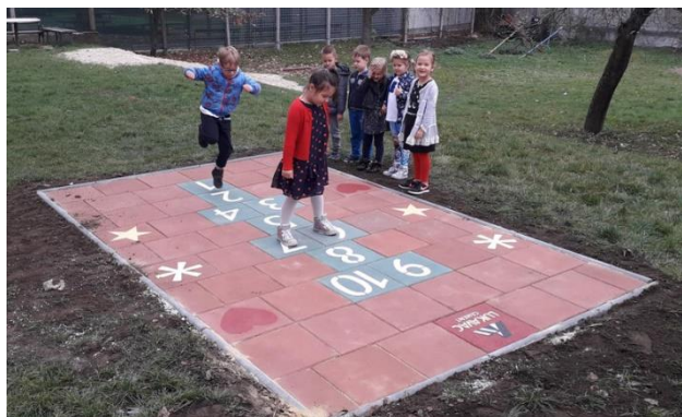
Slika 4. „Školica“ u vrtiću Lastavica 14

Školica je naziv na standardnom hrvatskom jeziku za igru „Štrofanje“. Igra je namijenjena i djevojčicama i dječacima, a igra se sa minimalno dva, a maksimalno šest igrača. Teren je u prošlosti bila zemljana ili pjeskovita podloga, a danas se igra na asfaltu. Polja za skakanje crtaju se od broja jedan pa do devet ili čak deset. Školica se u prošlosti igrala kao i danas. Bacao se kamen, redom po poljima od jedan pa sve do zadnjeg broja, jedno po jedno polje. Svaki igrač stoji iza polja označenog brojkom 1 i baca kamen poštujući redoslijed brojeva. Ako je kamen u dogovorenim okvirima broja, igrač tada skače do zadnjeg broja i unatrag te na povratku uzima kamen. Taj igrač igra sve dok ne pogriješi ili ne baci kamen u pogrešno polje ili izvan dogovorenih linija. Pobjednik je onaj koji je zadnji došao do kraja „školice“, odnosno bacio kamen do zadnjeg broja.