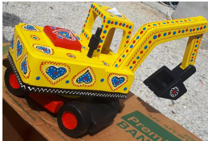
Slika 16. Drveni bager