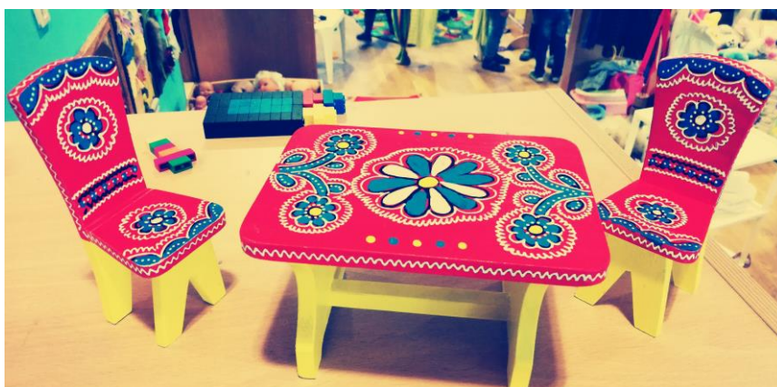
Slika 10. Stol i stolice