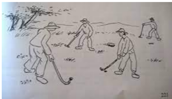
Slika 5. „Šečkanje“ 15

U ovoj igri sudjelovali su i djevojčice i dječaci te je broj igrača neograničen. U nekim mjestima igra se zvala i prasičanje . Igra se igrala pomoću grani od vrbe. Te grane mogle su se birati samo na početku igre ili svakog novog kruga. Grana se nalazila na polju na kojem su se igrali. Obično je to uvijek bilo isto mjesto u selu. Trebala je biti dosta debela da ne pukne i dugačka da dohvati loptu. Ako bi grana pukla, igrač više nema prilike uzeti novu. Svi koji su igrali stali su u krug i uzeli lopticu. Lopticu je uzeo jedan od igrača i pomoću grane od vrbe gurnuo nekome iz kruga. Kome bi loptica izašla iz kruga, ispao bi iz igre. Igralo se dok ne bi ostalo nekoliko igrača u krugu.