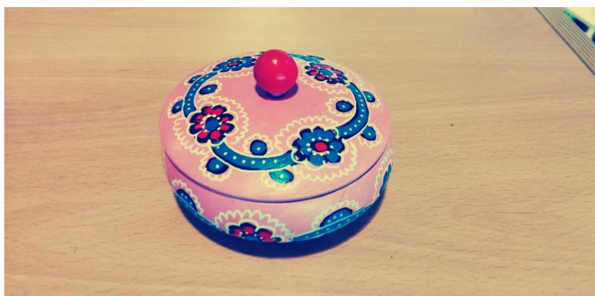
Slika 12. Drvena posuda za čuvanje nakita