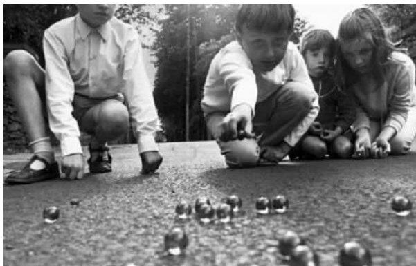
Slika 3. Prikaz igre „Špekulanje“ 13

Književni naziv za igru je pikulanje. U igri mogu sudjelovati i djevojčice i dječaci. Broj igrača je neograničen. Igra se na zemljanoj površini gdje se nalazi rupica za gađanje udaljena od startne linije 4 do 5 metara. Svi igrači stoje iza startne linije te bacaju pikulu redom koji je dogovoren unaprijed. Cilj je pikulu baciti što bliže rupici. Tko je najbliže rupici ima pravo gađati drugi put. Ako pogodi rupicu ima pravo gađati druge pikule i uzeti ih. Ako ne pogodi rupicu gađa sljedeći najbliže njoj. Velika pikula zvala se TOP i mogla se dobiti mijenjanjem malih pikula (3 ili 4 komada).