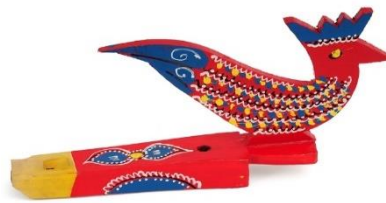
Slika 7. Drvena žveglica u obliku kokota 17

Druga vrsta žveglica su dvojnice. Za razliku od jedinki, dvojnice imaju dvije udubljene cijevi, te imaju dva reda okomitih tipki. Izgledom podsjeća na dvije skupljene jedinke. Istovremeno se puše u obje jedinke i tako se proizvodi zvuk drukčiji od zvuka na jedinki.