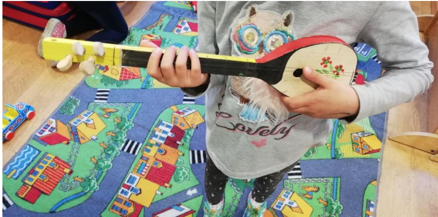
Slika 8. Drvena dječja tamburica