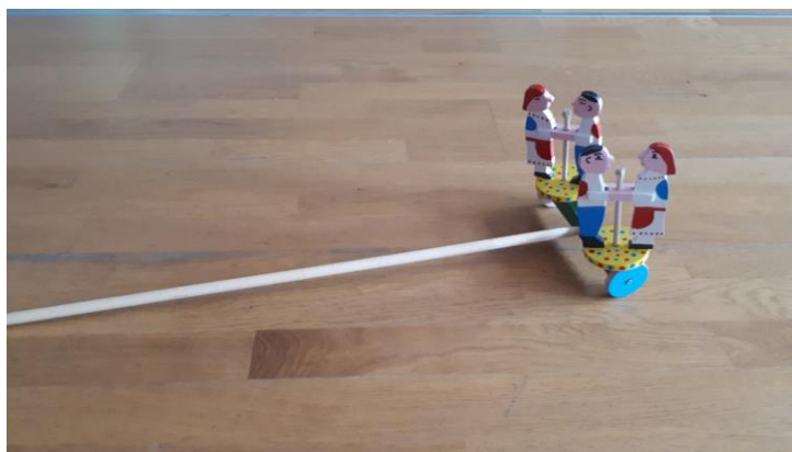
Slika 18. Plesači