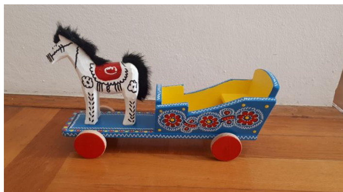
Slika 14. Drveni konj i kočija