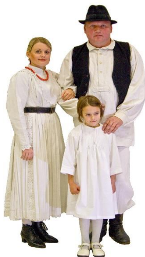
Slika 2. Zagorska narodna nošnja 11