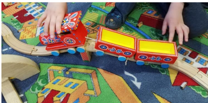
Slika 19. Drveni vlak u funkciji igre 20

ispričao jedan dječak, a oslikala su je sva djeca iz skupine. Slikovnica je sastavljena od slika tradicijskih drvenih igračaka kojima su se djeca tijekom projekta igrala.