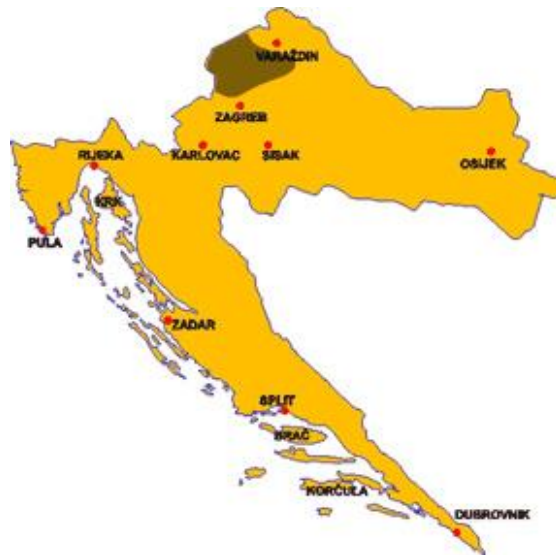
Slika 1. Geografski položaj Hrvatskog zagorja 3

U Hrvatskom zagorju prosječna je godišnja temperatura između 9°C i 12°C i prevladavaju kontinentalni utjecaji. Godišnje padne oko 900 do 1200 mm oborina te su oborine raspoređene tijekom cijele godine pa nema sušnih razdoblja. Mreža tekućica Zagorja bogata je i relativno razvijena, no nijedna rijeka nema osobito veliki protok, osim za vrijeme dugotrajnijih oborina kada rijeke nabujaju. Glavne tekućice su Krapina, Bednja i Sutla (Brezinščak-Bagola, Cesarec, Klemenčić, 2017).