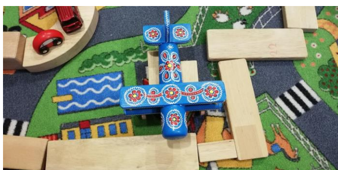
Slika 20. Drveni avion u funkciji igre