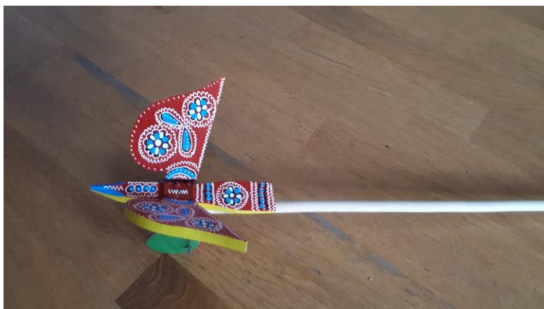
Slika 17. Drveni leptir na štapu