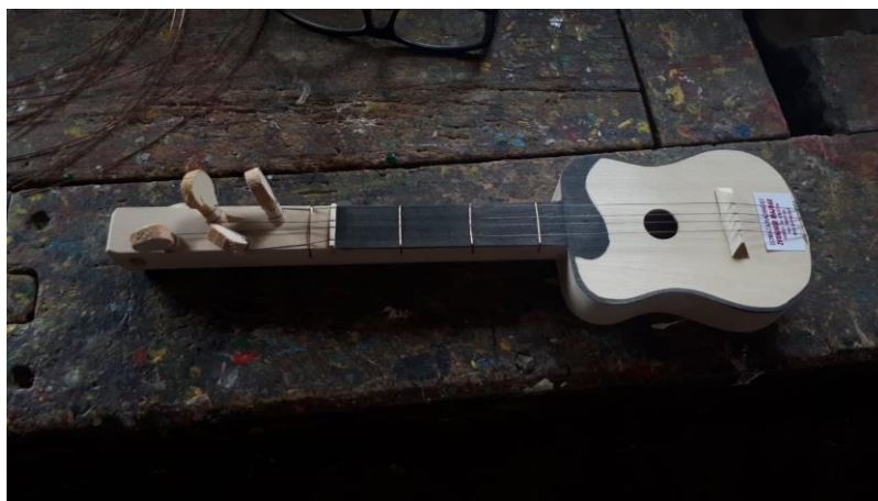
Slika 9. Drvena gitara