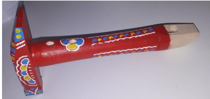
Slika 6. Jedinka u obliku čekića