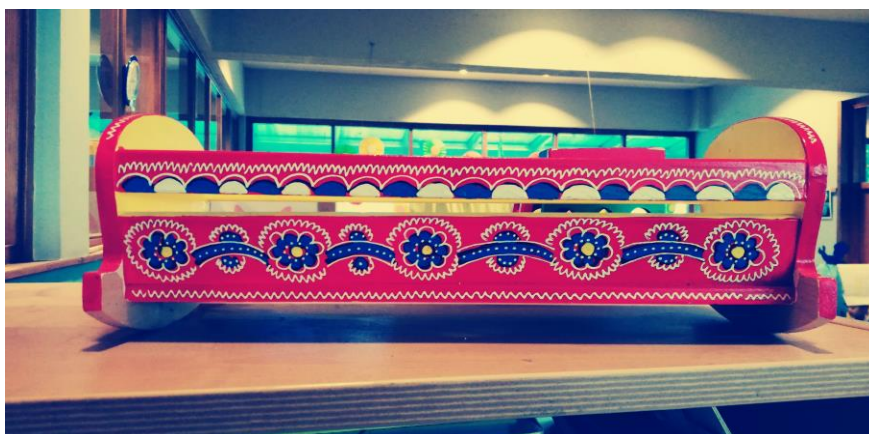
Slika 11. Kolijevka ili zipkica (osobna arhiva)