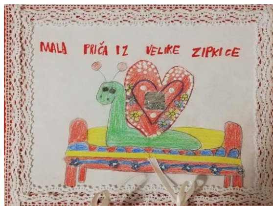
Slika 21. Naslovnica slikovnice „Mala priča iz velike zipkice“