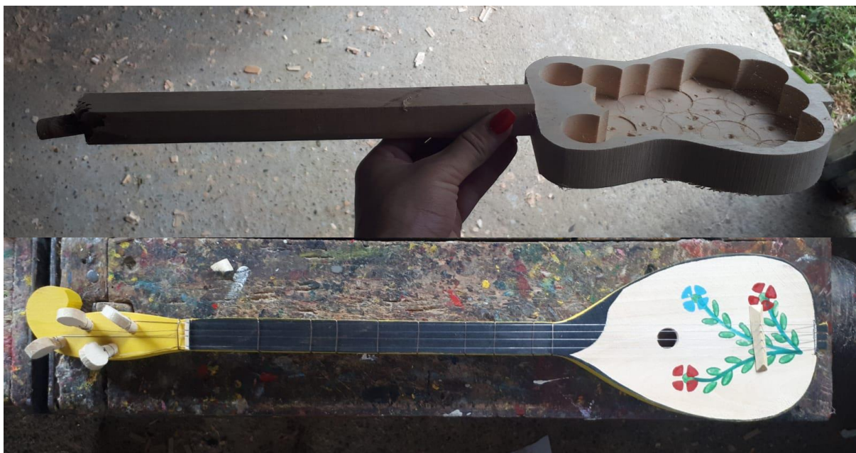
Slika 22. Proces nastajanja tamburice