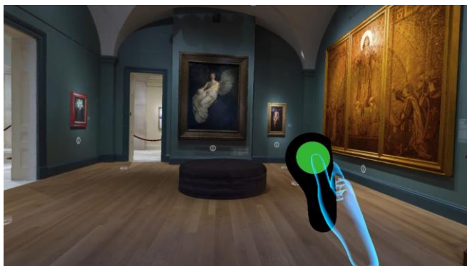
Sl.1. Prikaz animacije virtualnog muzeja

kulturom odnosno muzejima. Tako je primjerice Arheološki muzej u Zagrebu stvorio na svojoj stranici razne 3D virtualne šetnje muzejom, izradili su u virtualnom obliku i 3D modele arheoloških predmeta koje posjetitelj može istražiti i razgledati kao da je fizički tamo.