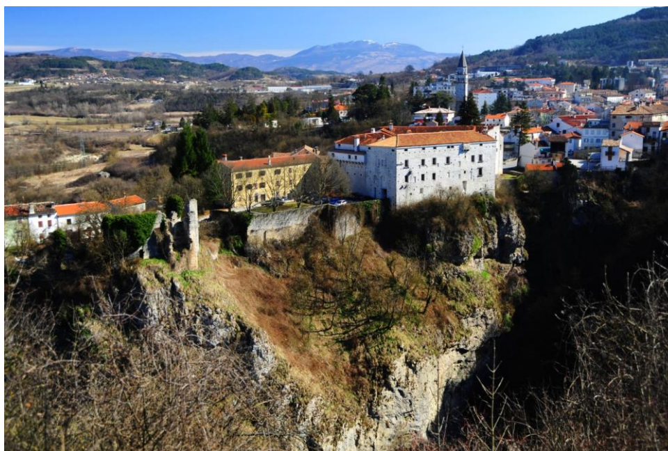
Sl. 4. Pazinski Kaštel

vlasništvo A. Mosconija i tada se obavljaju najveći radovi na poboljšanju uvjeta stanovanja i obrane. 61 Godine 1639. izvedena je kapelica sv. Marije Djevice s drvenim oltarom u niši viteške dvorane u drugoj etaži. Godine 1766. Knežiju kupuje talijanska obitelj Montecuccoli iz Modene koja je posjed zadržala do 1945. godine. U dugoj povijesti Kaštel je pored važne obrambene uloge imao i funkciju sjedišta vlasti, dakle, javnu i stambenu namjenu. Neko vrijeme služio je kao zatvor, a u ratnim vremenima i kao zbjeg. 62 U poslijeratno vrijeme preuzeo je funkciju muzejskog izložbenog prostora, te je od 1962. godine u njemu smješten Etnografski muzej Istre – Museo etnografico dell'Istria. Danas u pazinskom kaštelu djeluju dva muzeja: Muzej grada Pazina i Etnografski muzej Istre - Museo etnografico dell'Istria . 63 Ove muzeje možemo klasificirati kao muzeje koji su se smjestili u adaptiranoj povijesnoj zgradi prema Menschovoj podjeli (1992).