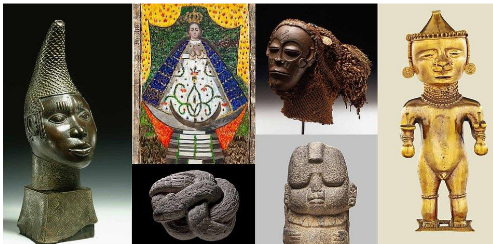
Sl.7. Neki od izložaka u Etnografskom muzeju u Berlinu

usluge turistima od fitness centra do caffe bara i restorana te se isto tako nalazi u neposrednoj blizini čak dva muzeja od kojih je jedan Etnografski muzej Berlina.