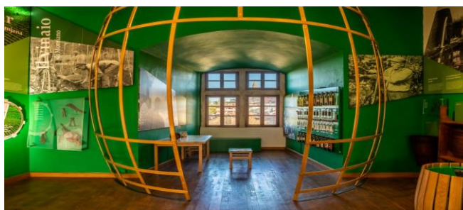
Sl. 5. Stalni postav Etnografskog muzeja Istre

Vinar iz Momjana - Istarsko tlo, osobito ono sjeverozapadne Istre, oduvijek je bilo pogodno za kultivaciju vinove loze. Uz masline u južnoj Istri, vinova je loza i danas dominantna poljoprivredna kultura. Pritom, Momjan je mjesto u kojem se spajaju vinogradarska tradicija i suvremeni eno-gastronomski i vinarski tokovi. Da bi shvatili značaj vinogradarstva i vinarstva za ovo malo istarsko mjesto, dovoljno je znati da je svetac zaštitnik Momjana sv. Martin i da ovu regiju karakterizira muškati momjanski, autohtona sorta jedinstvena na svijetu. 66 Stoga Momjan ima i vrlo razvijen gastronomski turizam i razne vinske ture te posjete vinarijama, održavanje degustacija i sl.