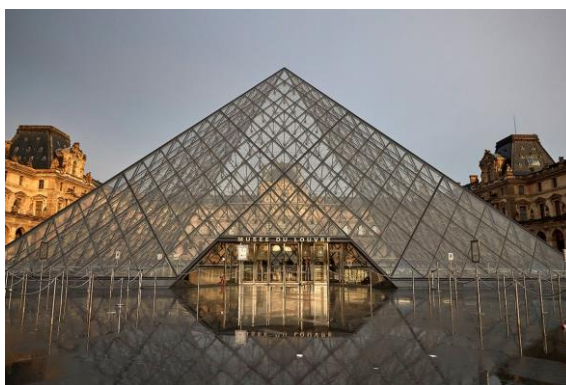
Sl. 2. Muzej Louvre u Parizu

Muzeji moraju za vidljivost i prepoznatljivost svojih zbirki stvoriti jedinstvenu prodajnu ponudu kako bi bili "identificirani" na međunarodnom tržištu. Riječ je o strateško-marketingškom instrumentu kojega mnogi anketirani muzeji nisu svjesni, ali koji ima važnu ulogu u njihovu tržišnom nastupu. Stoga je tematiziranje i fokusiranje na zbirke jedino rješenje kako bi se izbjegle vječne rasprave o različitim vremenskim horizontima tih dvaju "svjetova" kulture i turizma. Kad se pri tematiziranju i fokusiranju istakne jedinstvena prodajna ponuda u regionalnom, ali i u međunarodnom okruženju, osigurana je natjecateljska sposobnost. Za uspjeh muzeja potreban je kvalitetan marketing okrenut posjetitelju. Posjet muzeju mora biti zamijećen kao cjelina i kao lanac usluga, a sam muzej prepoznat kao uslužno poduzeće. 29 Dobar marketing moguć je samo na osnovi točnog poznavanja karakteristika posjetitelja, uz pretpostavku da muzeji svoju publiku i njihove zahtjeve dobro upoznaju, primjerice putem provođenja anketa.