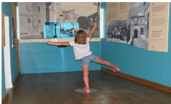
Sl. 6. Stalni postav Etnografskog muzeja Istre