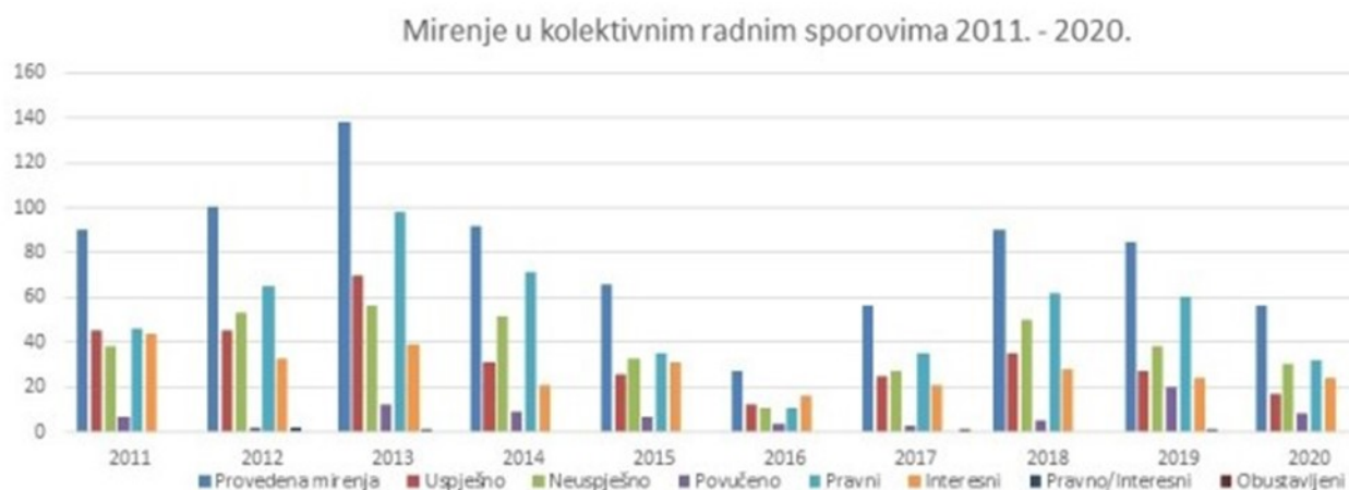
Grafikon 1. Prikaz mirenja u kolektivnim radnim sporovima između 2011. – 2020