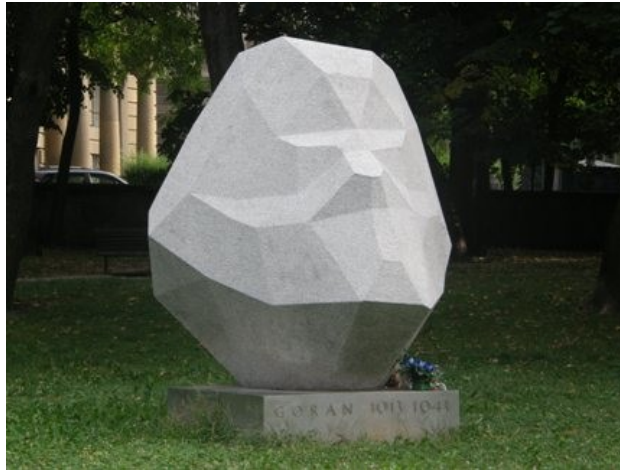
Slika 4. Spomenik Ivanu Goranu Kovačiću